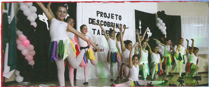
Em Formosa do Oeste, o projeto patrocinado foi o Descobrimo Talentos