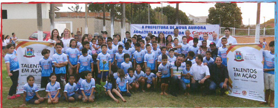
Projeto realizado em parceria com o Município de Nova Aurora, Talentos em Ação