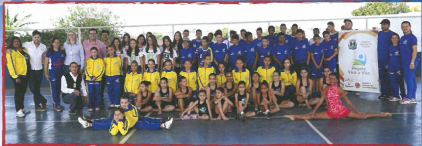
Viva a Vila, é o projeto realizado em parceria com a prefeitura de Goioerê