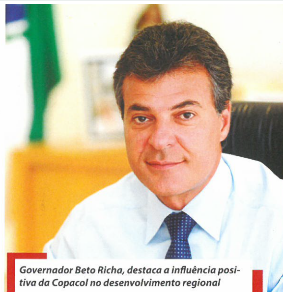
Governador Beto Richa, destaca a influência positiva da Copacol no desenvolvimento regional

vemos a oportunidade de investir na avicultura e melhorarmos a qualidade de vida, agora vamos aproveitar e investir também na piscicultura", destaca Izair.