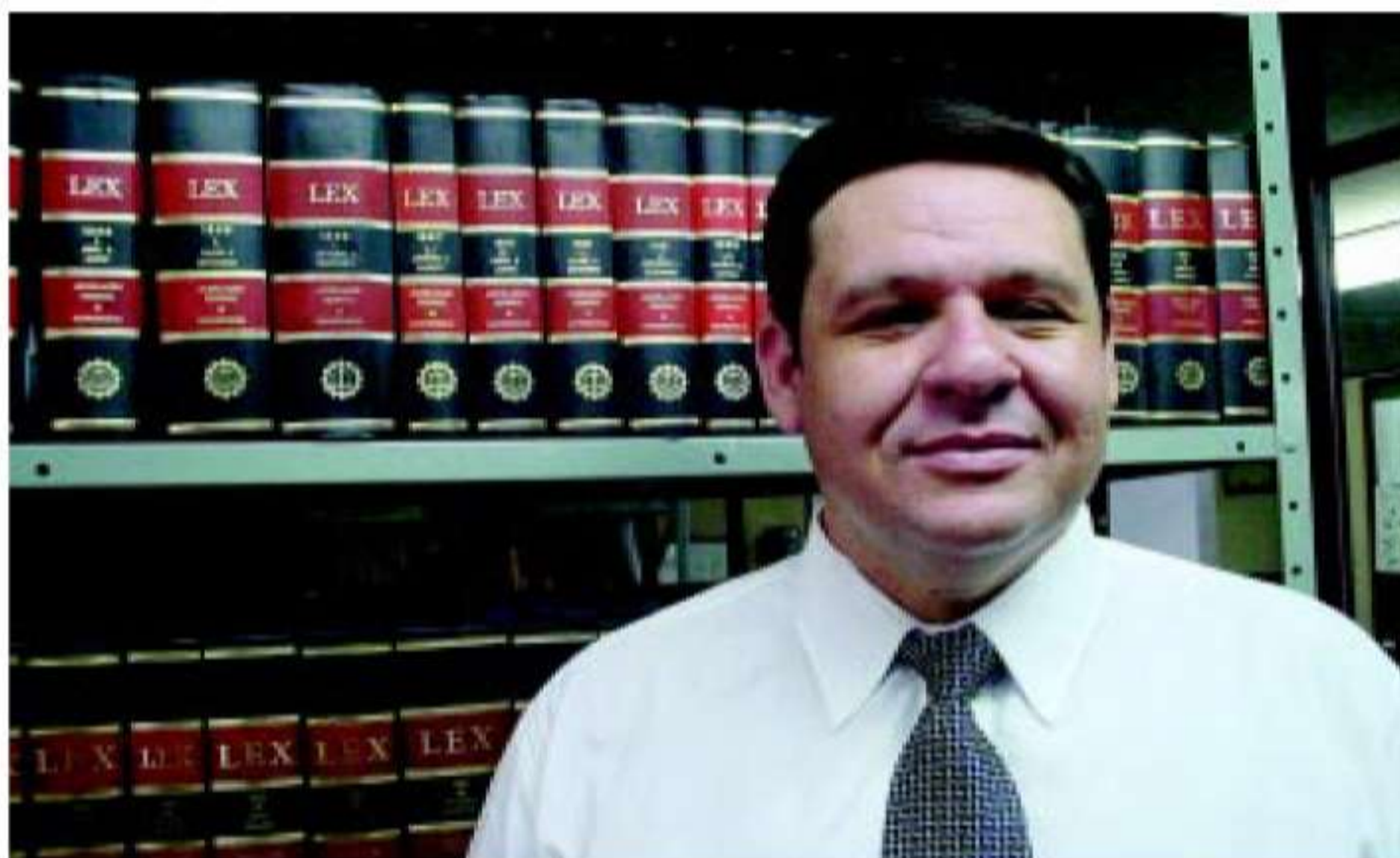
Stöberl: “o produtor rural está num emaranhado de obrigações, cercado de todos os lados”

O advogado lembra que o cidadão deve obedecer e para tanto conhecer, as leis federais, estaduais, municipais, “estar preparado para receber fiscalização estadual e federal, preencher for-