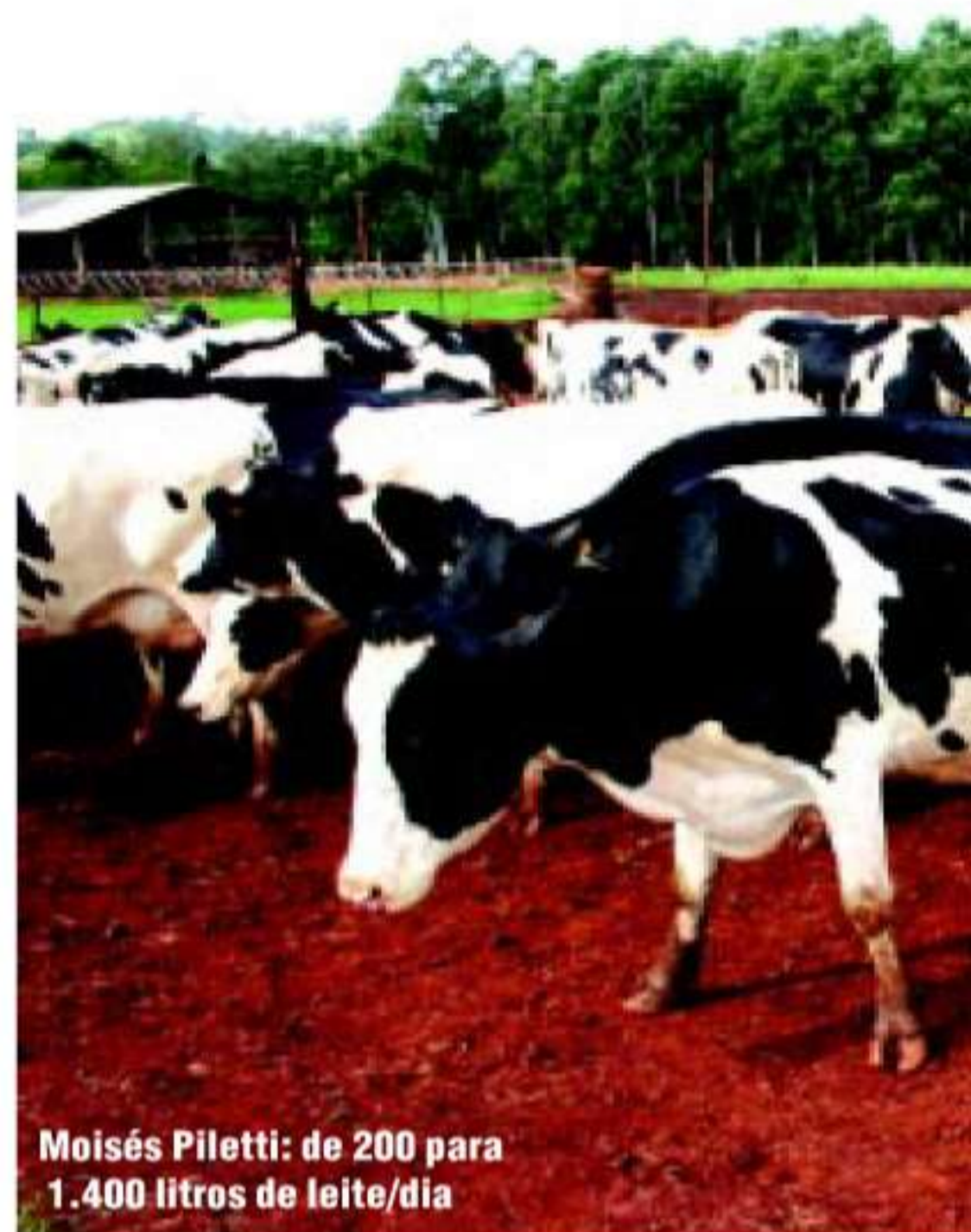
Moisés Piletti: de 200 para 1.400 litros de leite/dia

O repasse de informações, técnicas e de mercado, os cursos e treinamentos fazem parte da política de fomento da coo-