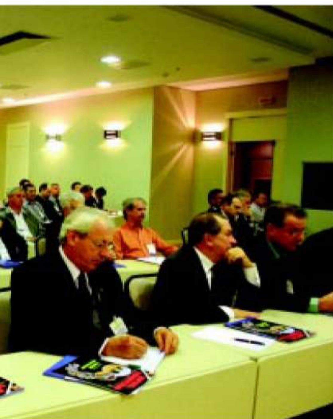
da esquerda para a direita) e dirigentes do Paraná

vam sendo empenhados, totalizando R$ 70 milhões. “Estamos trabalhando para que este setor vital, que é a defesa sanitária, consiga a totalidade dos recursos necessários”.