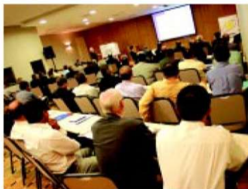
Ministro Paulo Bernardo, no Fórum dos Presidentes das Cooperativas Agropecuárias