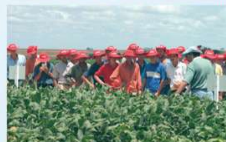
Difusão de Tecnologias aos Cooperados

COAMO AGROINDUSTRIAL COOPERATIVA Forte como o homem do campo.