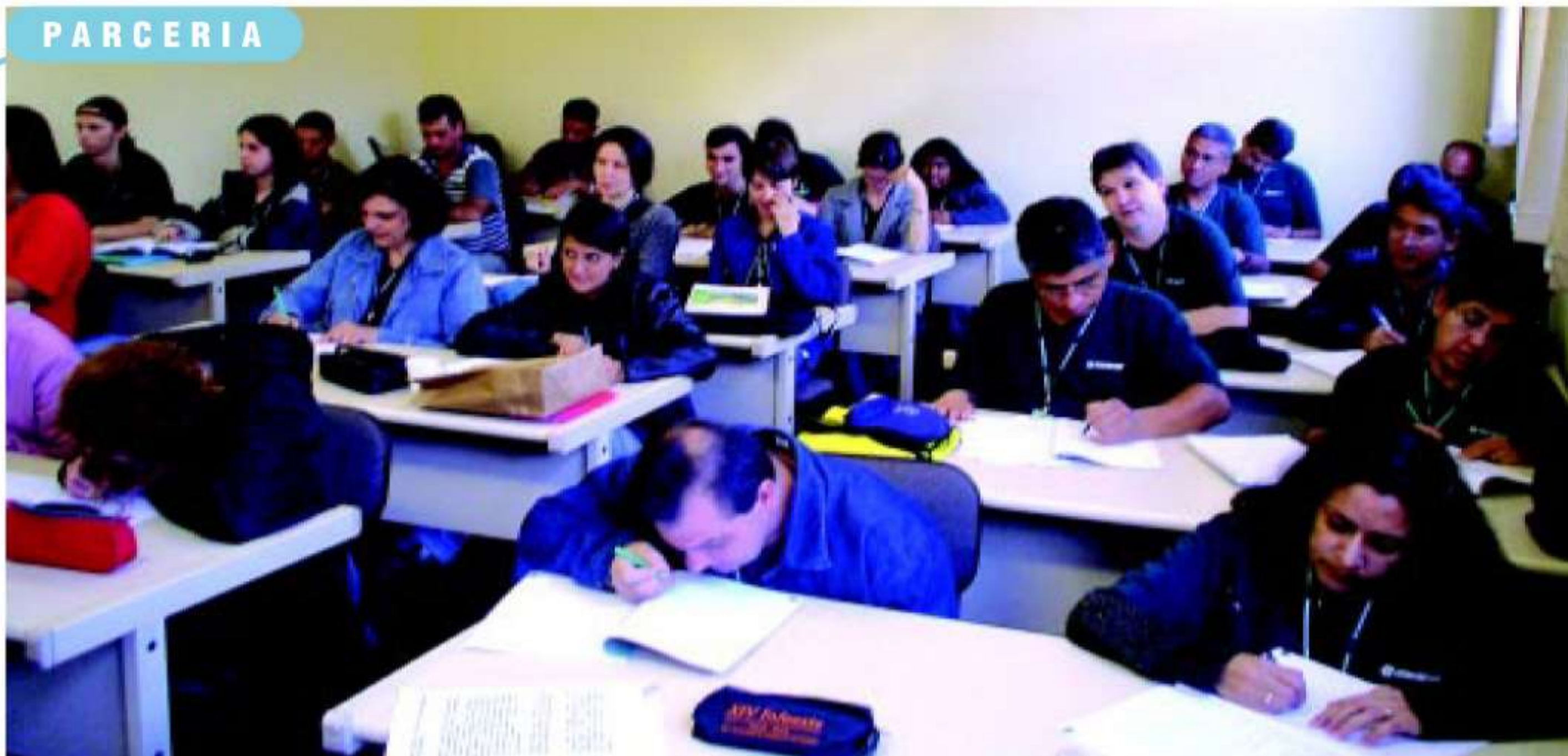
Alunos recebem orientações sobre a área administrativa