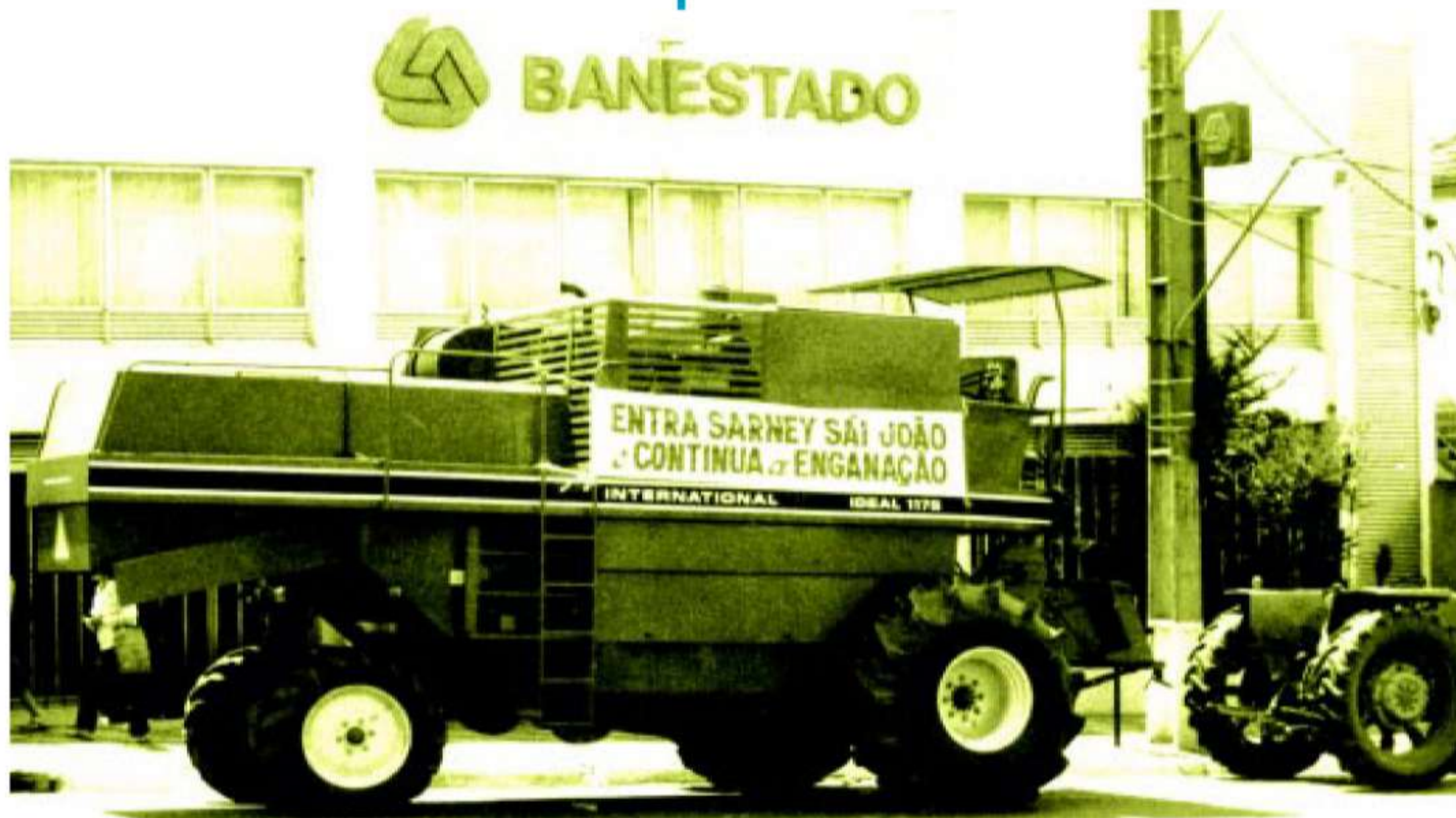
Manifestação realizada por produtores rurais no ano de 1985 no Paraná

A exemplo do que já havia ocorrido na década anterior (1985), quando milhares de produtores organizaram a “Marcha à Brasília”, no ano de 1995, produtores rurais, inconformados com o descaso do governo federal em relação às dificuldades do campo, realizaram grande mobilização para protestar contra o não cumprimento da política agrícola, cantada em prosa e verso durante as campanhas eleitorais. A insatisfação dos produtores reuniu multidões em vários municípios da região Sul, Sudeste e Centro-Oeste. Correção perversa dos indexadores, espe-