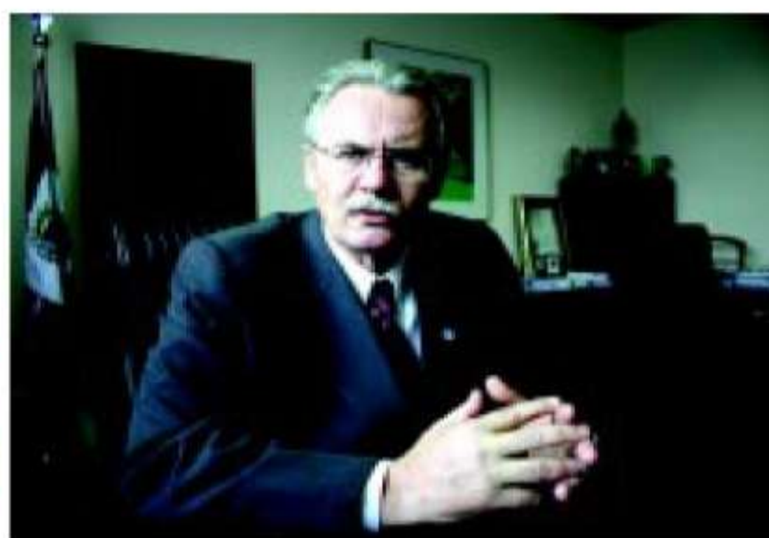
Entrevista: vice-governador e secretário da Agricultura, Orlando Pessuti