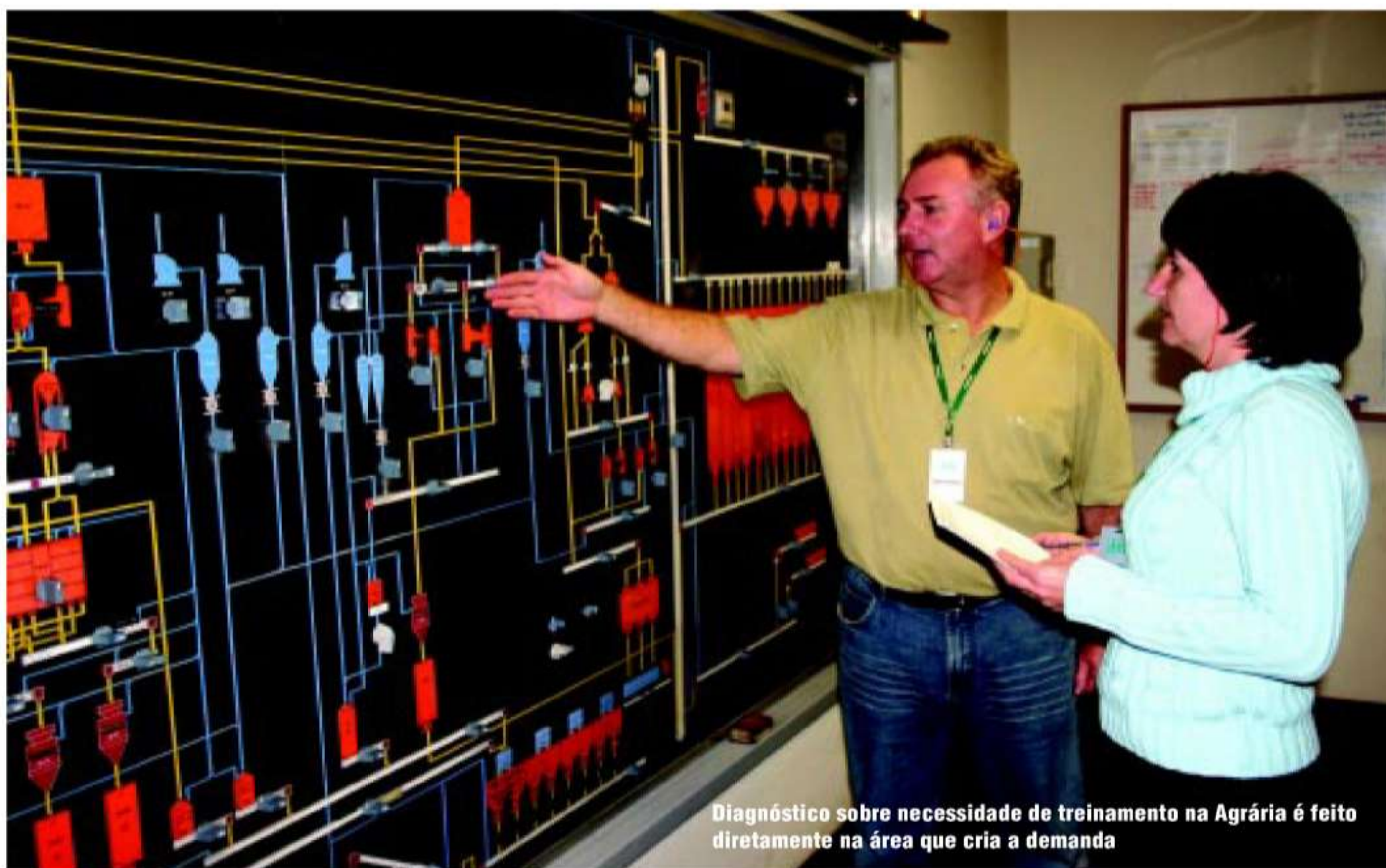
Diagnóstico sobre necessidade de treinamento na Agrária é feito diretamente na área que cria a demanda

Ferramentas do Sescop-PR utilizadas como instrumento facilitador ao trabalho dos agentes