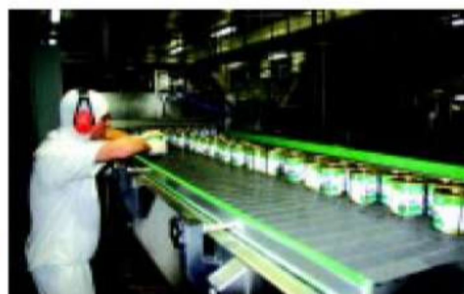
Cooperativa Lar: diversificação da atividade agroindustrial e do produtor cooperado

20 18º Encontro de Comitês Educativos e 13º Simpósio das Unimed's do Paraná