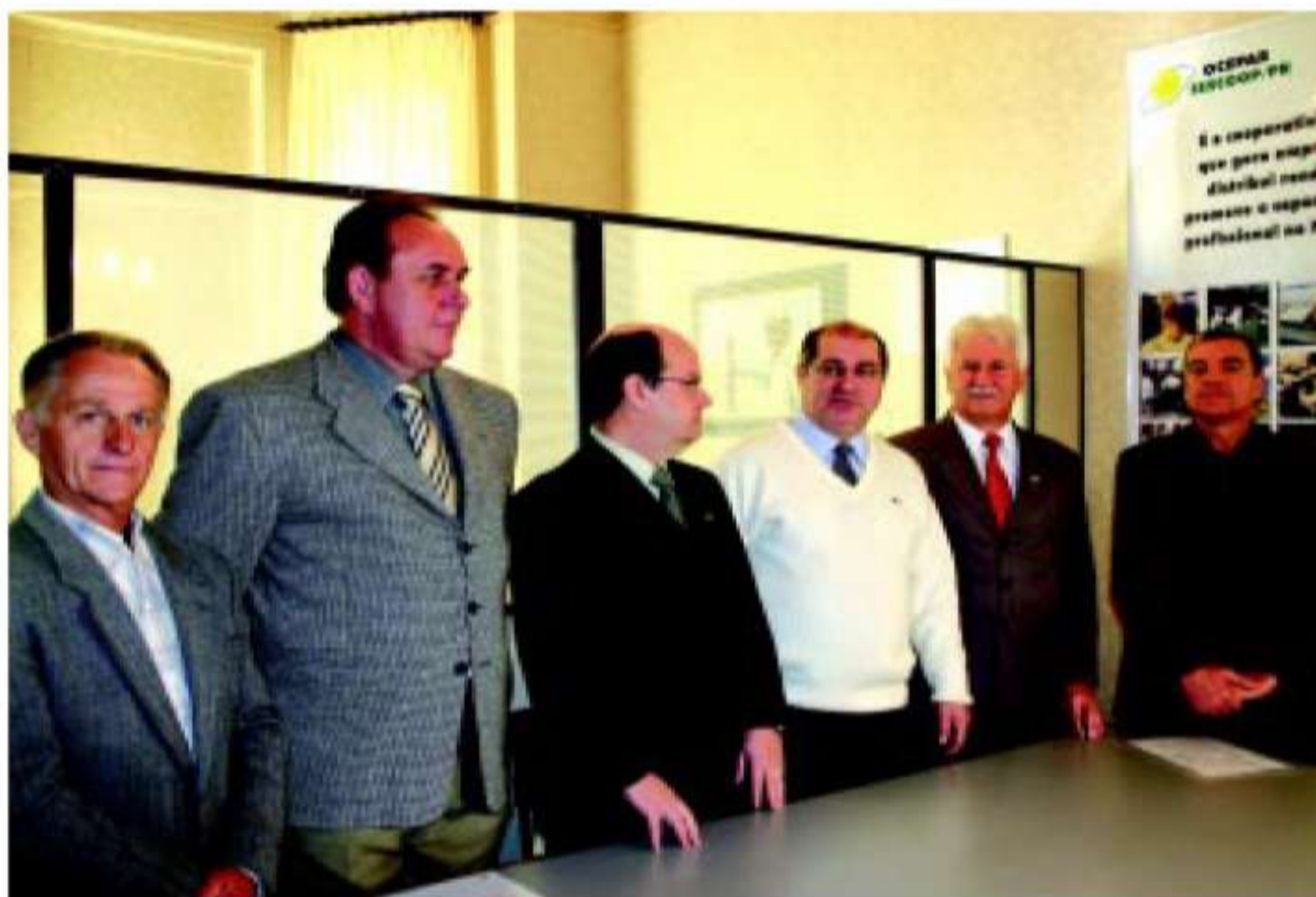
Ministro entregou pessoalmente, na Ocepar, as portarias que regularizam a situação aos dirigentes das cooperativas beneficiadas

Na avaliação do ministro, trata-se de um estímulo a um importante setor da economia paranaense. "As cooperativas são responsáveis por organizar a produção do Estado, dentro de um segmento fundamental para o Brasil." De acordo com Paulo Bernardo, essa oficialização ainda se configura num fato muito positivo, pois os imóveis passam a ser cuida-