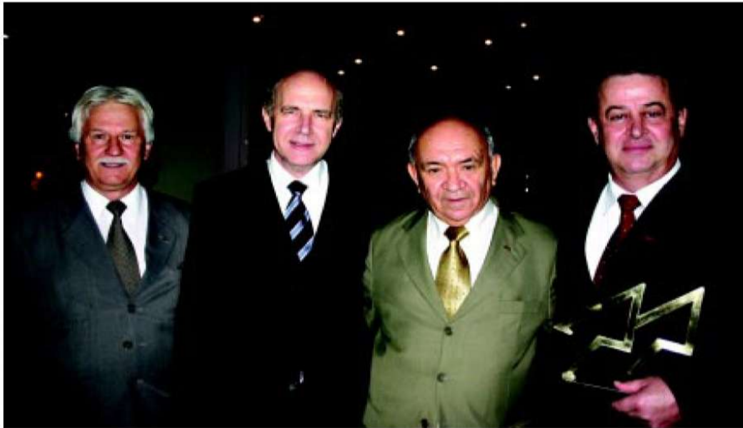
Dirigentes do Paraná com o presidente da Câmara dos Deputados Severino Cavalcanti