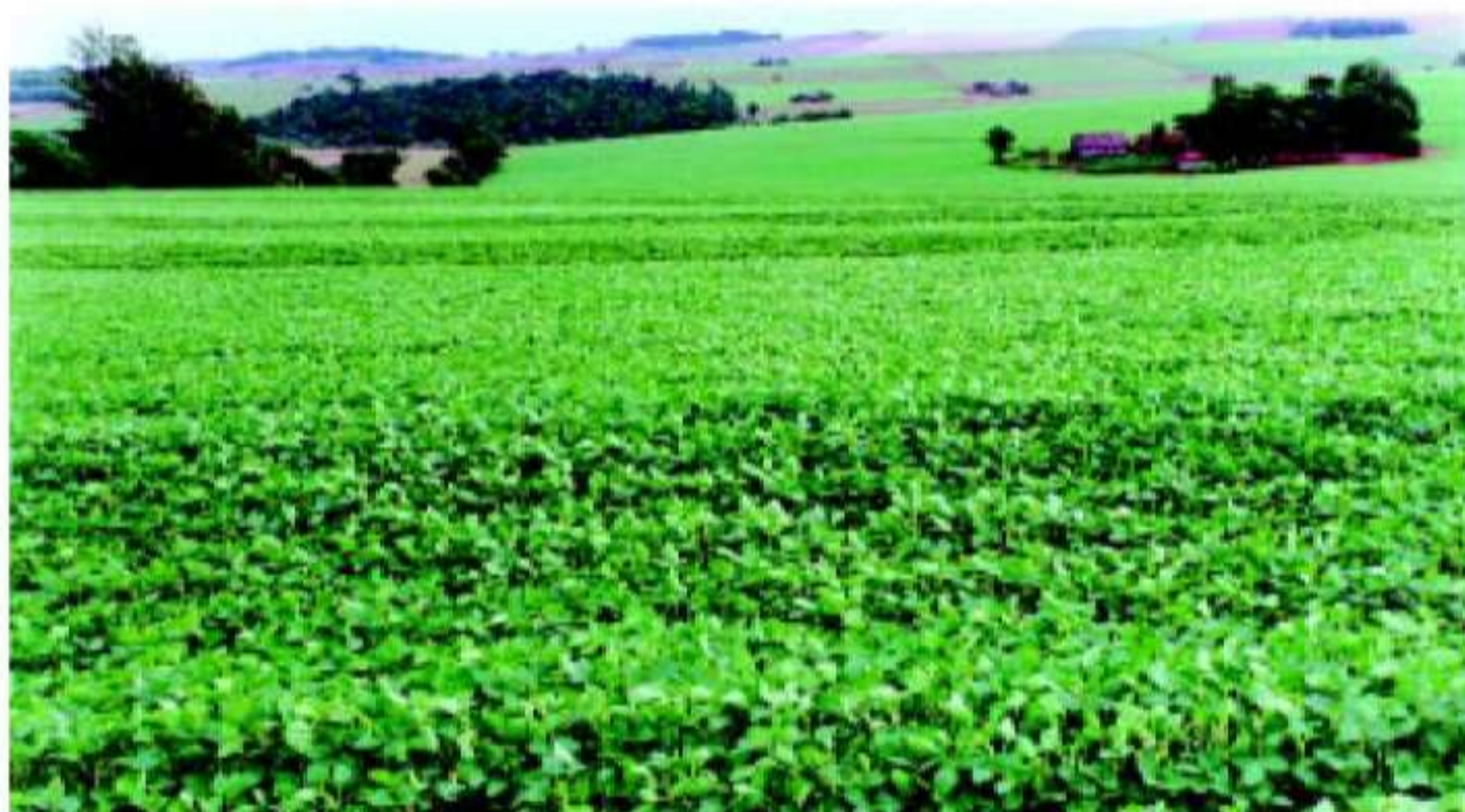
Adequação ambiental vem exigindo tempo e estudos de viabilidade econômica