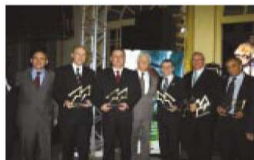
Cooperativas premiadas em 2005