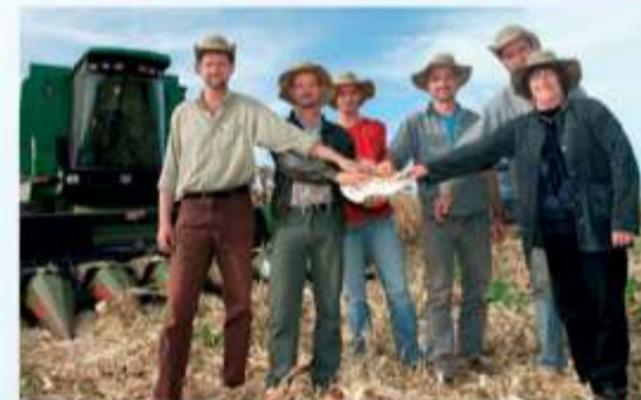
Cooperados - Sucesso em família