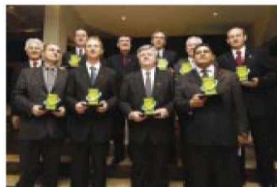
Cooperativas premiadas em 2004

O Paraná, estado modelo em cooperativismo, mostrou através do concurso porque é referência. Nossos projetos enfrentaram o processo de seleção rigoroso e lideraram as premiações das três edições do Prêmio. A expectativa dos organizadores agora é integrar, divulgar e premiar os casos de sucesso dos outros ramos do cooperativismo brasileiro. ■