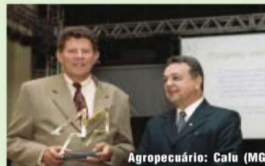
Agropecuário: Calu (MG)

O Prêmio Cooperativa do Ano foi julgado por uma comissão formada por 18 pessoas de diversas instituições: Ministério do Meio Ambiente, Instituto Interamericano de Cooperação para a Agricultura, Ministério da Agricultura, Pecuária e Abastecimento, Fundo Nacional de Desenvolvimento da Educação, Universidade do Vale do Rio dos Sinos, Associação Brasileira de Marketing Rural & Agronegócio, Banco Central, Ministério de Minas e Energia, Ministério da Saúde, Agência Nacional de Transportes Terrestres, Ministério dos Transportes, Instituto de Defesa do Consumidor, Banco do Brasil, Financiadora de Estudos e Projetos, Rede Brasil Sul de Comunicação e Companhia Nacional de Abastecimento.