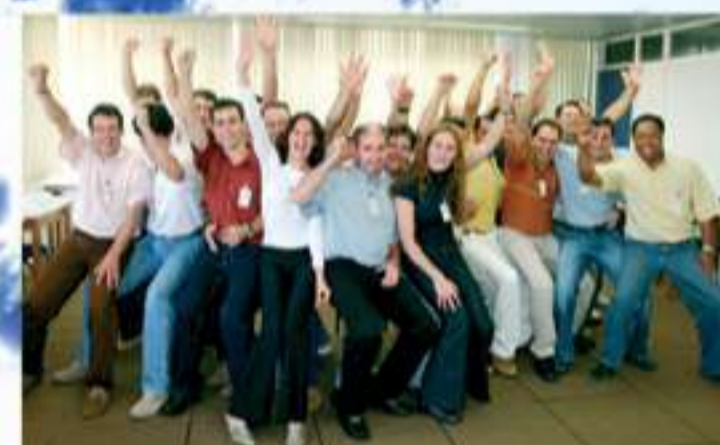
Treinamento de Funcionários

O constante desenvolvimento técnico, educacional e social dos cooperados e funcionários é uma das iniciativas da Coamo para gerar crescimento e riqueza.