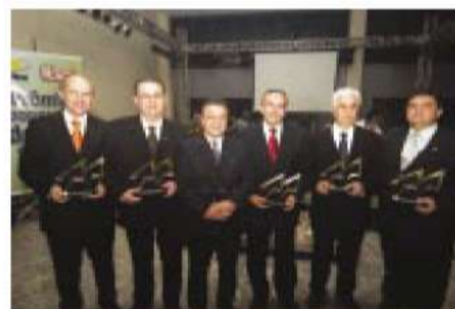
Cooperativas premiadas em 2006