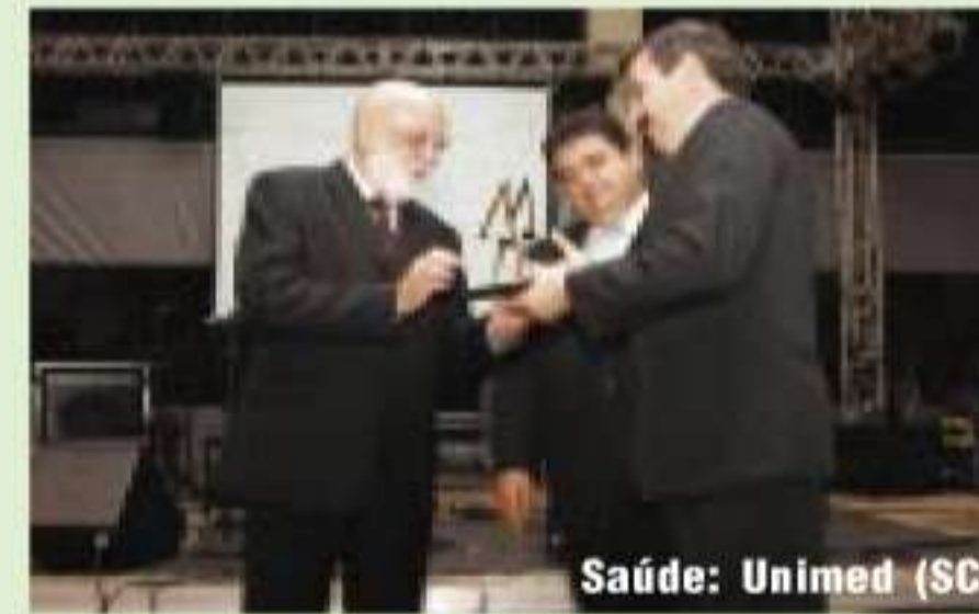
Saúde: Unimed (SC)