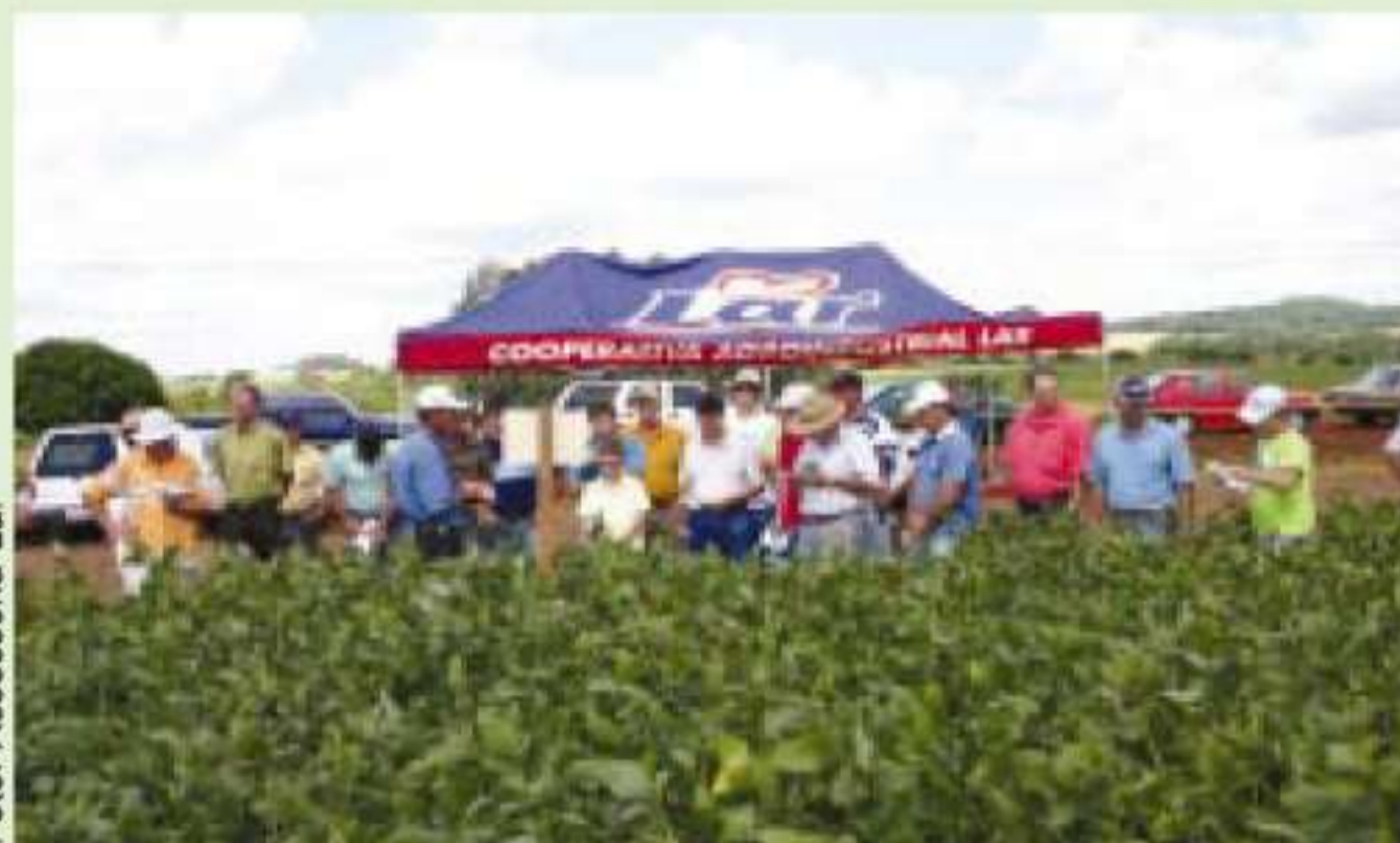
Programas de qualidade e maior participação dos cooperados elevaram a eficácia e a rentabilidade da cooperativa