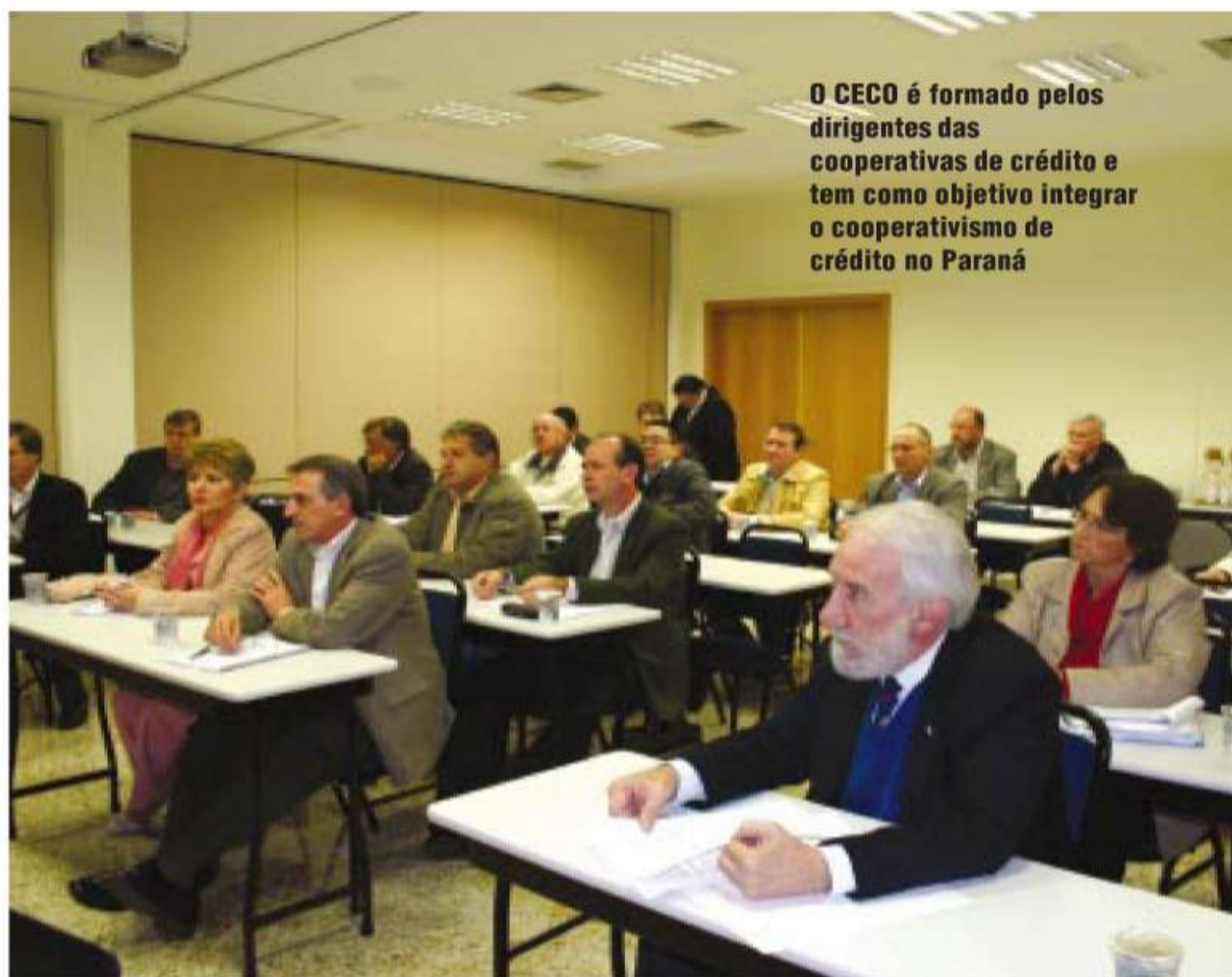
O CECO é formado pelos dirigentes das cooperativas de crédito e tem como objetivo integrar o cooperativismo de crédito no Paraná