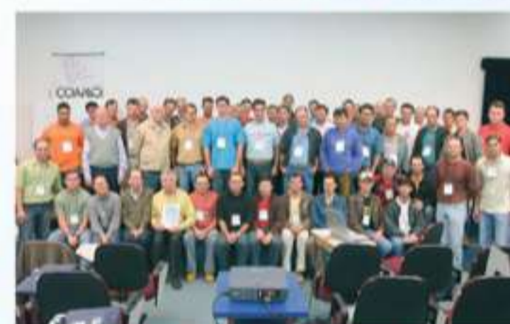
Jovens Líderes Cooperativistas

Assim, mais de 100.000 pessoas entre cooperados, funcionários e familiares multiplicam resultados, com união, trabalho e a confiança em um futuro melhor.