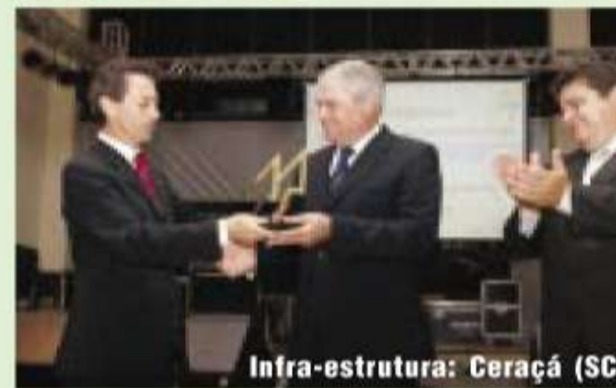
Infra-estrutura: Ceraçá (SC)