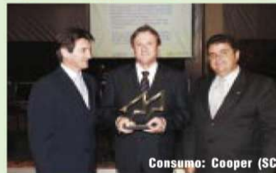
Consumo: Cooper (SC)