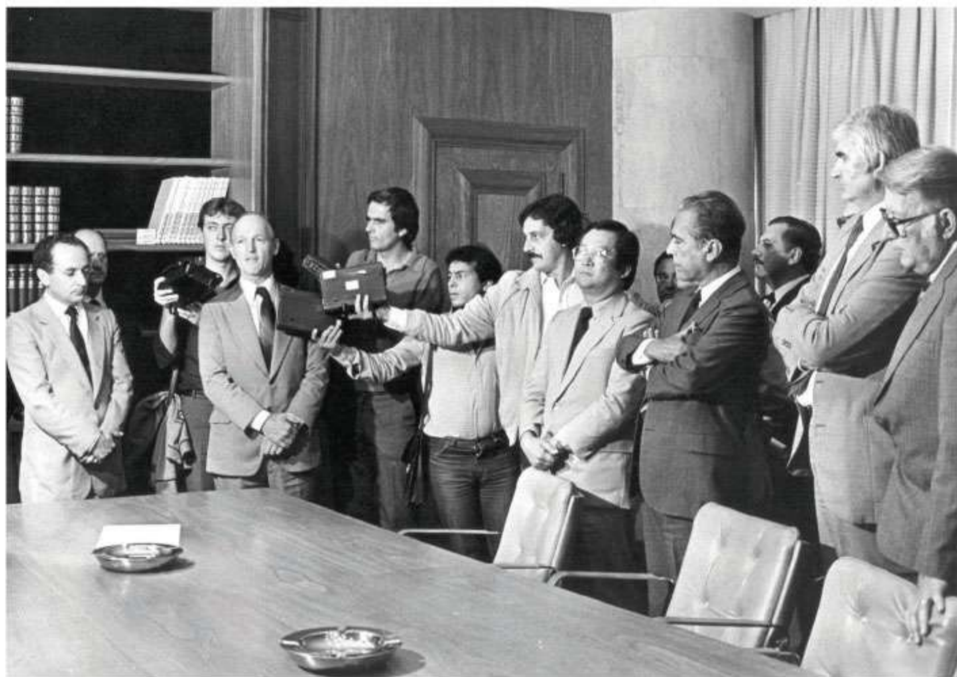
Solenidade de assinatura da aquisição da Kamby, no Palácio Iguazu

A compra da indústria privada Kamby por um consórcio de cooperativas, ao valor de Cr$ 1,43 bilhão (R$ 38 milhões em valores atuais) marcou o ano de 1982 com a participação do cooperativismo paranaense na produção de leite em pó. O negócio foi uma opção mais racional de solução ao grave problema que ocorria no setor de lácteos, onde milhares de produtores ficaram meses sem receber pela produção entregue à indústria.