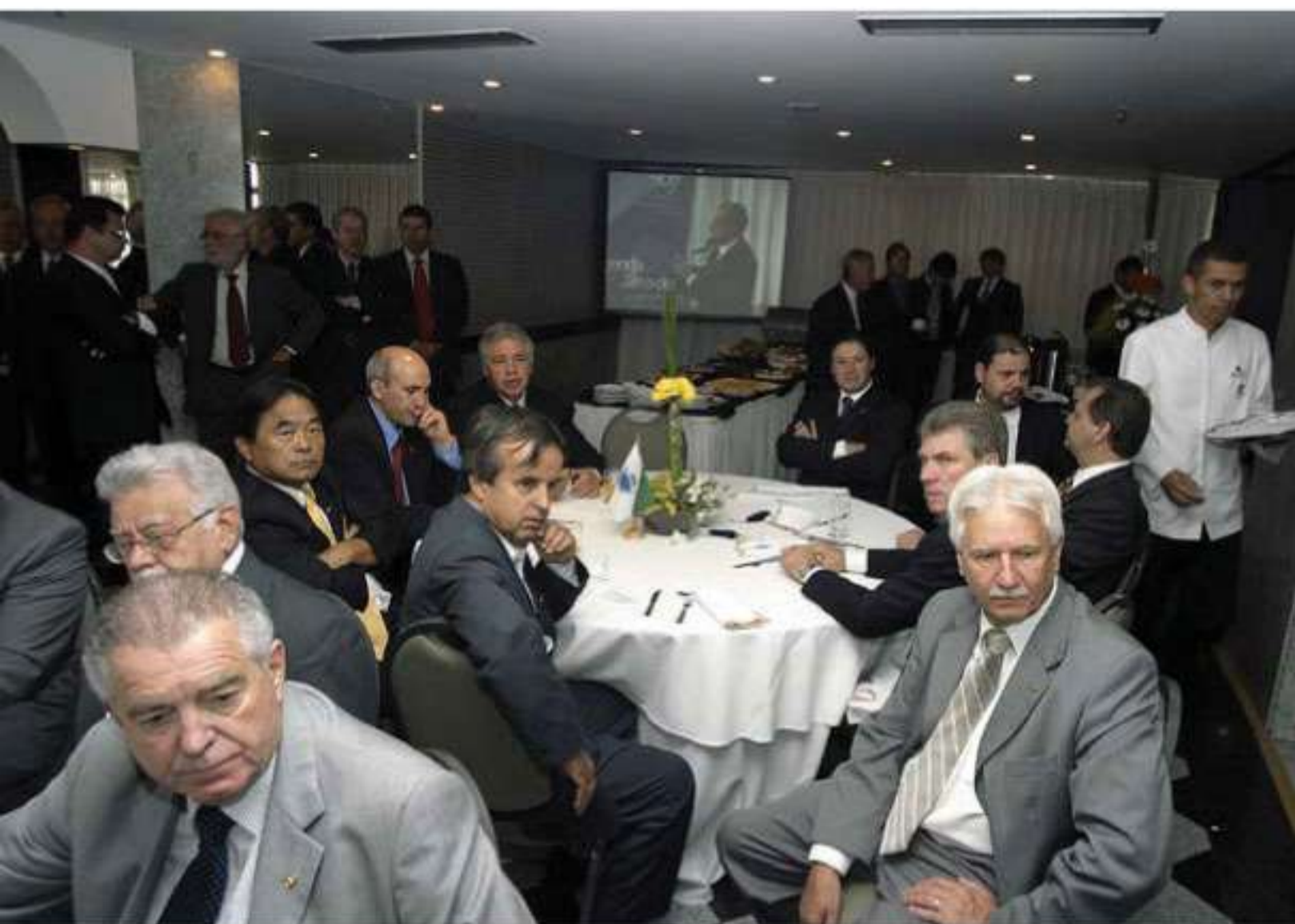
Lideranças cooperativistas e parlamentares prestigiaram o evento