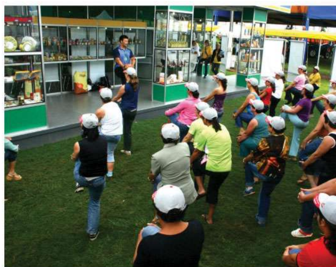
Ginástica laboral para “despertar” o corpo