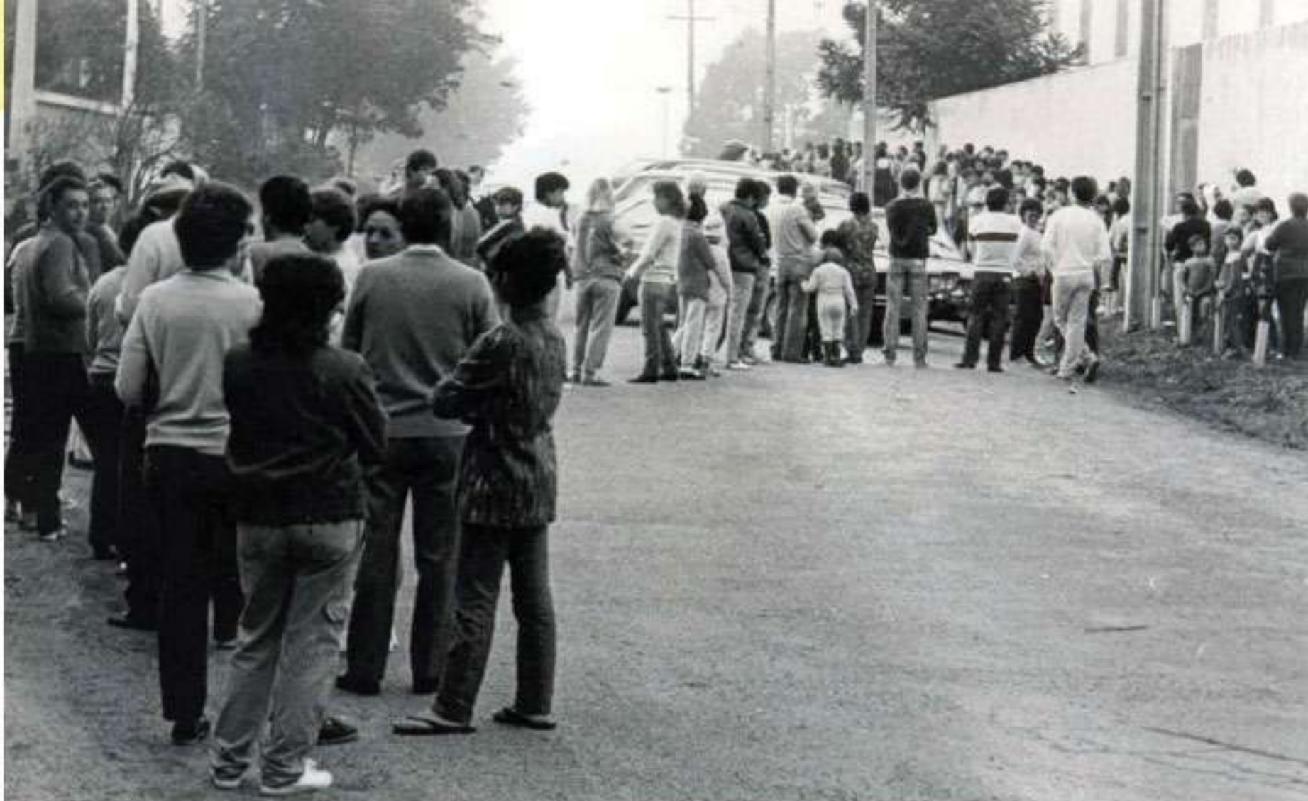
De madrugada, imensas filas para comprar leite

Durante a Semana do Cooperativismo veiculou na televisão e nos jornais peça de propaganda institucional sob o título “Justiça Social”. E aproveitando a oferta da Emater, montou um estande com 350 m 2 na Expotiba, realizada no Parque Castelo Branco, onde foram mostrados produtos e serviços das cooperativas paranaenses.