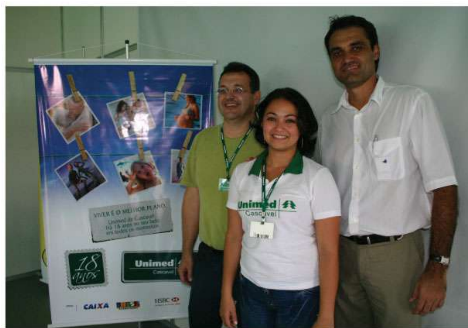
Parceria com a Unimed Cascavel foi um sucesso