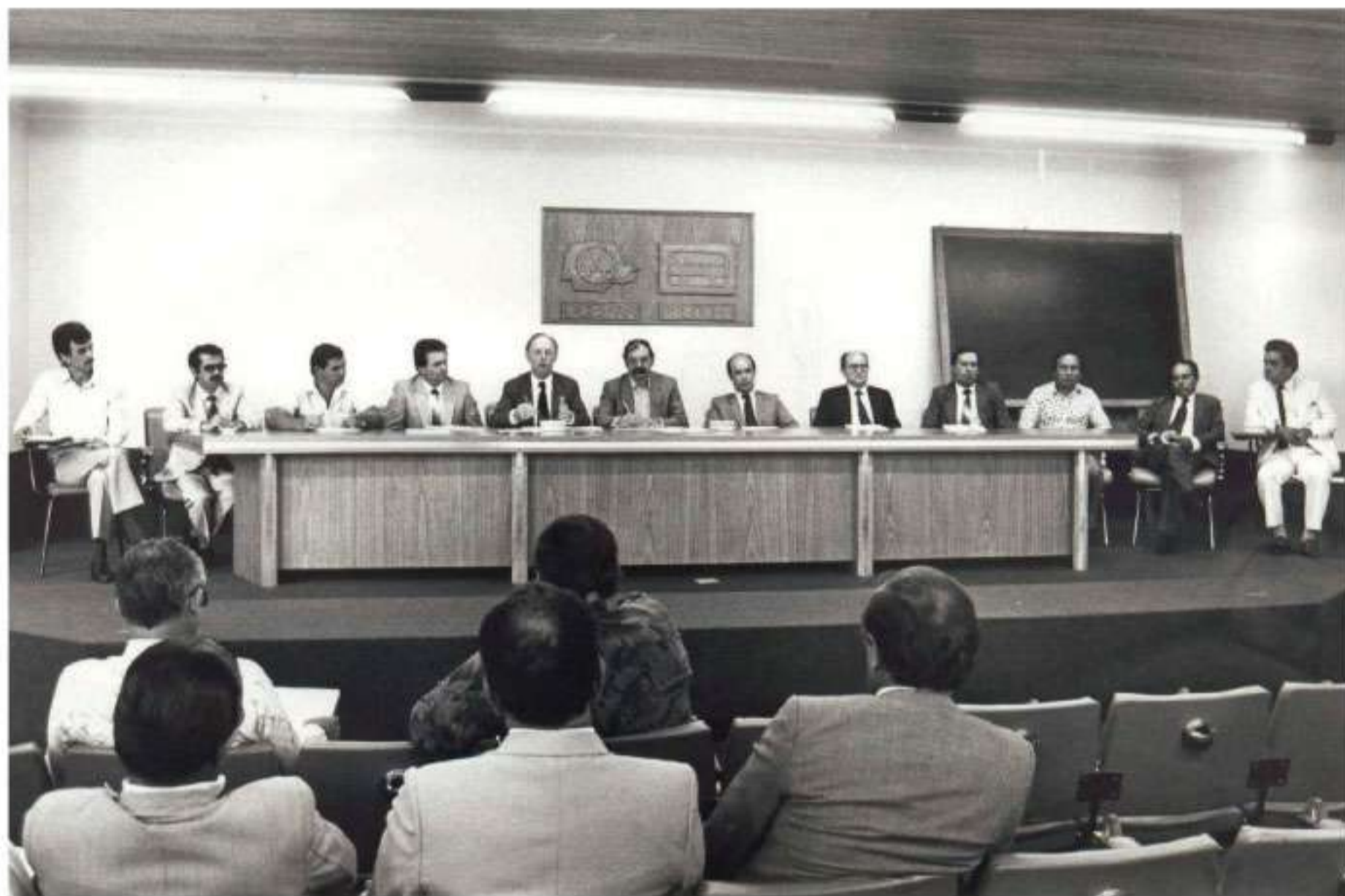
Reunião de constituição da Cocecrer PR

O Comitê Pró-constituição das Cooperativas de Crédito Rural, composto pela Ocepar, Emater, BNCC e pelas cooperativas centrais (Cocap, Coeprsul, CCLPL, Cotriguaçu e Sudcoop) realizou intensos trabalhos, culminando com a constituição da Cooperativa Central de Crédito Rural – Cocecrer-PR. Depois de atuar fortemente na constituição e fortalecimento das cooperativas de crédito, o comitê deu mais um passo na organização das cooperativas de crédito.