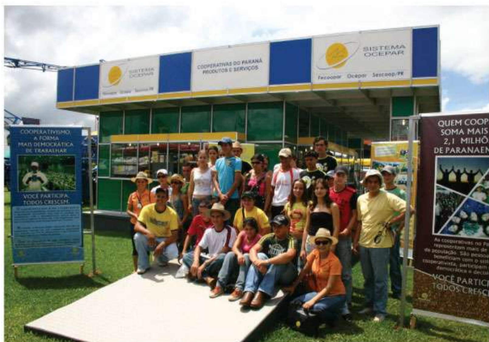
Estande atraiu a atenção de dezenas de grupos de produtores

nistro da Agricultura, Luiz Carlos Guedes Pinto, que manifestou-se impressionado com o tamanho do evento, que visitava pela primeira vez. “Me arrependeria imensamente se não pudesse ter vindo aqui para ver tudo isso”, confidenciou Guedes. Durante entrevista coletiva à imprensa o ministro falou sobre o PAC (Plano de Aceleração do Crescimento), afirmando que as medidas anunciadas irão atender as demandas da agropecuária nacional. Ele também abordou a questão do foco de Febre Aftosa na Bolívia, revisão dos índices de produtividade para amparar políticas de reforma agrária, questão do plantio de organismos geneticamente modificados e os caminhos para o crescimento do setor privado.