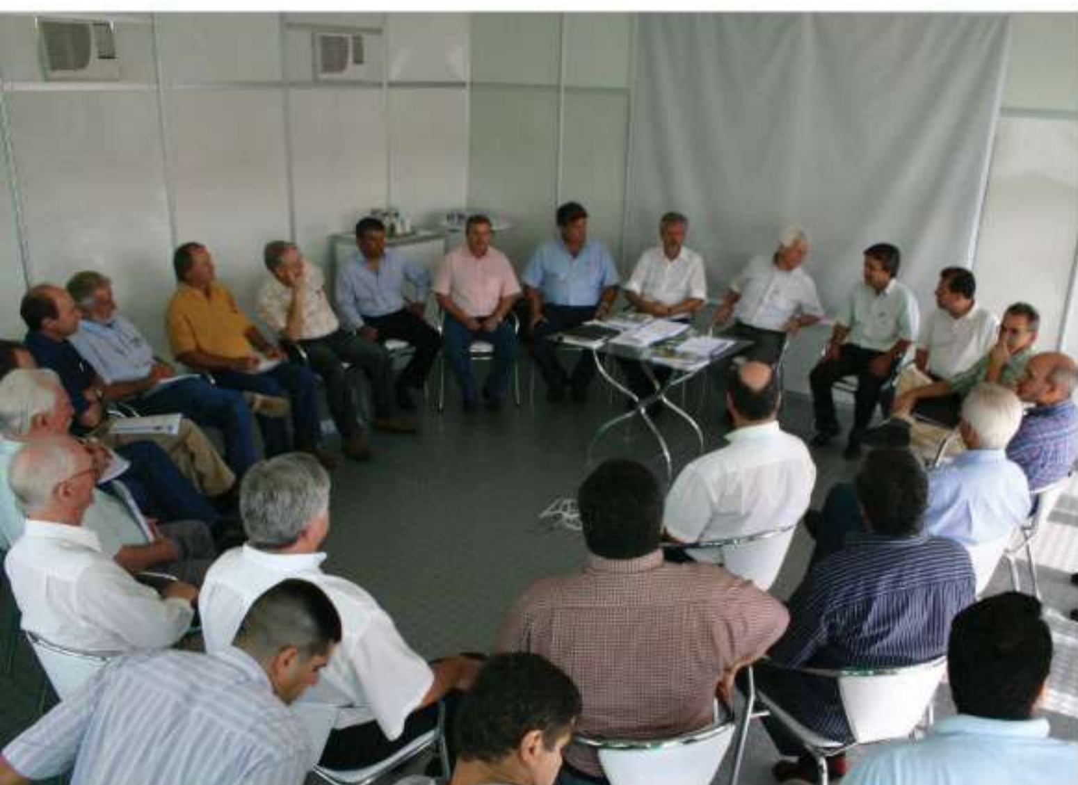
Reunião da diretoria do Sistema Ocepar e autoridades