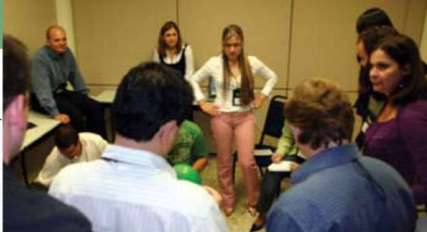
Assessores de Comunicação do Sicredi durante dinâmica de grupo