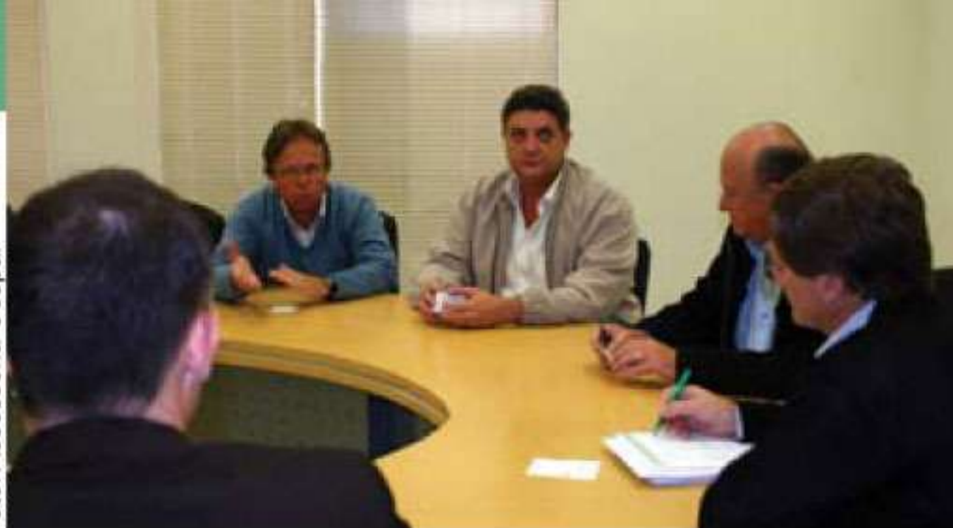
Alemães interessados em combustível alternativo