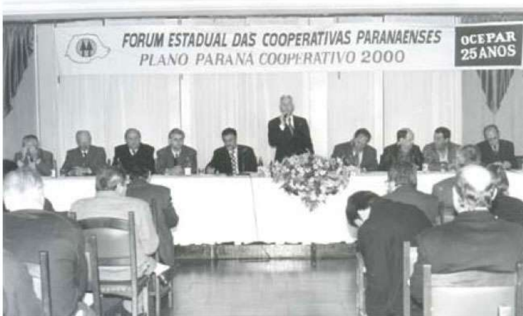
Lançamento do Plano Paraná Cooperativo

No tópico Mercado, buscou-se olhar os desafios que as Cooperativas irão enfrentar nos próximos anos, em relação