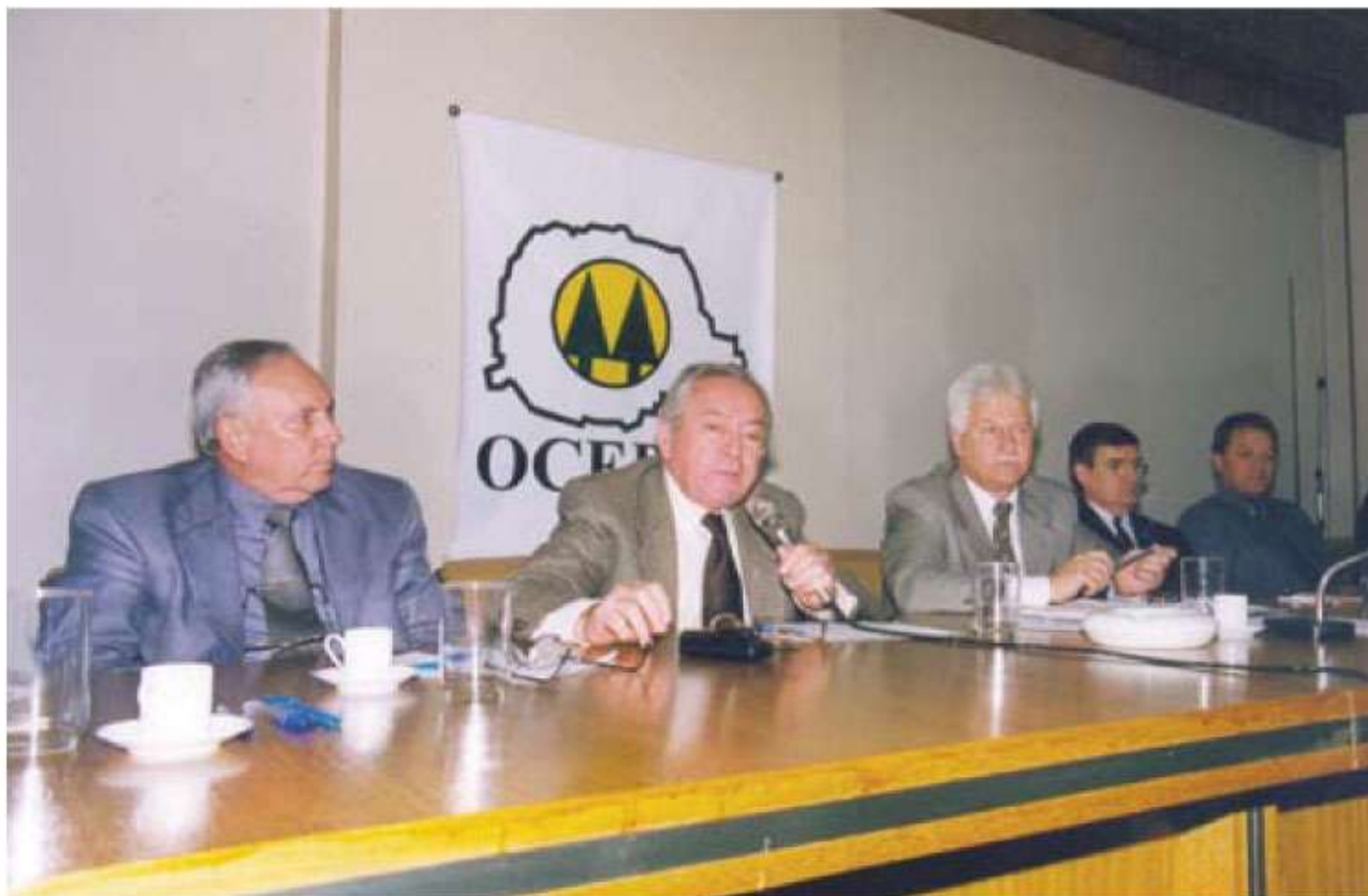
Reunião na Ocepar para discussão do Recoop

Quem acompanhou a vida econômica das empresas do agronegócio após a implantação do Plano Real compreende melhor a dimensão dos prejuízos e da descapitalização do setor. É comum o reconhecimento de que a agricultura foi a âncora verde do plano. O quadro pós-plano incluía inflação baixa, preços dos produtos agrícolas e dos insumos em queda e juros elevados. Havia menor renda no campo, mas dívidas maiores para pagar. Uma conta que não fechava. As autoridades foram per-