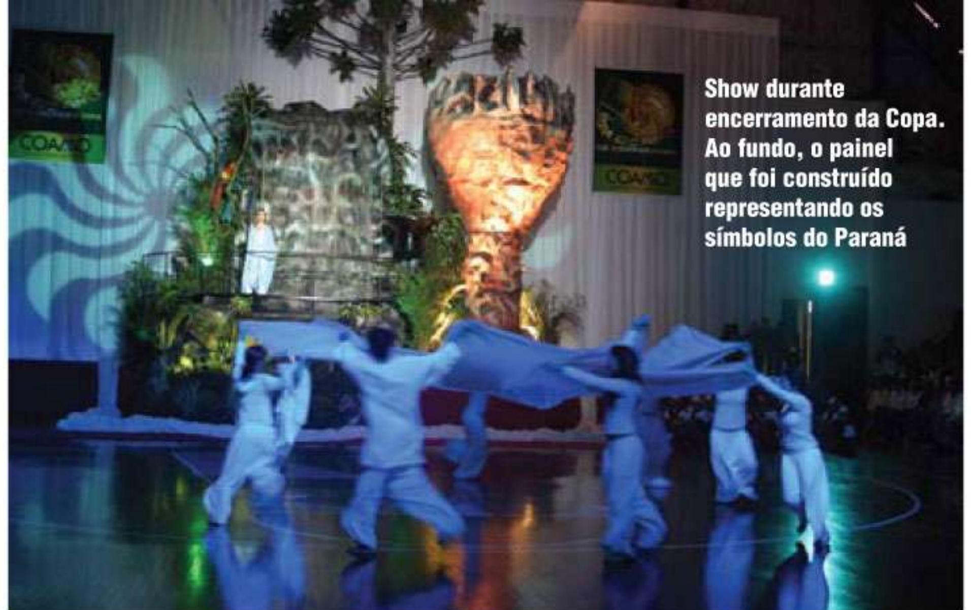
Show durante encerramento da Copa. Ao fundo, o painel que foi construído representando os símbolos do Paraná