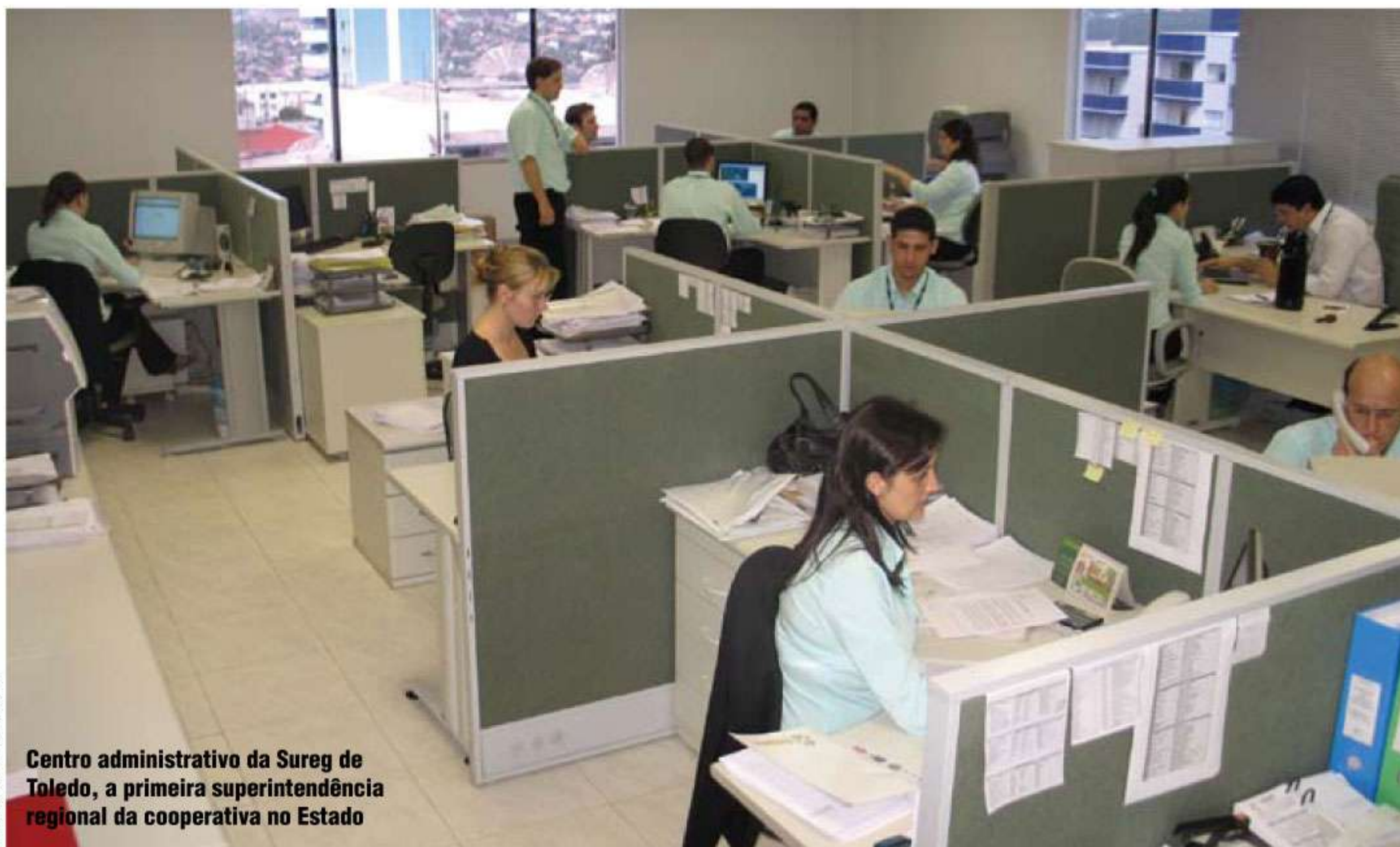
Centro administrativo da Sureg de Toledo, a primeira superintendência regional da cooperativa no Estado

Projeto da cooperativa prevê a inauguração de 12 Superintendências Regionais (Suregs) até 2009