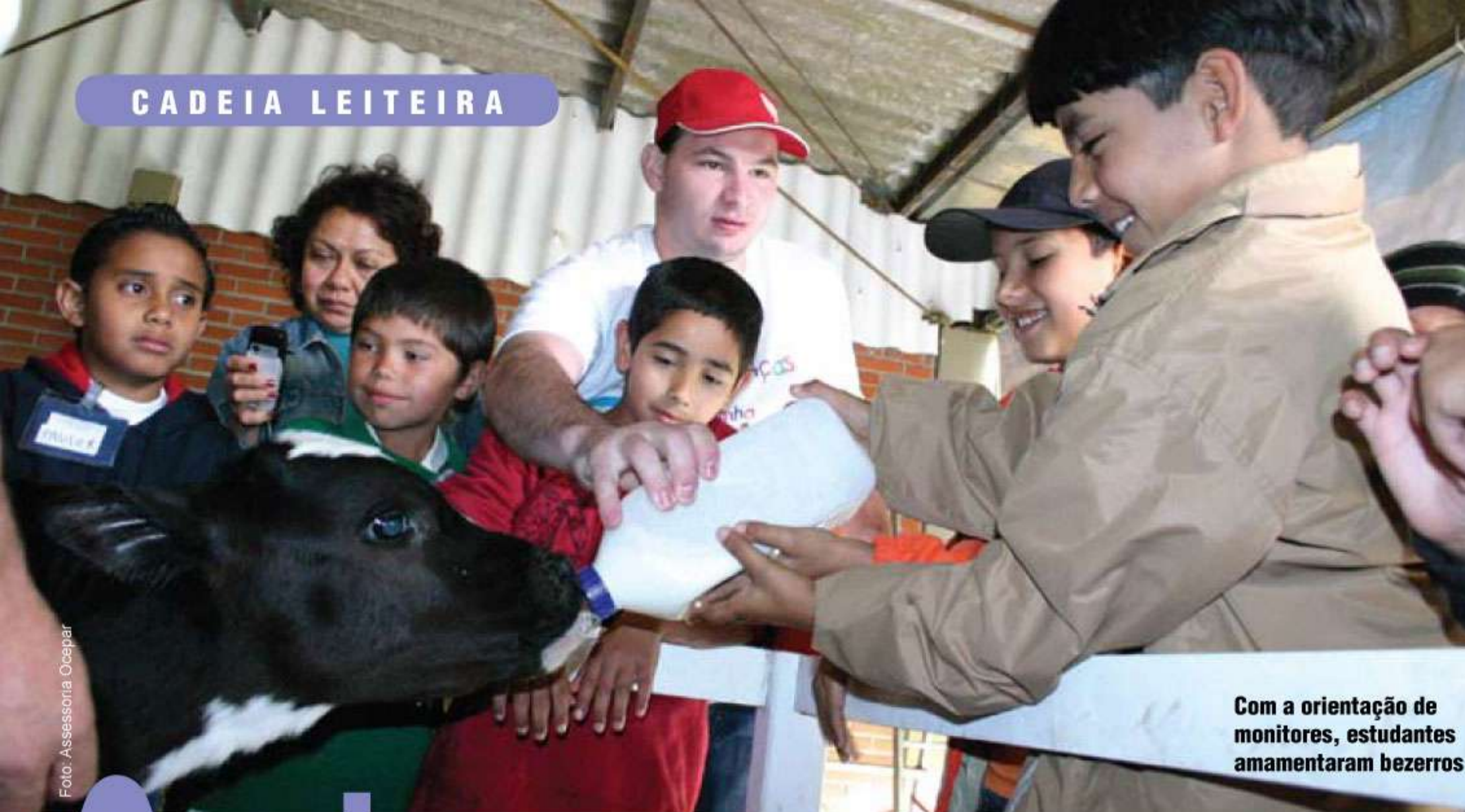
Com a orientação de monitores, estudantes amamentaram bezerros