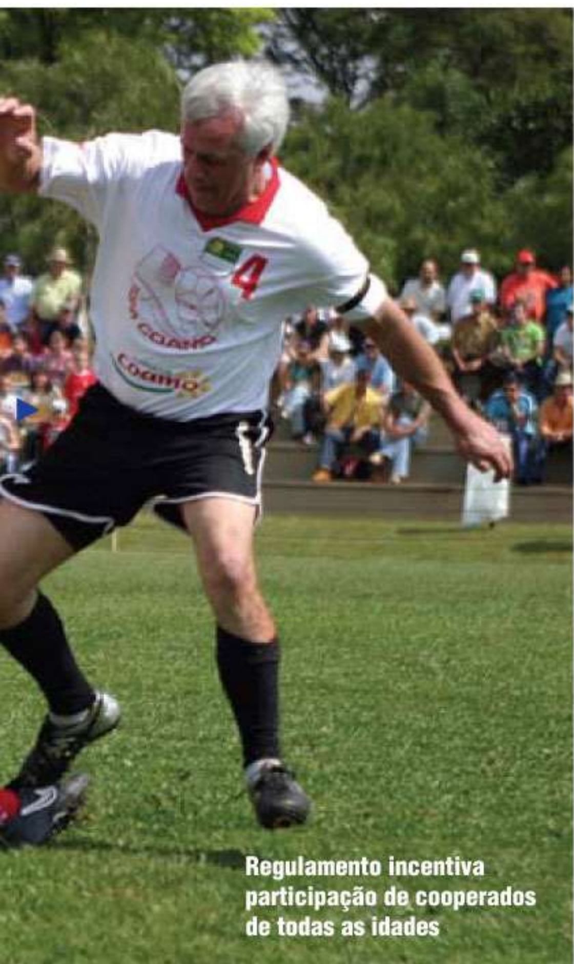
Regulamento incentiva participação de cooperados de todas as idades