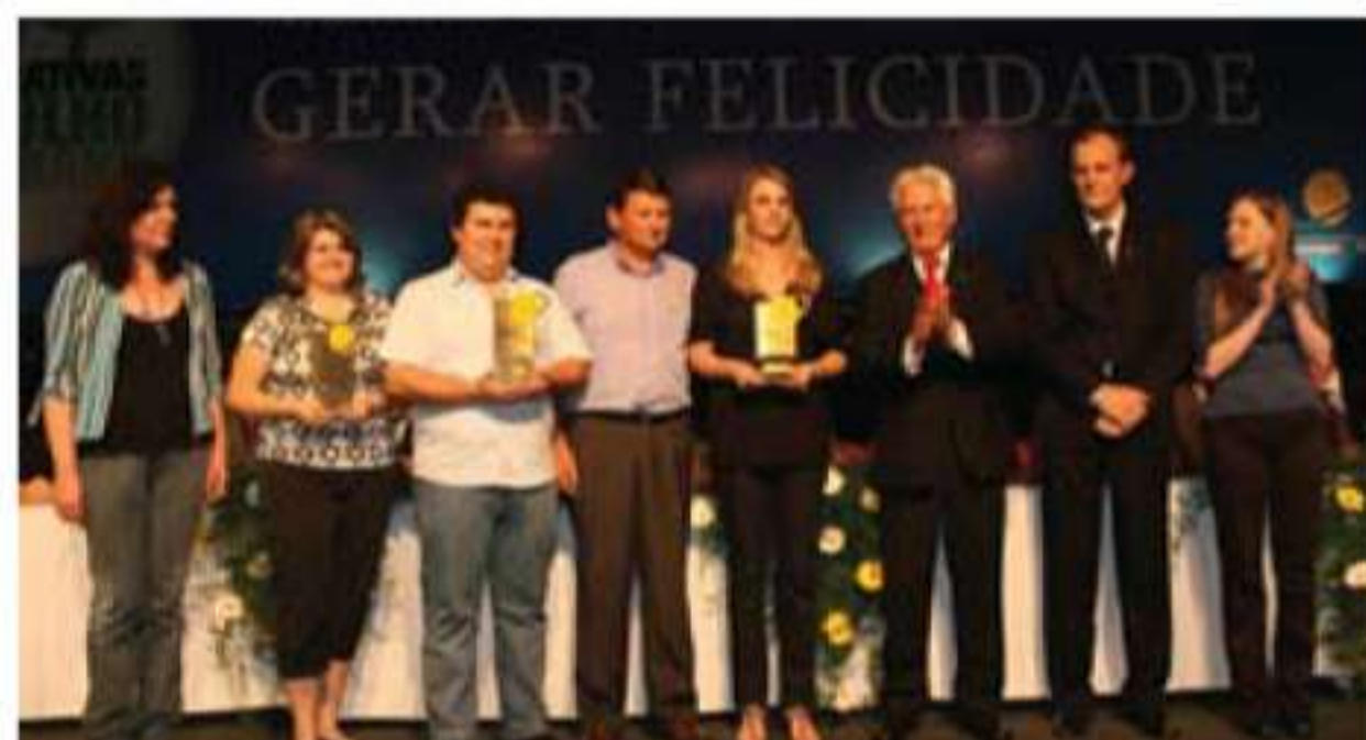
Categoria Mídia Cooperativa