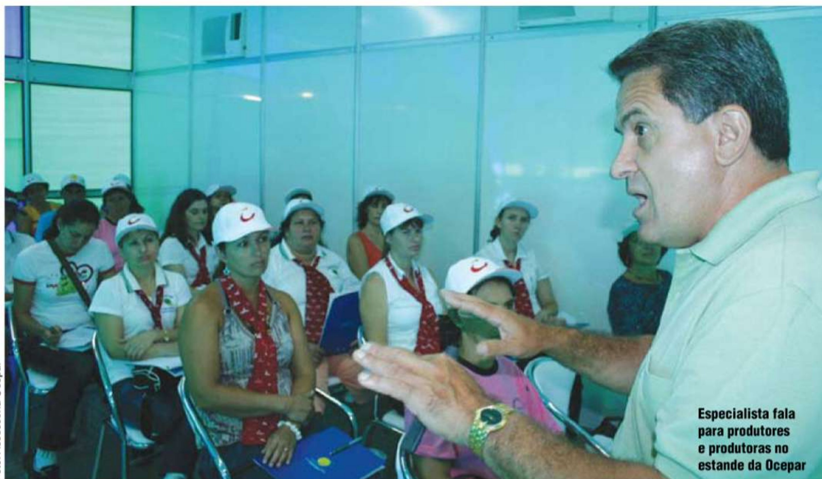
Especialista fala para produtores e produtoras no estande da Ocepar