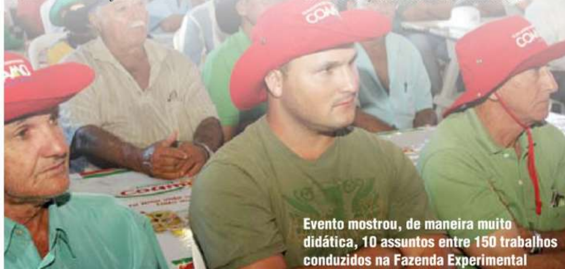
Evento mostrou, de maneira muito didática, 10 assuntos entre 150 trabalhos conduzidos na Fazenda Experimental

Este ano os temas abordados nas estações foram: variedades de soja RR e convencional; efeitos fisiológicos de produtos: inseticidas, fungicidas e fitonínicos; manejos de doenças em soja (ferrugem); manejos de doenças em milho; tecnologia de aplicação e adjuvantes; MIP - Manejo Integrado de Pragas em Soja e Milho; plantas daninhas resistentes e tolerantes aos herbicidas; híbridos de milho e tecnologia de produção; agricultura de precisão e integração lavoura e pecuária: resultados em soja e milho.