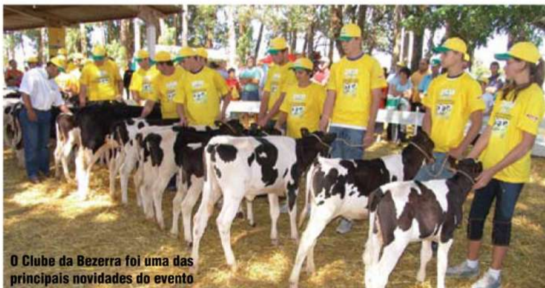
O Clube da Bezerra foi uma das principais novidades do evento

Neste ano, os Dias de Campo Copagril também tiveram uma participação mais efetiva das senhoras que integram os Comitês Femininos da Copagril. No seu stand, elas colocaram artesanato e produtos culinários em degustação e para comercialização.