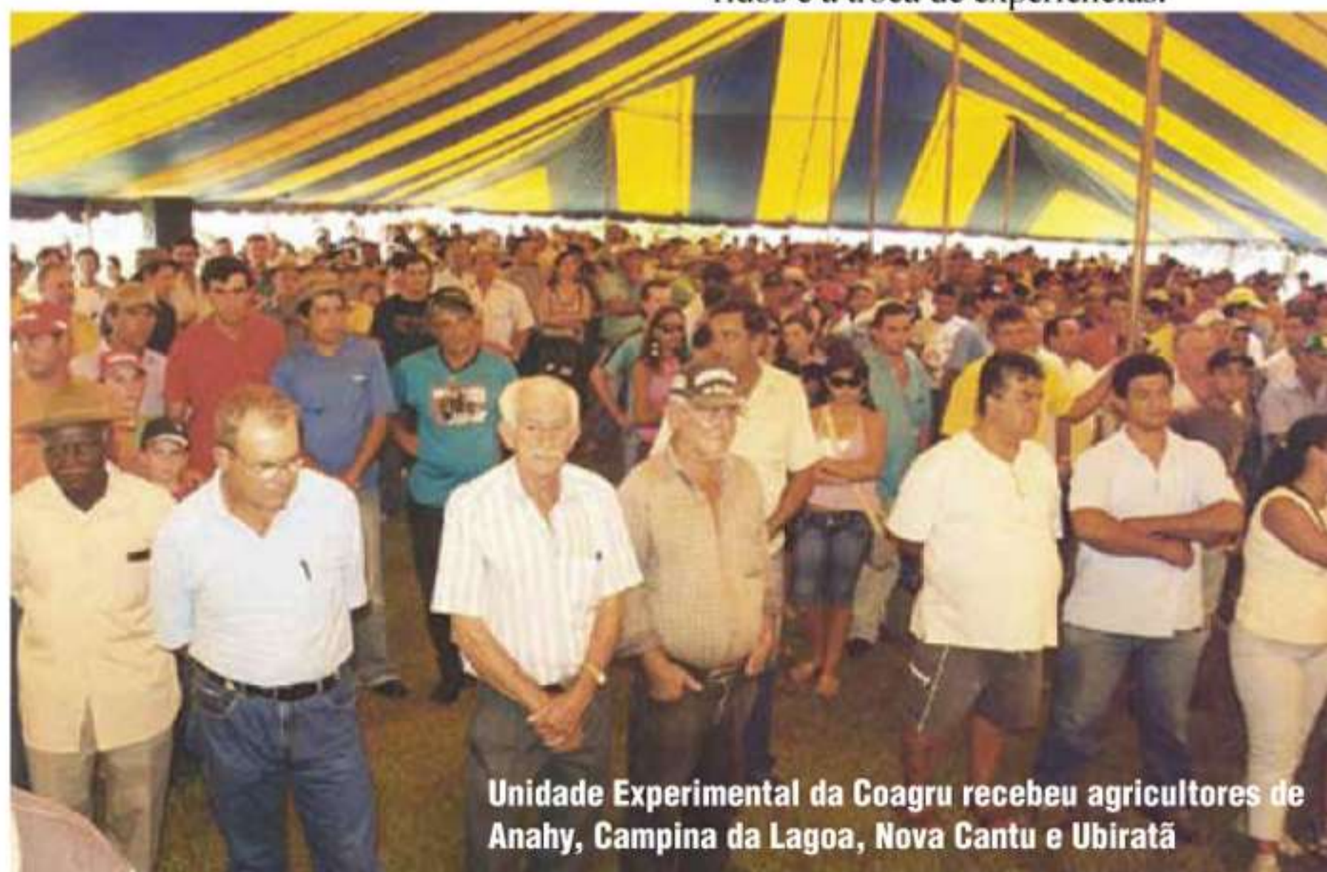
Unidade Experimental da Coagru recebeu agricultores de Anahy, Campina da Lagoa, Nova Cantu e Ubitatã

de Anahy, Campina da Lagoa, Nova Cantu e Ubitatã, é um momento de confraternização. Ao final do encontro, a cooperativa realiza um grande jantar de encerramento com o objetivo de promover a interação entre os participantes, permitindo o compartilhamento dos conhecimentos adquiridos e a troca de experiências.