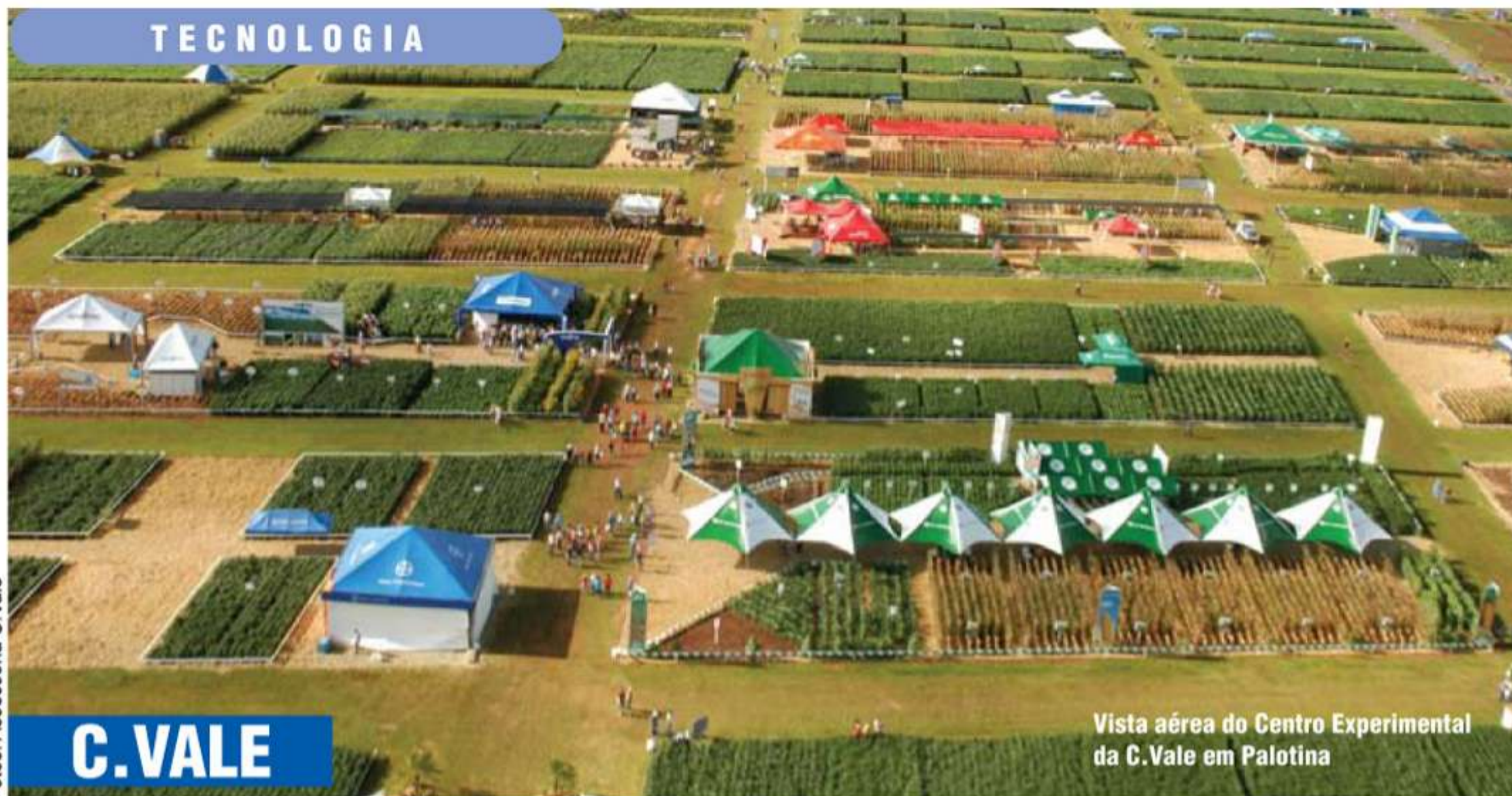
Vista aérea do Centro Experimental da C.Vale em Palotina