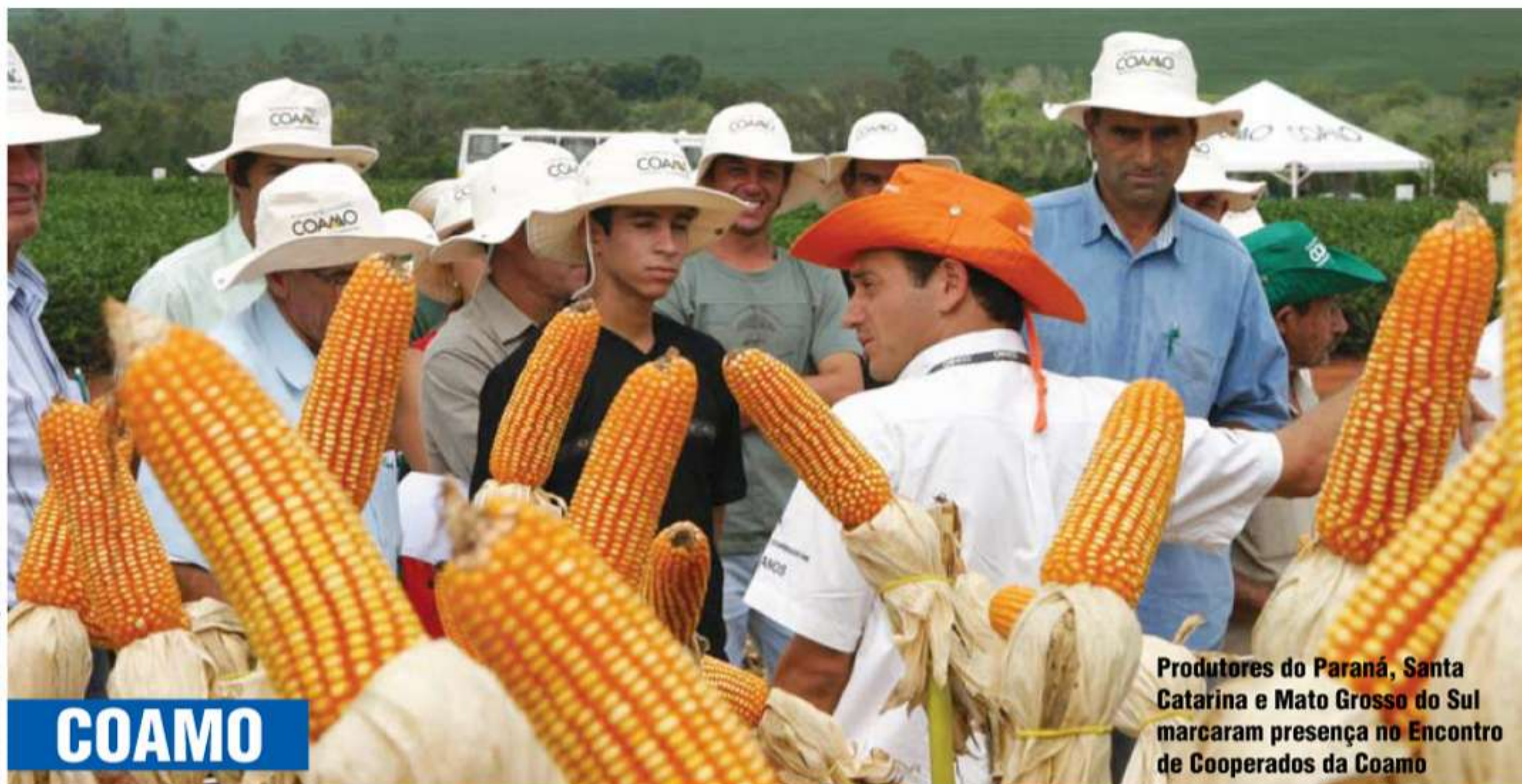
Produtores do Paraná, Santa Catarina e Mato Grosso do Sul marcaram presença no Encontro de Cooperados da Coamo