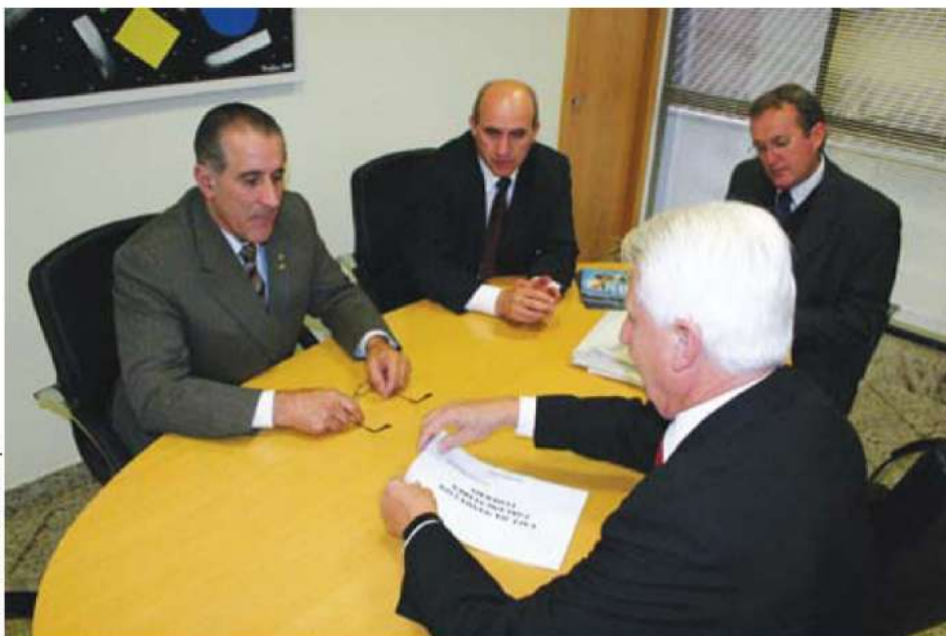
Diversas foram as reuniões com autoridades e políticos para discutir temas de interesse do setor cooperativista

medidas importantes foram o aumento de recursos e limites para financiamento nas linhas de custeio e investimento a juros controlados para médios produtores e a redução das exigências para enquadramento das cooperativas de leite como beneficiárias do Pronaf.