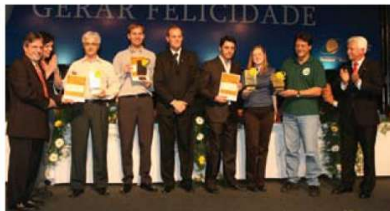
Categoria Mídia Impressa