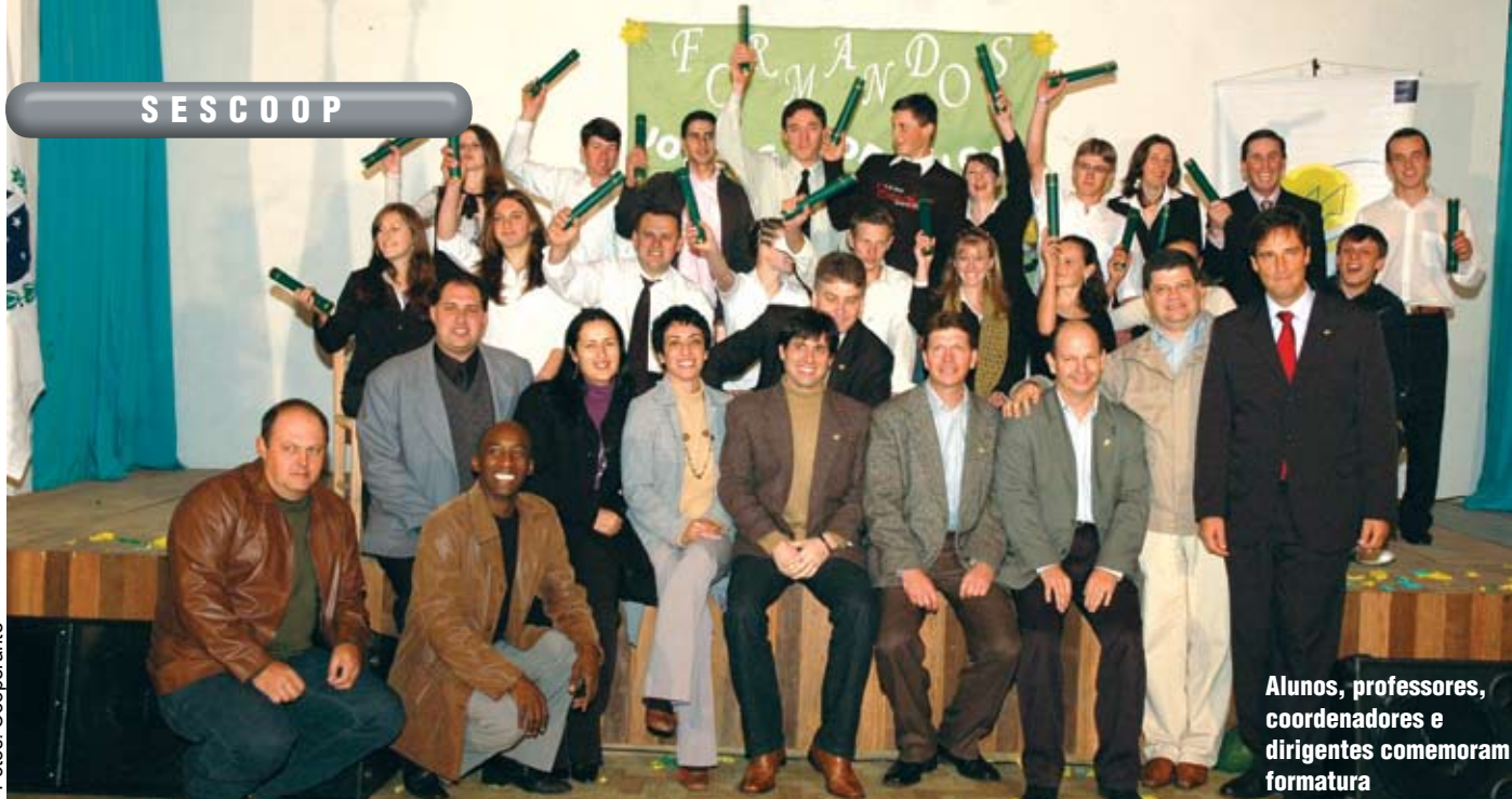
Alunos, professores, coordenadores e dirigentes comemoram formatura