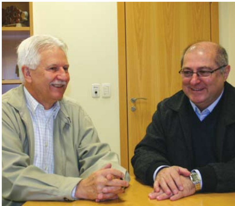
Ministro do Planejamento, Paulo Bernardo, em visita à Ocepar afirmou a Koslovski que o pleito das cooperativas seria atendido

ao funcionalismo público, do crédito consignado em folha de pagamento. Na ocasião, o ministro prometeu interceder junto ao governo para obter essa permissão, pois entendia que era um pedido justo e que contribuiria para a prática de taxas de juros menores no mercado. “E nós temos interesse que baixem os juros mesmo”, frisou Paulo Bernardo. Também lembrou do grande apoio do governo Lula ao crescimento do cooperativismo de crédito. ■