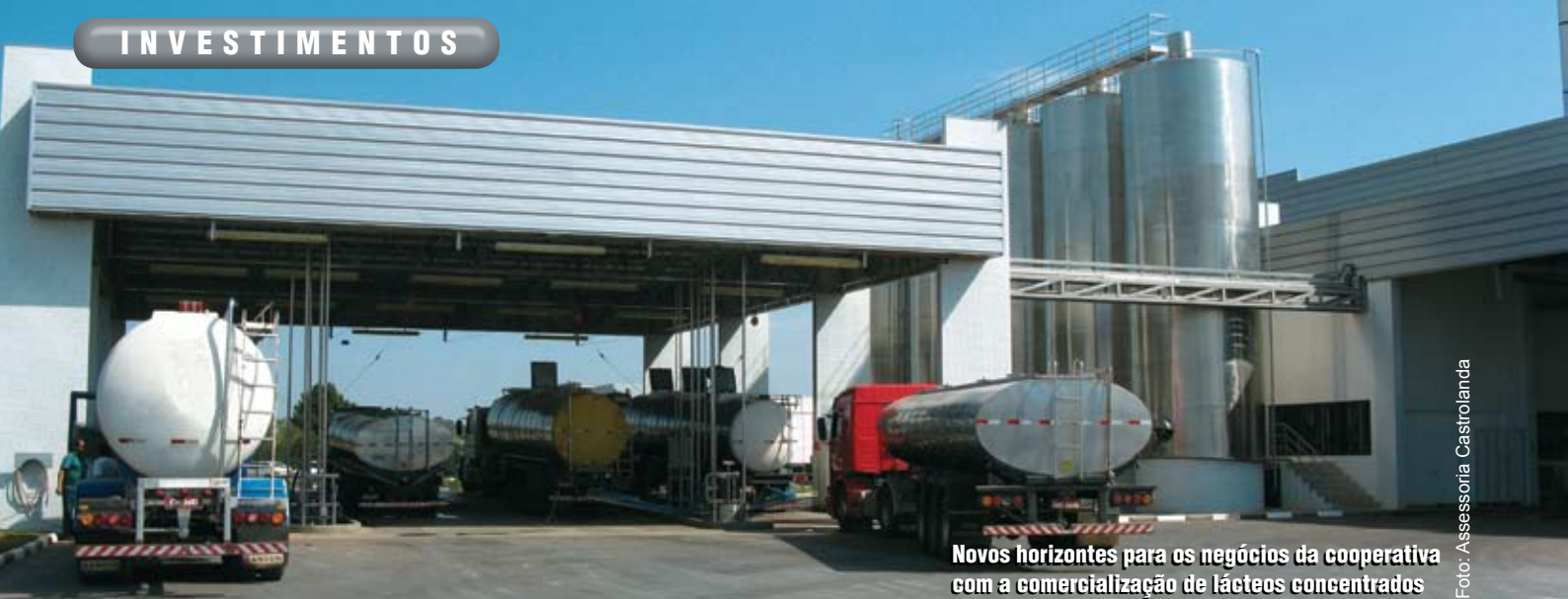
Novos horizontes para os negócios da cooperativa com a comercialização de lácteos concentrados