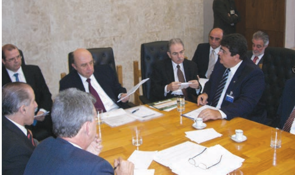
O presidente da OCB, Márcio Lopes, em reunião com o presidente do Bacen, Henrique Meirelles

Bancos cooperativos – Já os bancos cooperativos têm o objetivo de proporcionar acesso das cooperativas de crédito ao mercado financeiro. Os bancos do setor serão organizados em sociedades por ações, controladas pelas cooperativas singulares de crédito, pelas cooperativas centrais de crédito e confederações de cooperativas de crédito constituídas no país. Há, atualmente, dois bancos cooperativos no Brasil: Bansicredi e Bancoob, constituídos na metade dos anos 90, quando foi iniciada a flexibilização na legislação do cooperativismo de crédito. O Bansicredi,