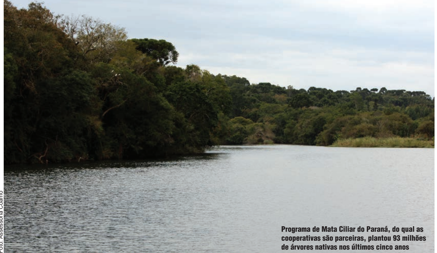
Programa de Mata Ciliar do Paraná, do qual as cooperativas são parceiras, plantou 93 milhões de árvores nativas nos últimos cinco anos