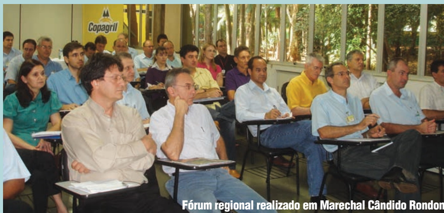
Fórum regional realizado em Marechal Cândido Rondon