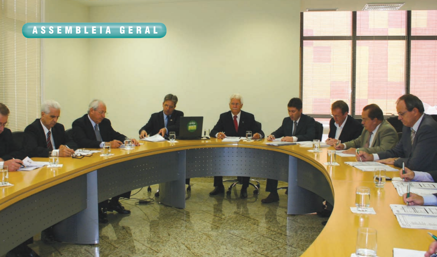
Reunião da Diretoria

as cooperativas, tem significativa participação nos resultados obtidos pelo sistema nos últimos anos. Apenas no último ano, 185 cooperativas foram beneficiadas com a aplicação de recursos do Sescop/PR. Foram realizados 2.946 eventos, com 100.273 participações e 37.286 horas em eventos de capacitação profissional e promoção social. Os índices de satisfação dos participantes em eventos do Sescop/