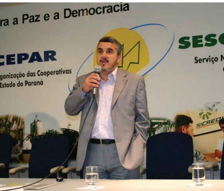
Adoniram Saches Perachi, secretário nacional de Agricultura Familiar

As cooperativas são fundamentais na implantação de projetos que agregam valor aos produtos primários, aumentando o seu valor no mercado e melhorando a renda do cooperado.