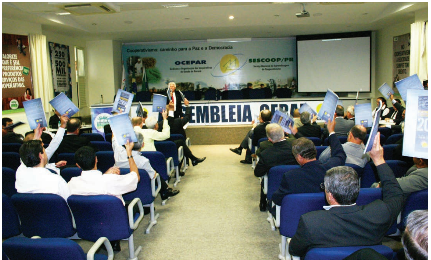
Cooperativistas aprovaram prestação de contas e as ações propostas para 2009

Programa de formação – O programa de formação cooperativista executado pelo SESCOOP, o Sistema S das cooperativas, executado em parceria com