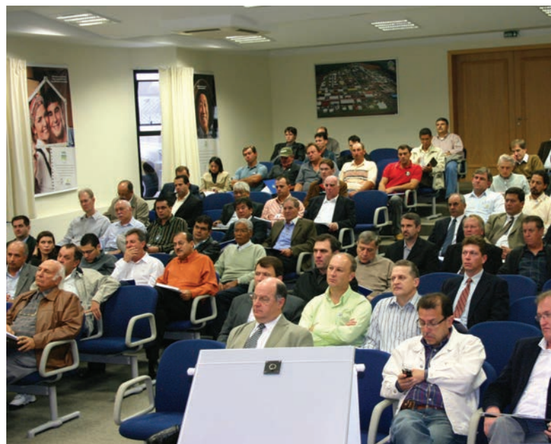
Dirigentes e profissionais das cooperativas participaram do evento

acesso das cooperativas e dos pequenos produtores cooperativados às linhas de crédito do Programa Nacional de Fortalecimento da Agricultura Familiar – PRONAF, apresentam-se as propostas para adequação dos normativos.