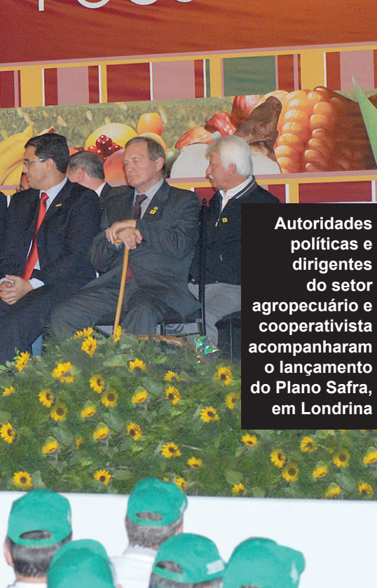
Autoridades políticas e dirigentes do setor agropecuário e cooperativista acompanharam o lançamento do Plano Safra, em Londrina