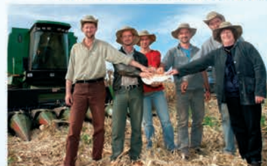
Cooperados - Sucesso em família