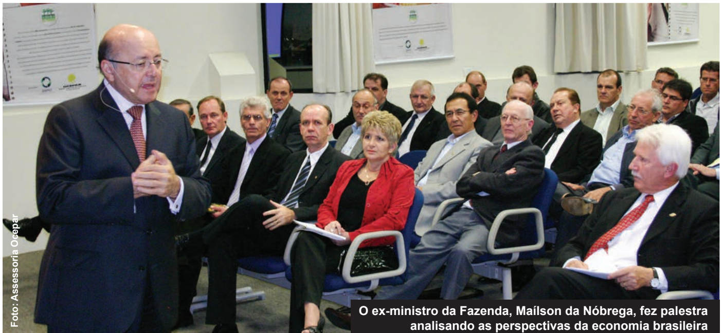
O ex-ministro da Fazenda, Mailson da Nóbrega, fez palestra analisando as perspectivas da economia brasileira

Projeções econômicas - Inflação próxima a 3,9%, câmbio na casa dos R$ 2 e taxa de juros (Selic) de 9%. Esta é a projeção que o ex-ministro da Fazenda Mailson da Nóbrega faz para o país até o fim de 2009. Na palestra sobre as perspectivas econômicas do Brasil, durante o Fórum dos Presidentes, Mailson mostrou-se confiante quanto à reação a crise e fez uma análise dos indicadores financeiros do país. "Temos instituições consistentes e uma diversificação produtiva com imenso potencial, a exemplo do agronegócio", disse. Para o economista, ter câmbio flutuante, um Banco Central autônomo e um sistema financeiro sólido, está fazendo toda a diferença neste momento de turbulência. Aliado a esses fatores, Mailson cita as medidas de saneamento dos bancos e a estabilidade econômica conquistada nos últimos anos. "O povo percebeu que bom mesmo é a estabilidade. Poucos hoje persistem na tese de que a inflação é necessária para o crescimento da economia", finalizou.