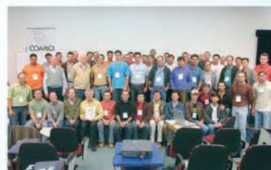
Jovens Líderes Cooperativistas