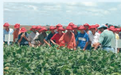
Difusão de Tecnologias aos Cooperados

COAMO AGROINDUSTRIAL COOPERATIVA Forte como o homem do campo.