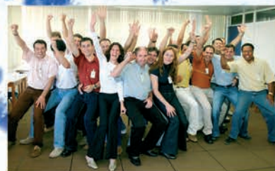
Treinamento de Funcionários

Com isso, mais de 60.000 pessoas, anualmente, têm a oportunidade de trocar experiências e aprendizado nos cerca de 1.600 eventos realizados pela cooperativa. Assim, mais de 100.000 pessoas entre cooperados, funcionários e familiares multiplicam resultados, com união, trabalho e a confiança em um futuro melhor.