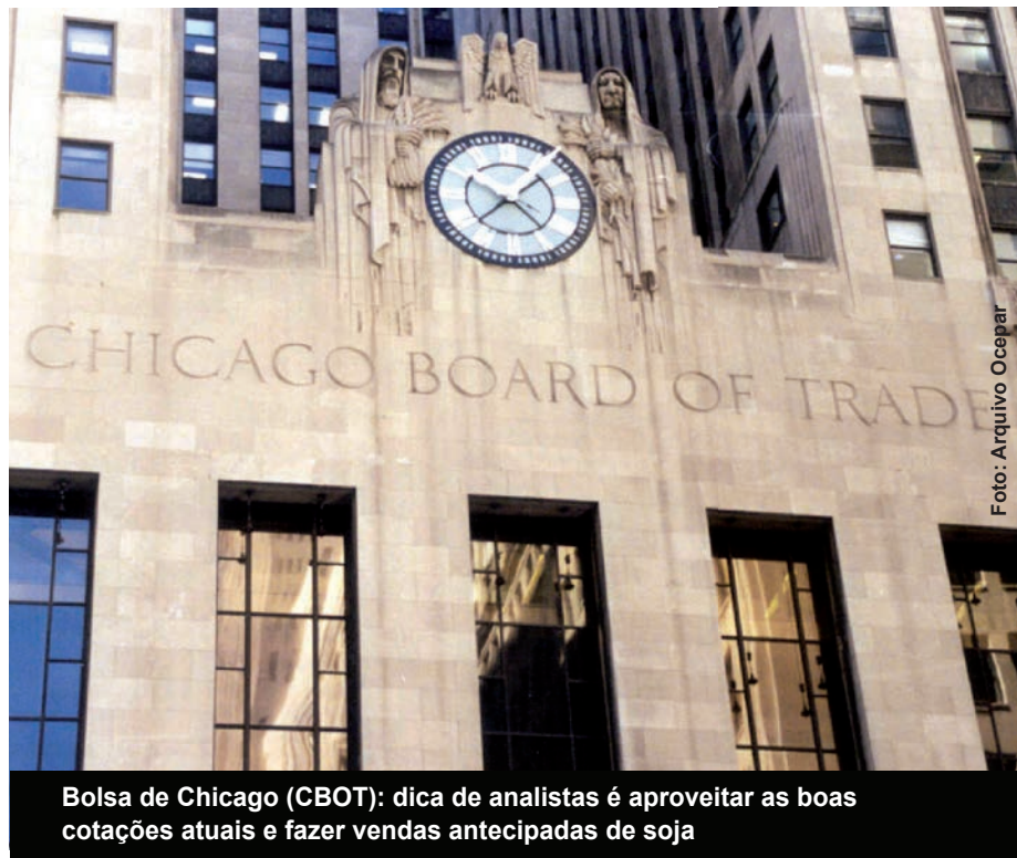
Bolsa de Chicago (CBOT): dica de analistas é aproveitar as boas cotações atuais e fazer vendas antecipadas de soja

Milho – Para o milho, a expectativa é que o cenário de preços baixos que vigorou durante a comercialização da safra 2008/2009 se reverta. Desde julho deste ano, o milho vem sendo negociado, em média, por R$ 14,74 a saca,