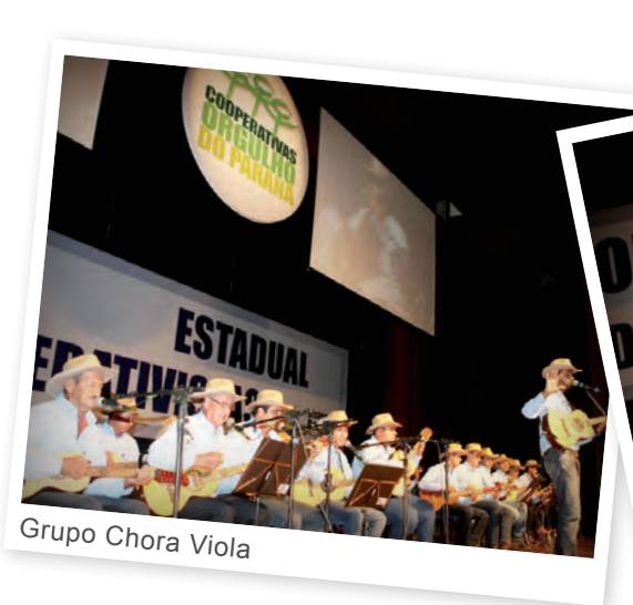
Grupo Chora Viola