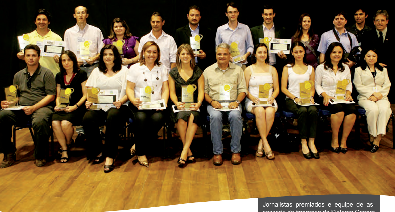
Jornalistas premiados e equipe de assessoria de imprensa do Sistema Ocepar