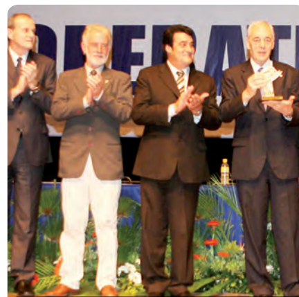
Aplaudido por dirigentes, o ministro da Agricultura, Reinhold Stephanes, recebe o Troféu Cooperativas Orgulho do Paraná

O ministro recebeu o Troféu "Cooperativas Orgulho do Paraná". O prêmio homenageou Stephanes por sua dedicação e apoio às cooperativas e ao desenvolvimento da agropecuária. "Essa homenagem eu dedico para os milhões