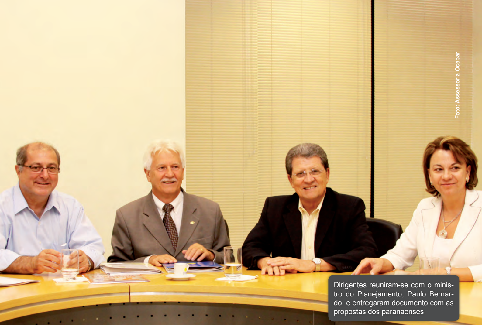
Dirigentes reuniram-se com o ministro do Planejamento, Paulo Bernardo, e entregaram documento com as propostas dos paranaenses

recuperação das estradas no interior. O ministro afirmou estar ciente das dificuldades e prometeu empenho para que a proposta seja incluída pelo Comitê Gestor do PAC 2.