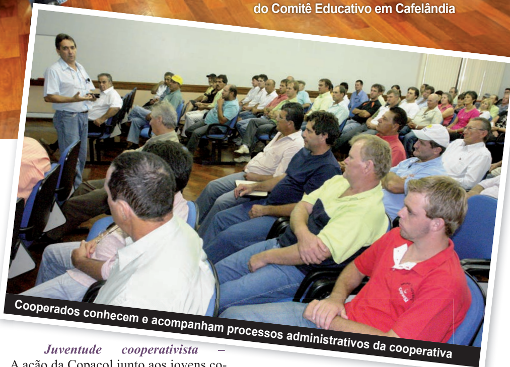
Cooperados conhecem e acompanham processos administrativos da cooperativa