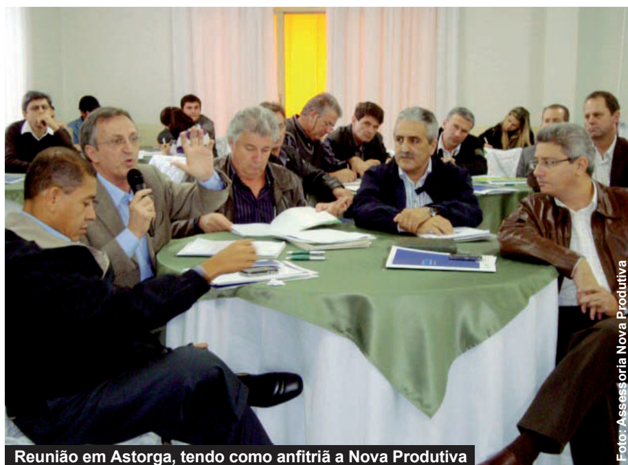
Reunião em Astorga, tendo como anfitriã a Nova Produtiva

Esta sistemática das cooperativas do Paraná em se reunir em núcleos é uma iniciativa pioneira no Brasil e que se tornou exemplo por ser ferramenta eficiente de diálogo com a base. "É uma forma de estar perto das coo-