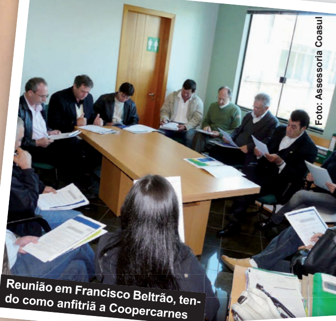
Reunião em Francisco Beltrão, tendo como anfitriã a Coopercarnes