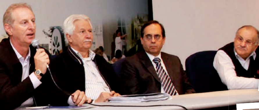
Reunião em Curitiba, tendo como anfitriã a Uniodonto

perativas e cooperados e de discutir assuntos macros relacionados ao setor, a partir da realidade local, tudo através de um processo didático e democrático. O sucesso deste tipo de ação fez a diferença em diversas organizações”, afirma o superintendente do Sistema Ocepar, José Roberto Ricken.