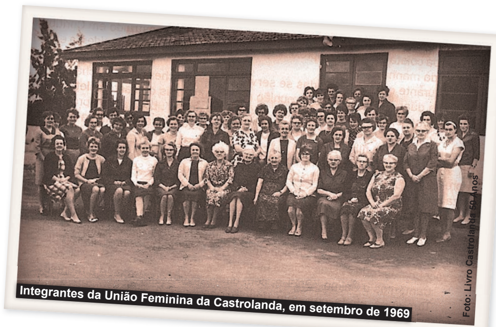
Integrantes da União Feminina da Castrolanda, em setembro de 1969

As discussões eram fortemente influenciadas por uma brasileira: a professora Diva Pinho, considerada a pioneira em promover o debate sobre a igualdade de gêneros no cooperativismo. Ela começou a escrever sobre essa temática em 1962 em função de sua tese de doutorado (Cooperativas e Desenvolvimento Econômico) na Universidade de São Paulo (USP). Depois