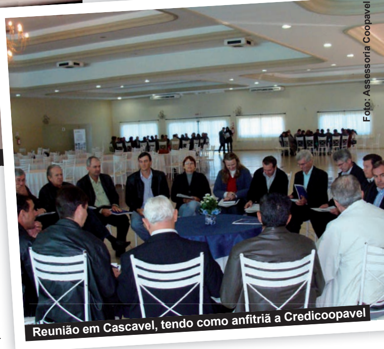
Reunião em Cascavel, tendo como anfitriã a Credicoopavel