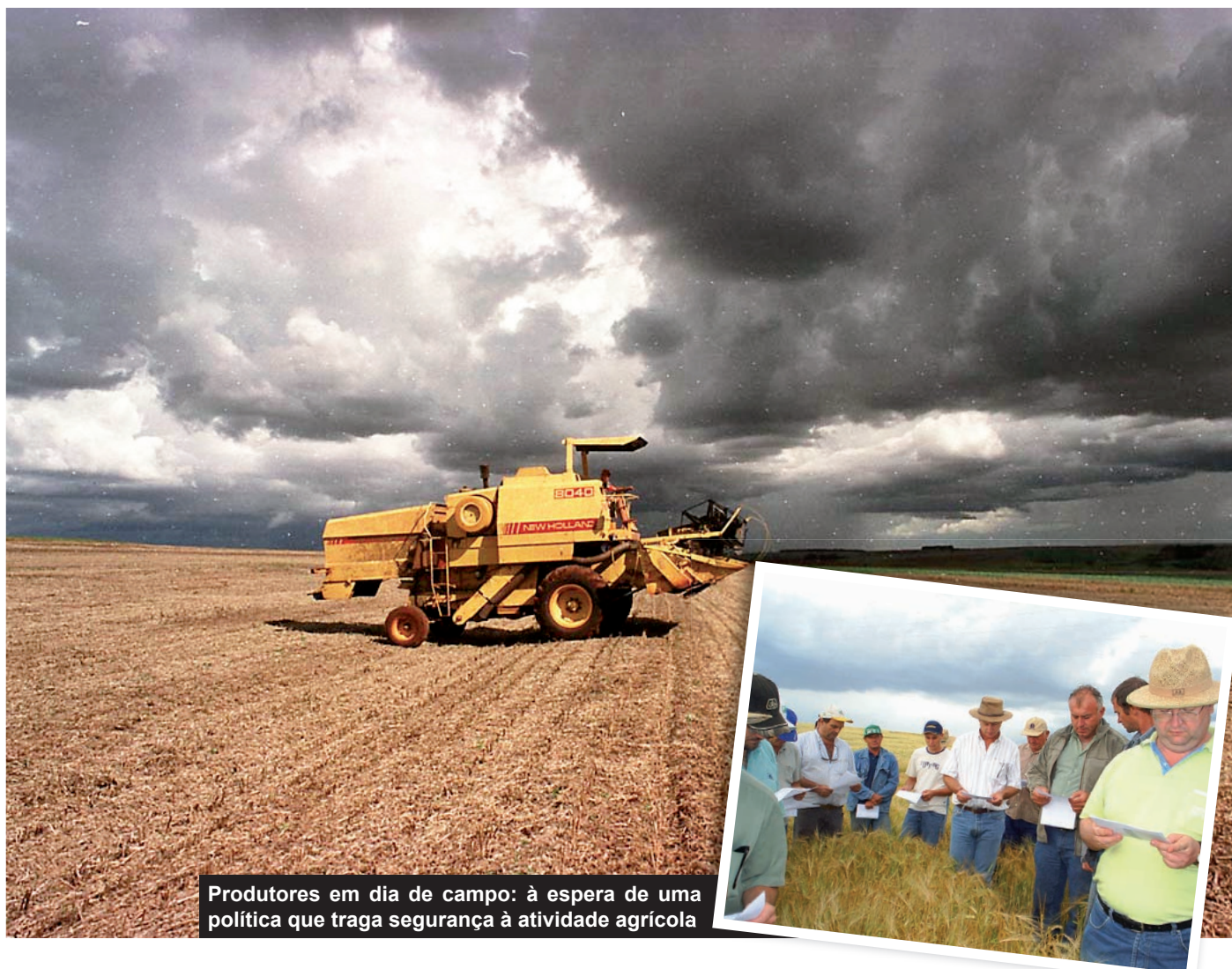
Produtores em dia de campo: à espera de uma política que traga segurança à atividade agrícola

gação de Valor à Produção Agropecuária), que teve aumento do limite de financiamento para projetos de industrialização, a Ocepar e a OCB reivindicam a inclusão das cooperativas singulares no rol das beneficiárias. Outras questões avaliadas como positivas foram o aumento dos recursos destinados aos médios agricultores (Pronamp) e a criação do Programa ABC (Agricultura de Baixo Carbono), proposição feita pelo setor produtivo do Paraná para possibilitar a recuperação de milhares de hectares de áreas degradadas. “Apesar de algumas medidas positivas, muitos pontos do Plano Safra precisam ser revistos. Quanto às questões essenciais e estruturantes, não avançamos nada e persistem os problemas”, conclui Koslovski. ■