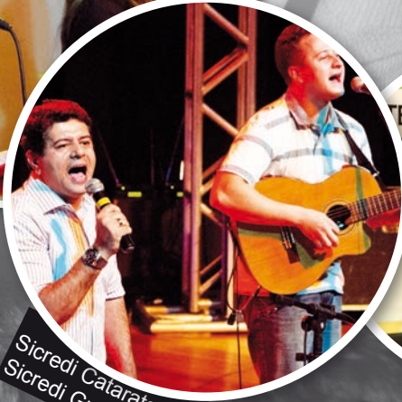
Sicredi Cataratas Sicredi Guarapuava