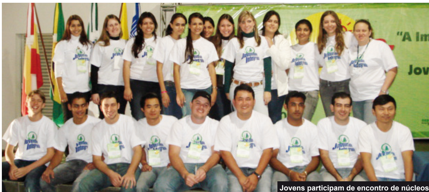
Jovens participam de encontro de núcleos