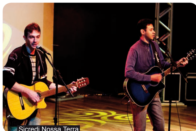
Sicredi Nossa Terra