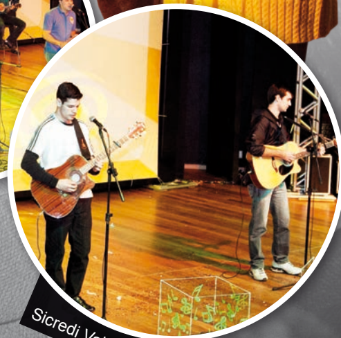
Sicredi Vale do Piquiri