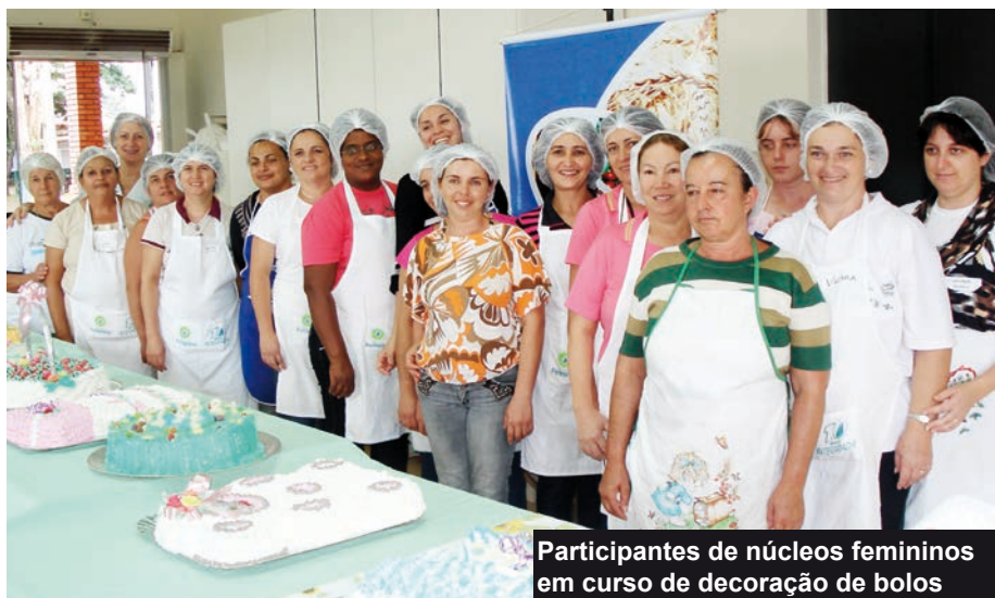
Participantes de núcleos femininos em curso de decoração de bolos

truturas e alternativas de diversificação de renda. No último encontro, realizado em junho no município de Bandeirantes, Norte do Paraná, os coordenadores conheceram um consórcio de criação de peixes e as estruturas de recebimento adquiridas pela Integrada. “Muitas vezes, experiências bem sucedidas numa região podem ser implantadas ou inspirar projetos semelhantes em outras comunidades”, observa.