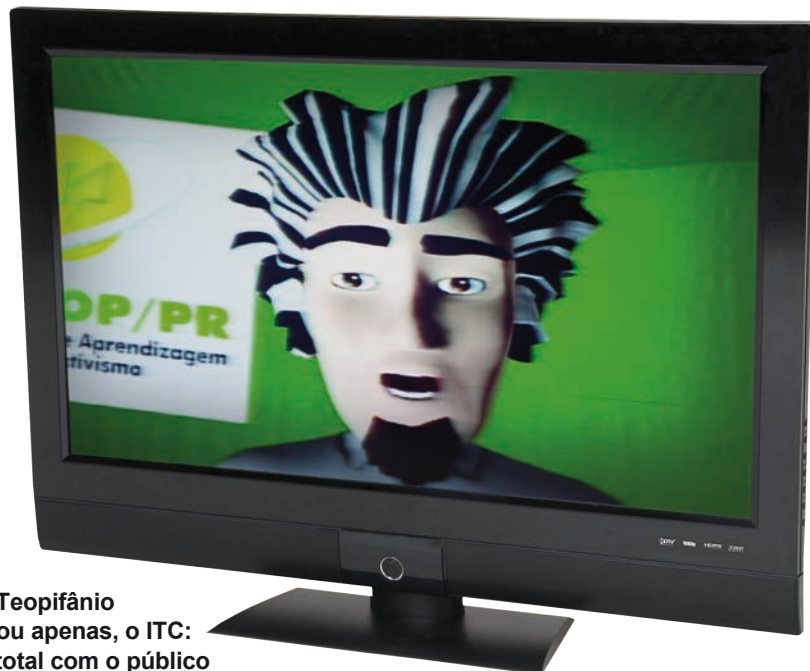
Istreluido Teopifânio Cabulani, ou apenas, o ITC: interação total com o público