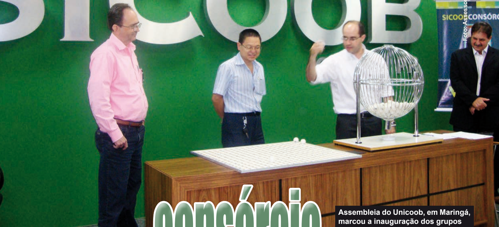
Assembleia do Unicoob, em Maringá, marcou a inauguração dos grupos