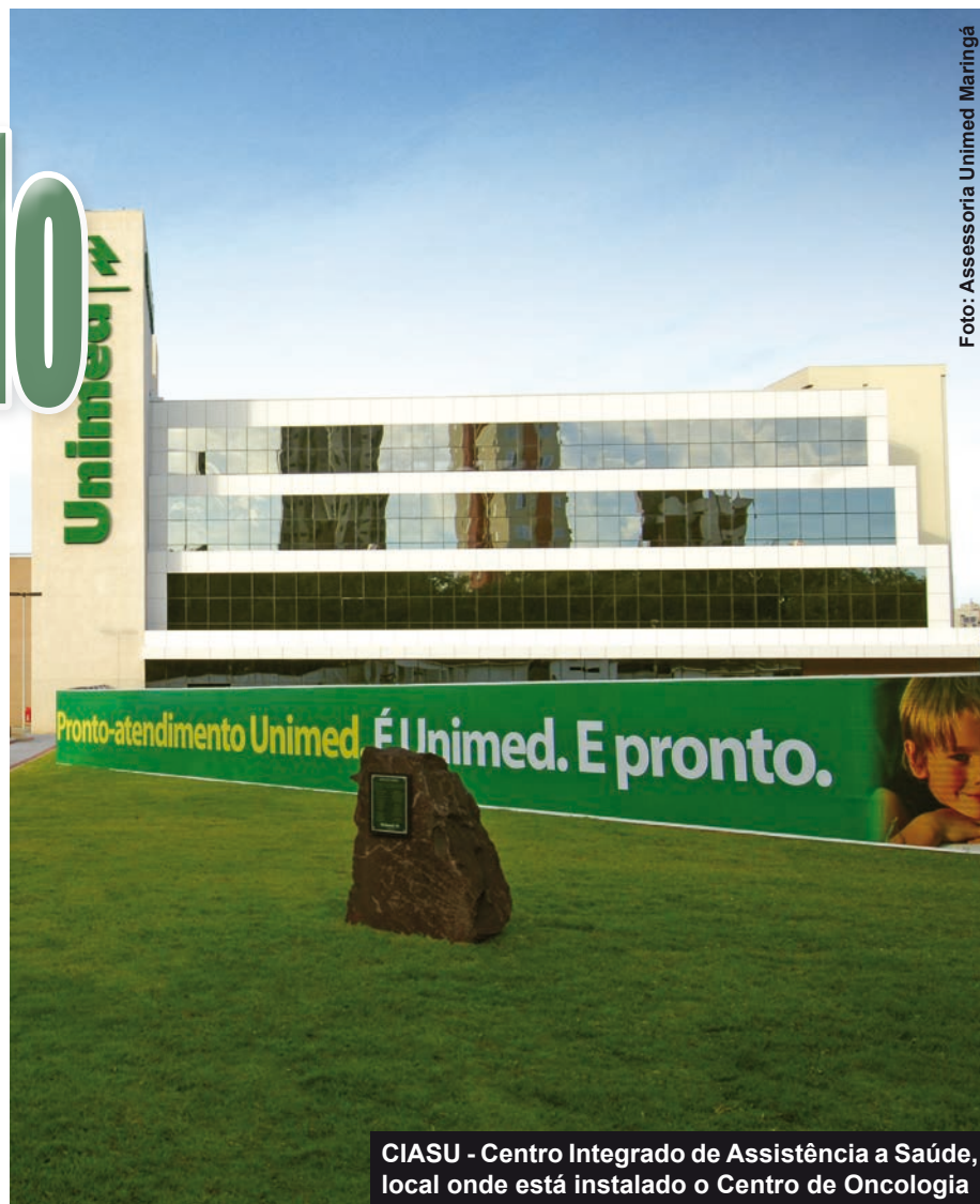
CIASU - Centro Integrado de Assistência a Saúde, local onde está instalado o Centro de Oncologia

Com infraestrutura moderna e um atendimento de excelência, o Centro de Oncologia é composto por três salas de aplicação: duas para adultos, com poltronas e leitos e, uma infantil, com poltronas, berço, leito e brinquedoteca. Completam a estrutura física dois apartamentos priva-