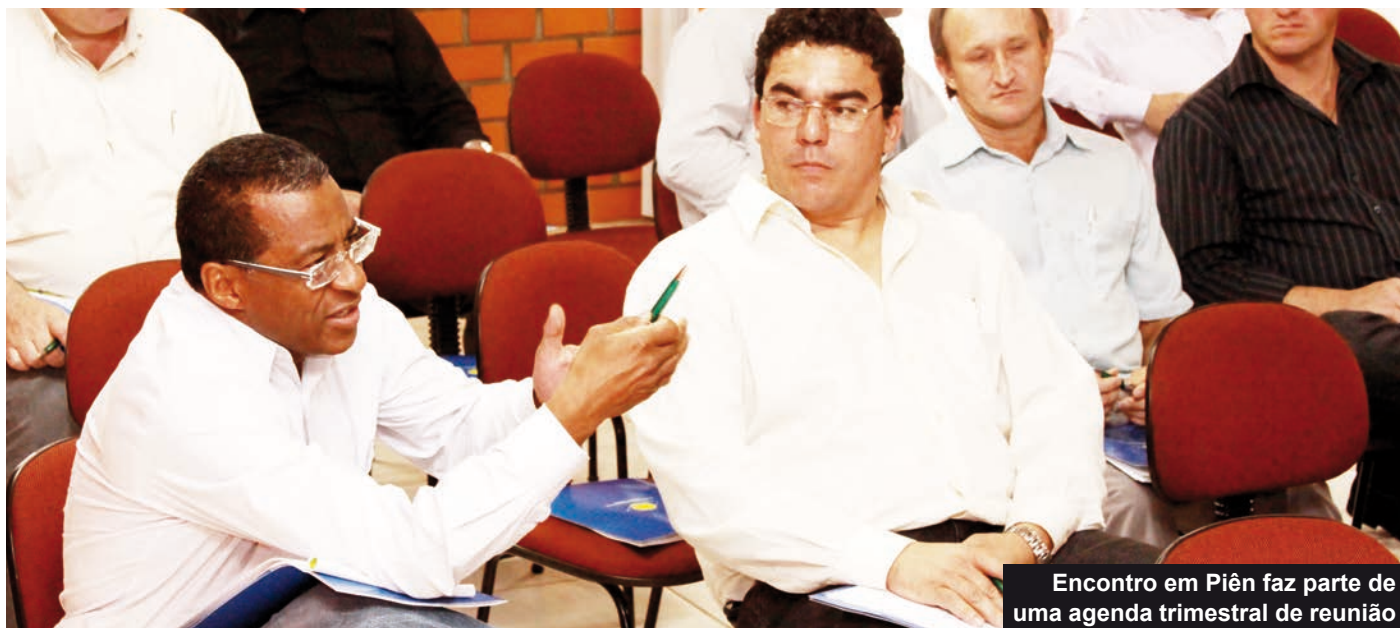
Encontro em Piên faz parte de uma agenda trimestral de reunião