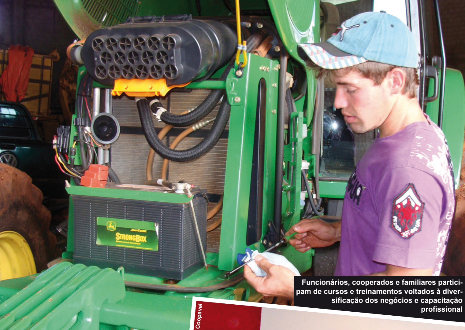
Funcionários, cooperados e familiares participam de cursos e treinamentos voltados à diversificação dos negócios e capacitação profissional

Graças ao projeto, mais de 2,5 mil pessoas ingressaram em cursos de graduação ou pós-graduação. Um balanço geral, no entanto, mostra que somente em 2009 aconteceram 597 treinamentos, abrangendo 15.855 pessoas, entre funcionários, associados, esposas, filhos e pessoas das comunidades, participaram das atividades nesse período. Dessas, 250 cursaram faculdades ou pós-graduações. Para o próximo ano já estão sendo realizados novos convênios com escolas de idiomas, colégios particulares de ensino fundamental e com o SESI – para cursos técnicos profissionalizantes.