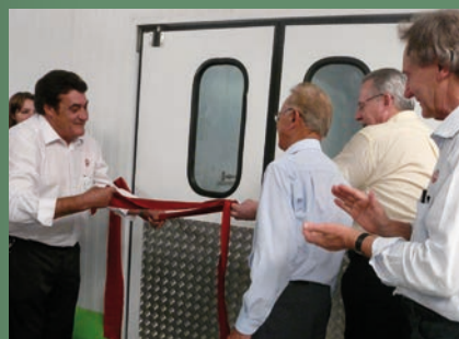
Presidente Paulino Fachin, governador Orlando Pessuti e demais autoridades descerram a fita inaugural

A cooperativa investiu R$ 150 milhões no novo empreendimento, financiados pelo BNDES (Banco Nacional de Desenvolvimento Econômico e Social) e Banco Regional de Desenvolvimento do Extremo Sul (BRDE).