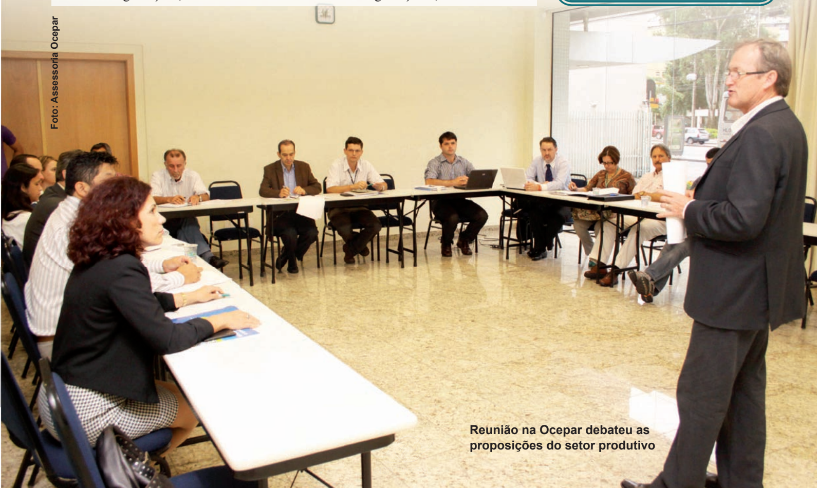
Reunião na Ocepar debateu as proposições do setor produtivo