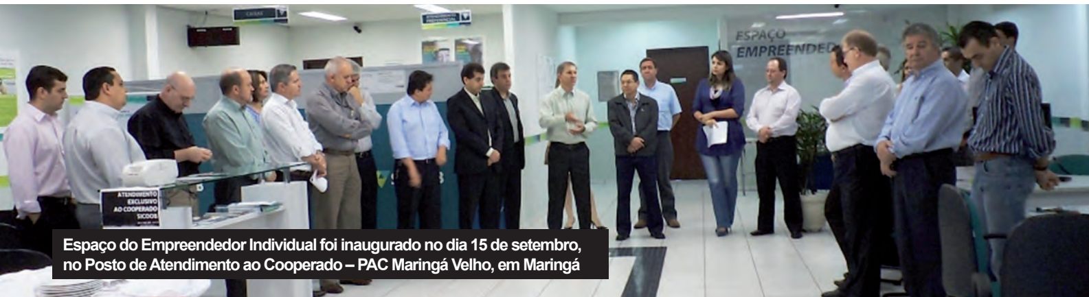
Espaço do Empreendedor Individual foi inaugurado no dia 15 de setembro, no Posto de Atendimento ao Cooperado – PAC Maringá Velho, em Maringá

Em um segundo momento, a ideia é o lançamento de produtos para as micro e pequenas empresas também. O convênio foi fechado, inicialmente, com a cooperativa singular, mas deve abranger as 18 outras cooperativas de crédito que integram a rede Sicoob no Paraná. “A existência de uma Sociedade de Garantia de Crédito (SGC) na região, a Noroeste Garantias, permite uma convergência de projetos, pois se o empreendedor pleitear um crédito e não tiver garantias suficientes para oferecer, poderá contar com o apoio da SGC”, complementa Locatelli.