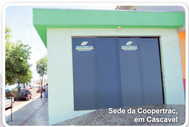
Sede da Coopertrac, em Cascavel