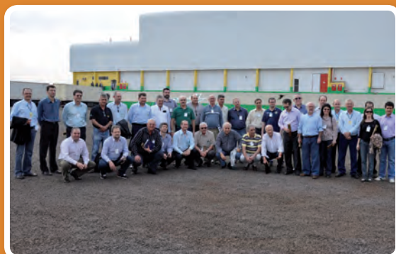
Copagril, Marechal Cândido Rondon