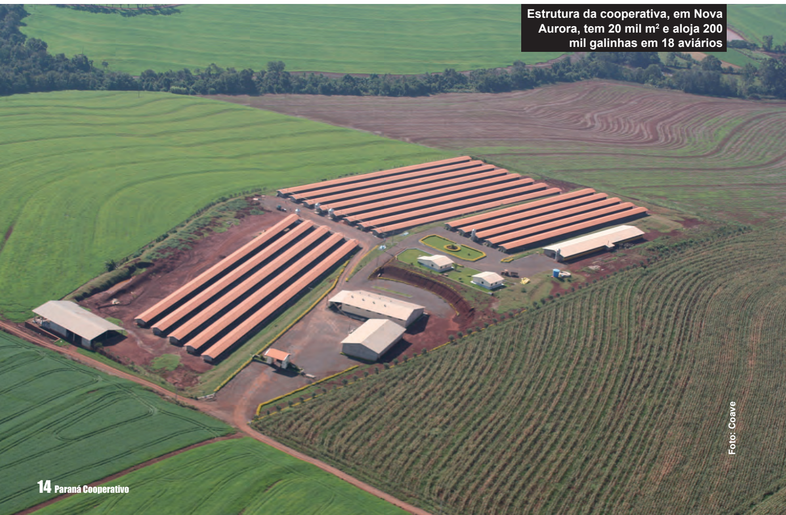
Estrutura da cooperativa, em Nova Aurora, tem 20 mil m 2 e aloja 200 mil galinhas em 18 aviários

“A obtenção do SIF como entreposto de ovos deve acontecer até o começo de 2012, o que trará novas oportunidades de negócios”, afirma o dirigente. O registro do Serviço de Inspeção Federal autorizará também a cooperativa a exportar sua produção, além de permitir a venda de frangas de recria. “A legislação proíbe a revenda. Todas as aves em formação devem ser utilizadas exclusivamente na