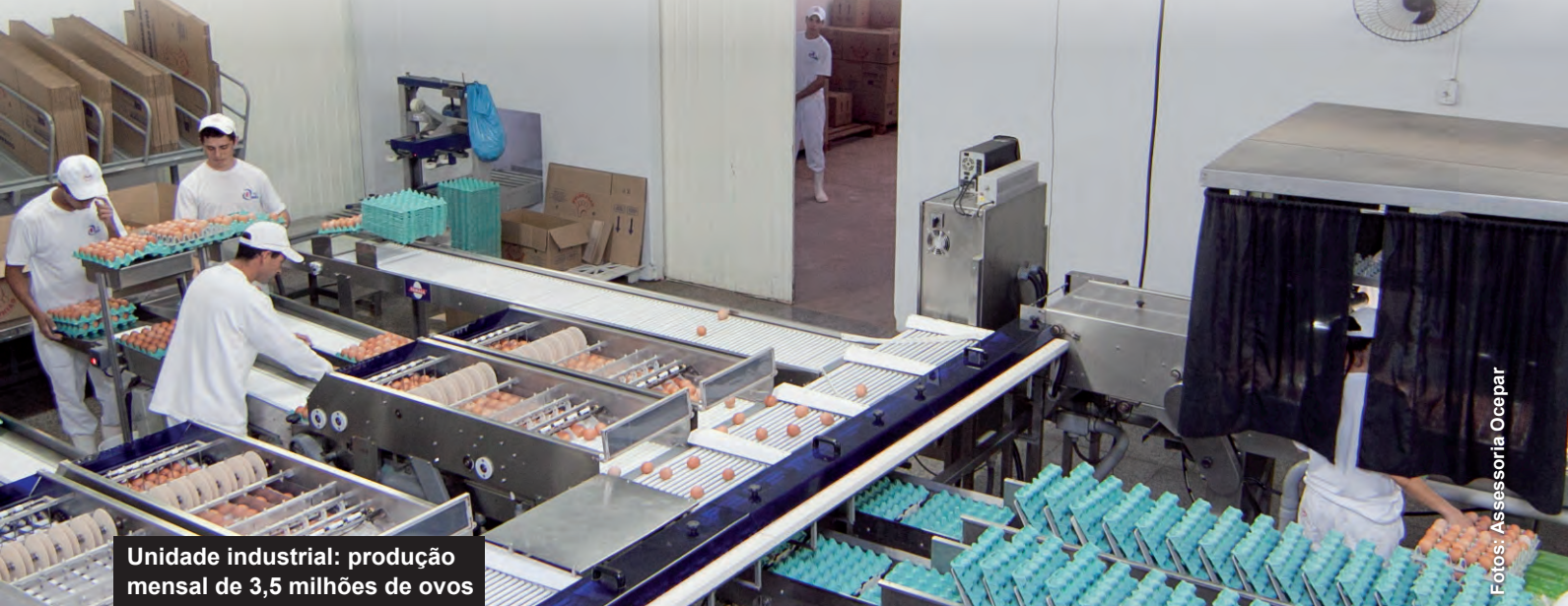
Unidade industrial: produção mensal de 3,5 milhões de ovos