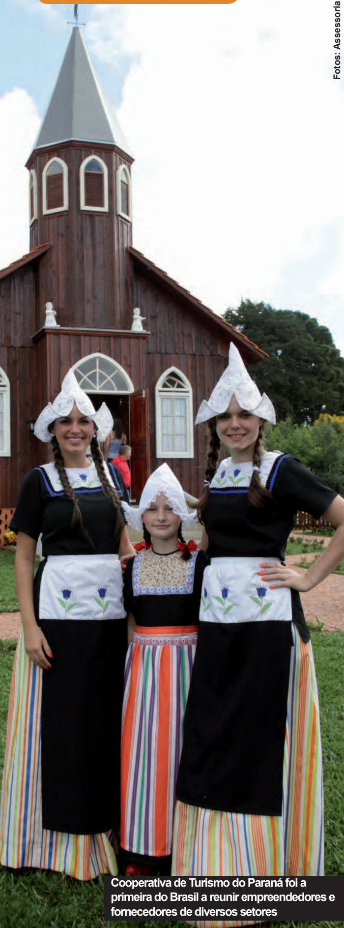
Cooperativa de Turismo do Paraná foi a primeira do Brasil a reunir empreendedores e fornecedores de diversos setores