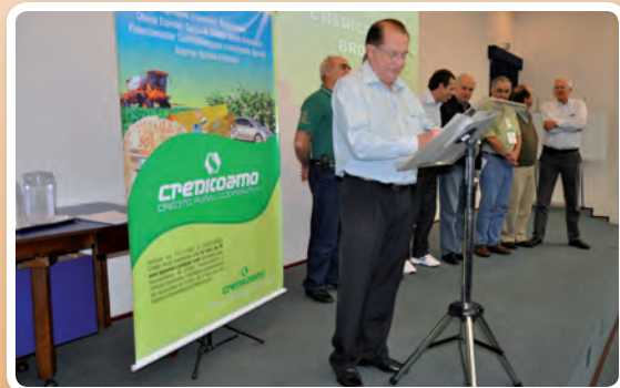
Coamo, Campo Mourão