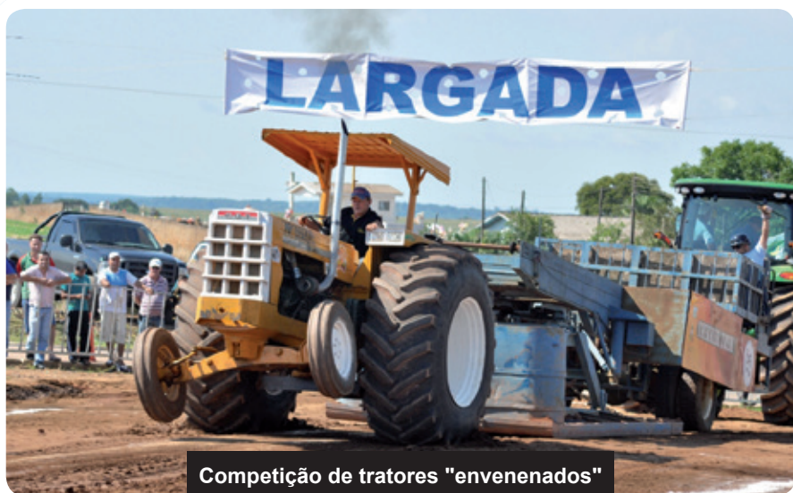
Competição de tratores "envenenados"

O governador elogiou a iniciativa dos suábios em construir um novo espaço destinado a guardar a memória de sua etnia. O antigo prédio do museu