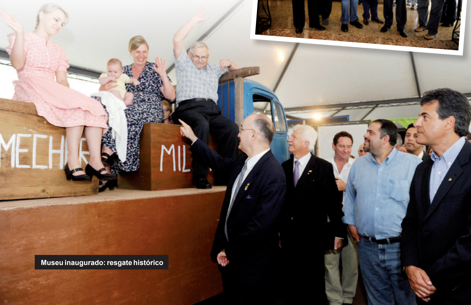
Museu inaugurado: resgate histórico