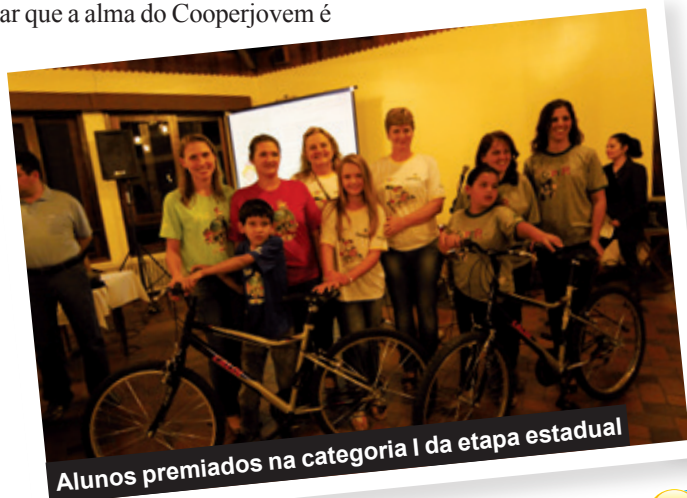
Alunos premiados na categoria I da etapa estadual

Programa Cooperjovem – O Programa Cooperjovem foi implantado pelo Sescop Nacional em todo o País em 2002, com o objetivo de estimular a cultura da cooperação no ambiente escolar. No Paraná, é realizado em parceria com 12 cooperativas, em 41 municípios, envolvendo 10 mil alunos e 564 professores.