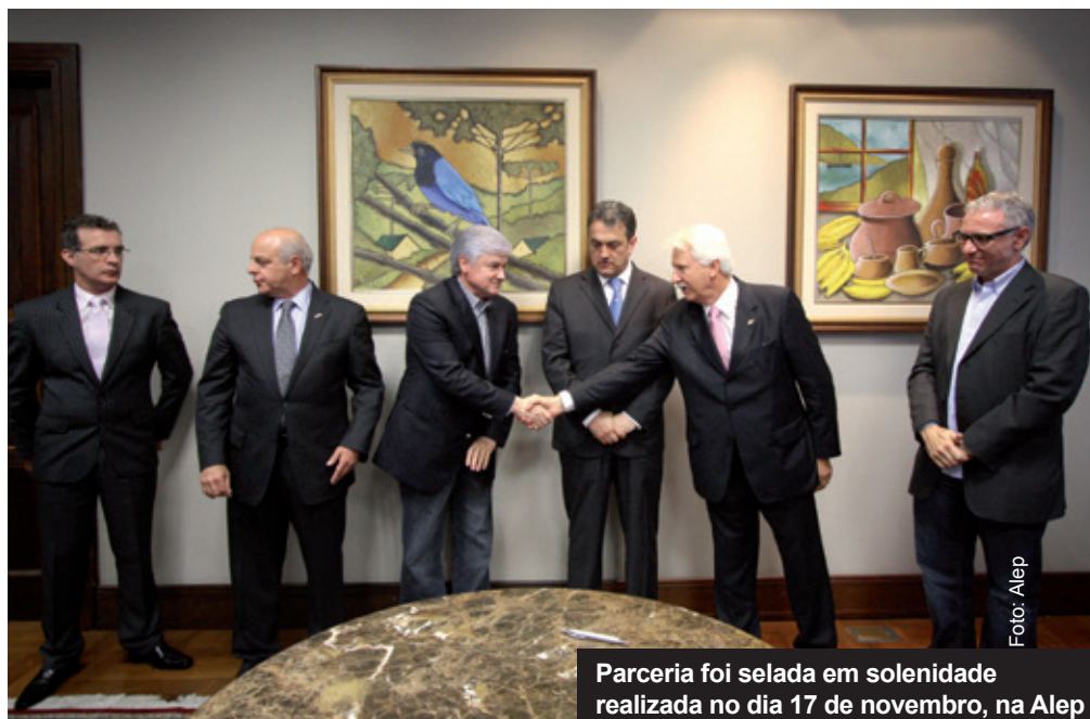
Parceria foi selada em solenidade realizada no dia 17 de novembro, na Alep

“No ramo do agronegócio, as cooperativas são responsáveis por 54% da produção agrícola e dinamizam a economia paranaense. Hoje, o cooperativismo é responsável por 1 milhão e 500 mil postos de trabalho, uma força viva da sociedade e que faturou, em 2010, cerca de R$ 28 bilhões. Promove a interiorização da economia. Temos 11 cooperativas com movimentação econômica superior a R$ 1 bilhão, levando o desenvolvimento para todos os cantos do Paraná”, acrescentou o dirigente cooperativista.