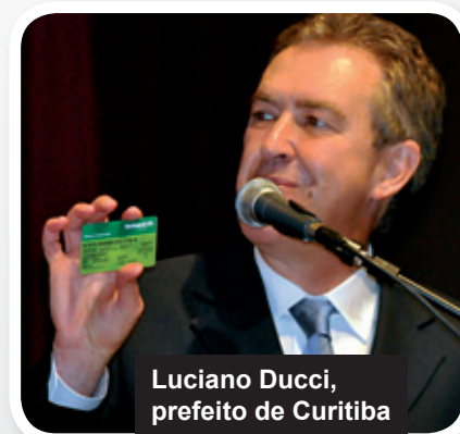
Luciano Ducci, prefeito de Curitiba

é referência para o Brasil na geração de riquezas e empregos”, afirmou. “A Prefeitura adquire diversos produtos das cooperativas para os 32 Armazéns da Família que funcionam na cidade. Isto permite que mais de 200 mil famílias comprem produtos até 30% mais baratos em relação à rede convencional de supermercados”, frisou.