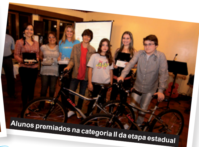
Alunos premiados na categoria II da etapa estadual