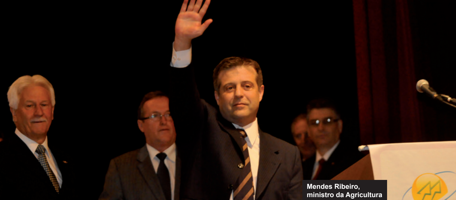
Mendes Ribeiro, ministro da Agricultura