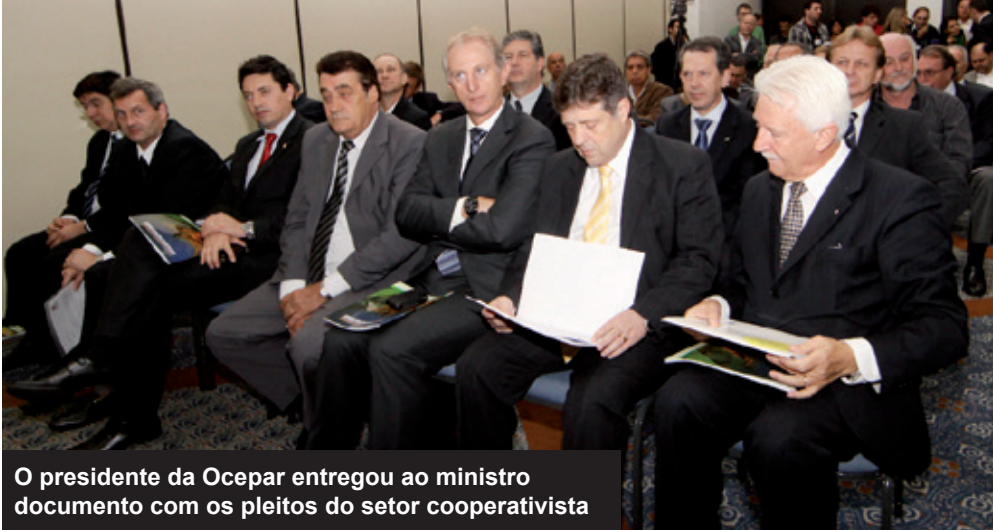
O presidente da Ocepar entregou ao ministro documento com os pleitos do setor cooperativista

Segundo o dirigente, para garantir renda é preciso existir seguro rural consistente e acessível para danos causados por questões climáticas; fundo garantidor de crédito para dar condições de financiamento aos produtores e seguro de renda baseado em valor referencial dos produtos, que cubra os custos de produção e garanta margem de rentabilidade aos agricultores. “Com uma política de garantia de renda, o governo não precisaria mais fazer leilões e compras emergenciais de estoques para gerar liquidez e evitar prejuízos vultosos ao setor agropecuário. E, principalmente, teríamos uma política agrícola duradoura e estável”, afirma o presidente da Ocepar.