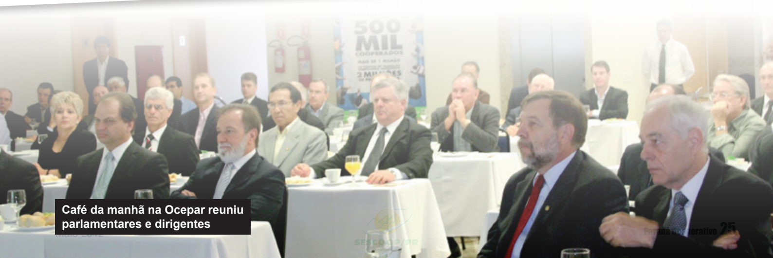
Café da manhã na Ocepar reuniu parlamentares e dirigentes