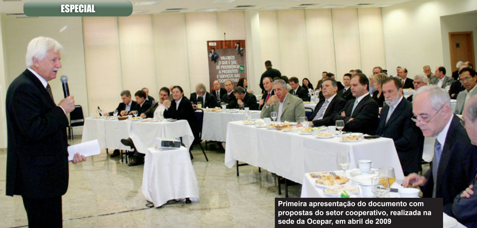
Primeira apresentação do documento com propostas do setor cooperativo, realizada na sede da Ocepar, em abril de 2009