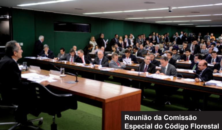
Reunião da Comissão Especial do Código Florestal