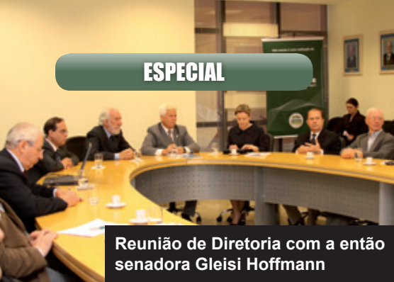
Reunião de Diretoria com a então senadora Gleisi Hoffmann