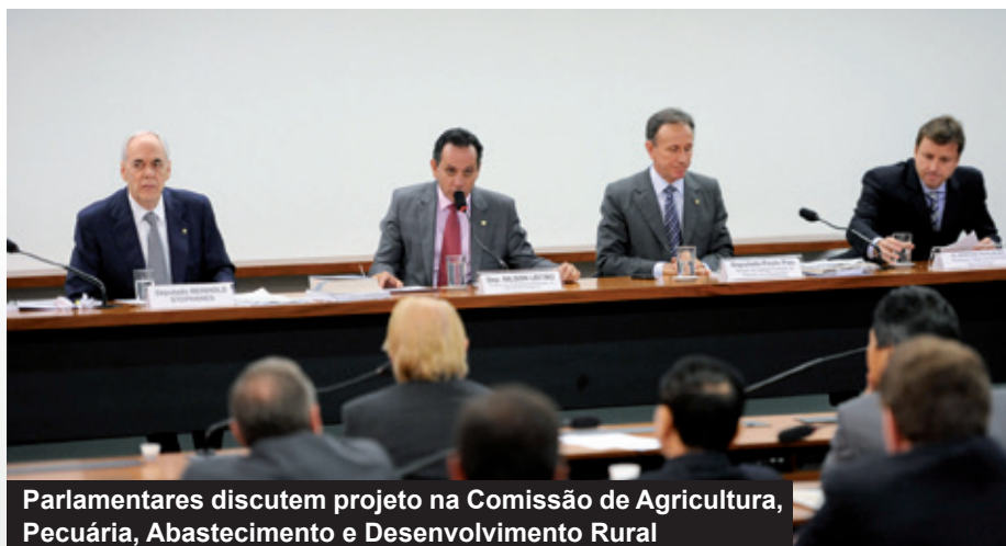
Parlamentares discutem projeto na Comissão de Agricultura, Pecuária, Abastecimento e Desenvolvimento Rural

Feitos os devidos estudos e, por considerar que o texto sancionado, apesar de ser um avanço em relação à legislação atual, deixou lacunas e não atende totalmente aos anseios do setor produtivo paranaense, o Sistema Ocepar preparou um documento com proposições para as emendas parlamentares que pretendem alterar a Medida Provisória (MP) 571. Os deputados e senadores tiveram até a meia-noite do dia 4 de junho para apresentarem suas emendas. No dia seguinte (05/06), foi instalada a comissão mista do Congresso que irá analisar previamente a MP. O senador Luiz Henrique (PMDB-SC) foi escolhido relator da comissão. Segundo o parlamentar, a Comissão buscará o convencimento dos demais parlamentares para superar temas polêmicos da nova lei.