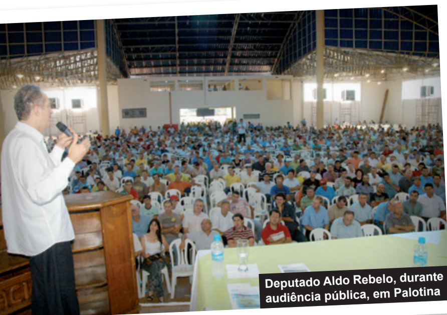
Deputado Aldo Rebelo, durante audiência pública, em Palotina

Também em 2009, aconteceram diversas reuniões em Brasília, na OCB e no Ministério do Meio Ambiente, a fim de apresentar a posição do setor cooperativo e acompanhar o andamento das discussões sobre o tema. Ainda nesse ano, um Grupo Técnico e Jurídico foi criado na OCB para discutir a reformulação do Código Florestal Brasileiro. O Sistema Ocepar integrou esse Grupo que, entre outras ações, reuniu-se com deputados federais e senadores para discussão do texto do novo Código Florestal.