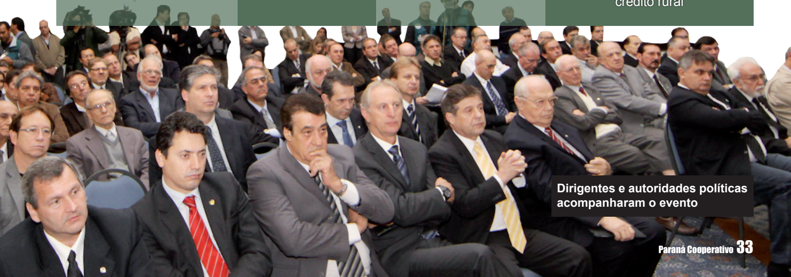
Dirigentes e autoridades políticas acompanharam o evento

Criar programa específico para cooperados e produtores de médio porte Acesso das cooperativas de crédito ao Fundo de Amparo ao Trabalhador (FAT) para concessão de crédito rural