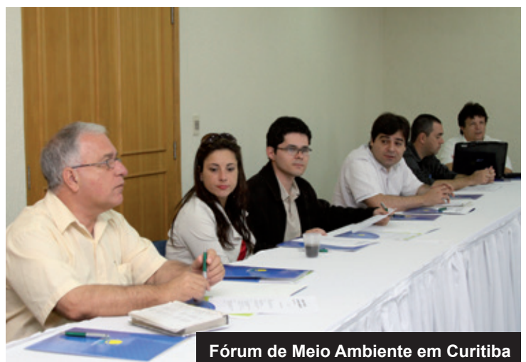
Fórum de Meio Ambiente em Curitiba