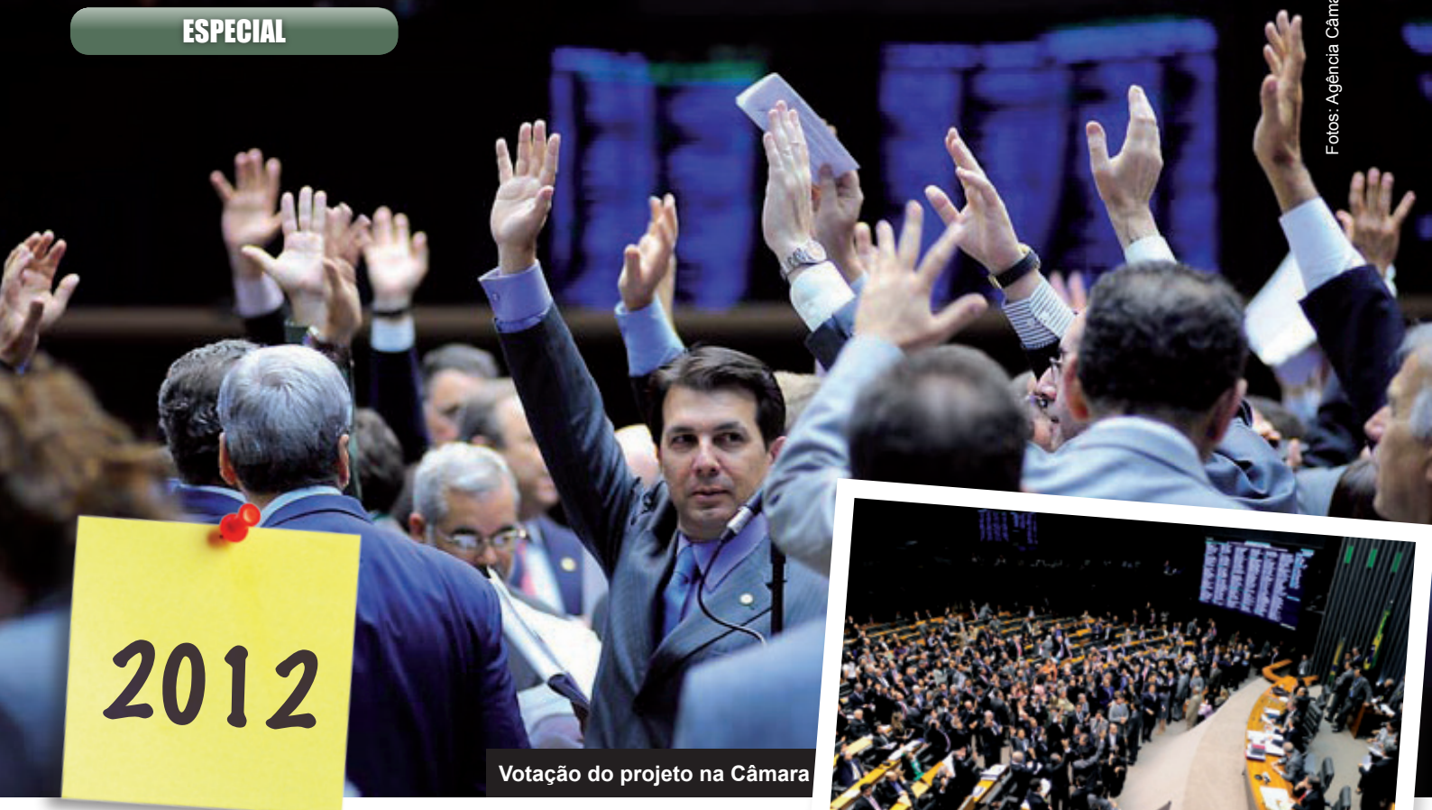
Votação do projeto na Câmara