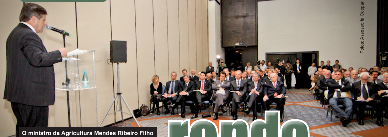
O ministro da Agricultura Mendes Ribeiro Filho