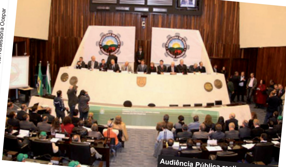
Audiência Pública realizada na Assembleia Legislativa do Paraná