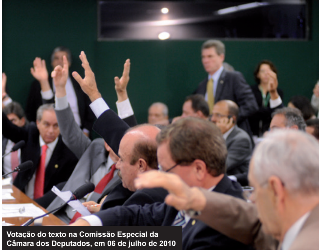
Votação do texto na Comissão Especial da Câmara dos Deputados, em 06 de julho de 2010