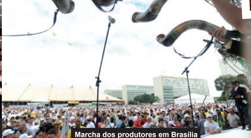
Marcha dos produtores em Brasília