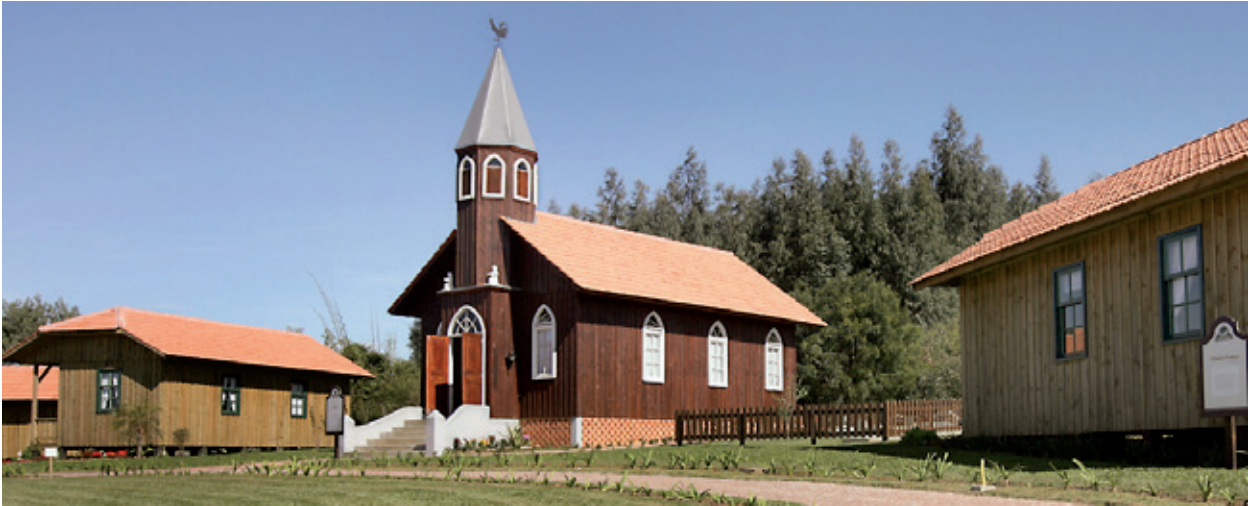
Parque Histórico de Carambeí