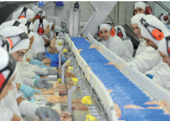
Abatedouro de frango da cooperativa

Superação foi o principal atributo que fez a C.Vale, de Patolína, passar de cooperativa