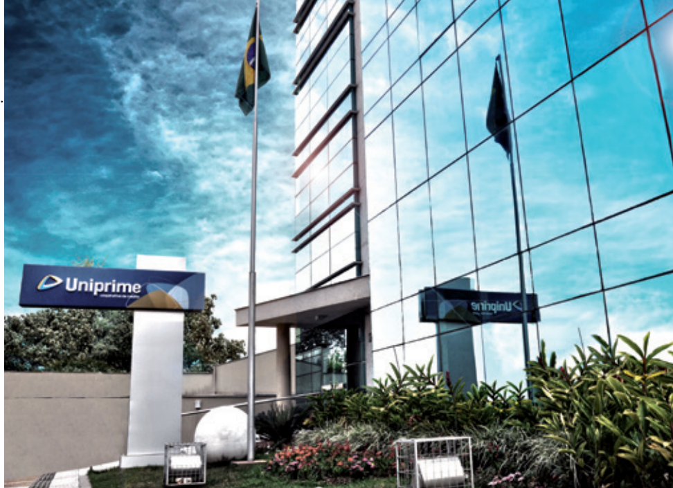
Cooperativa amplia presença em estados vizinhos