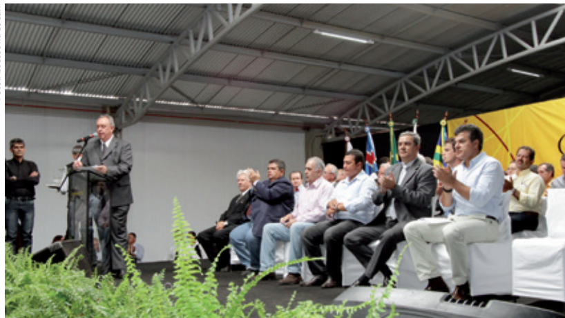
Cerca de duas mil pessoas participaram do evento, que reuniu autoridades e lideranças