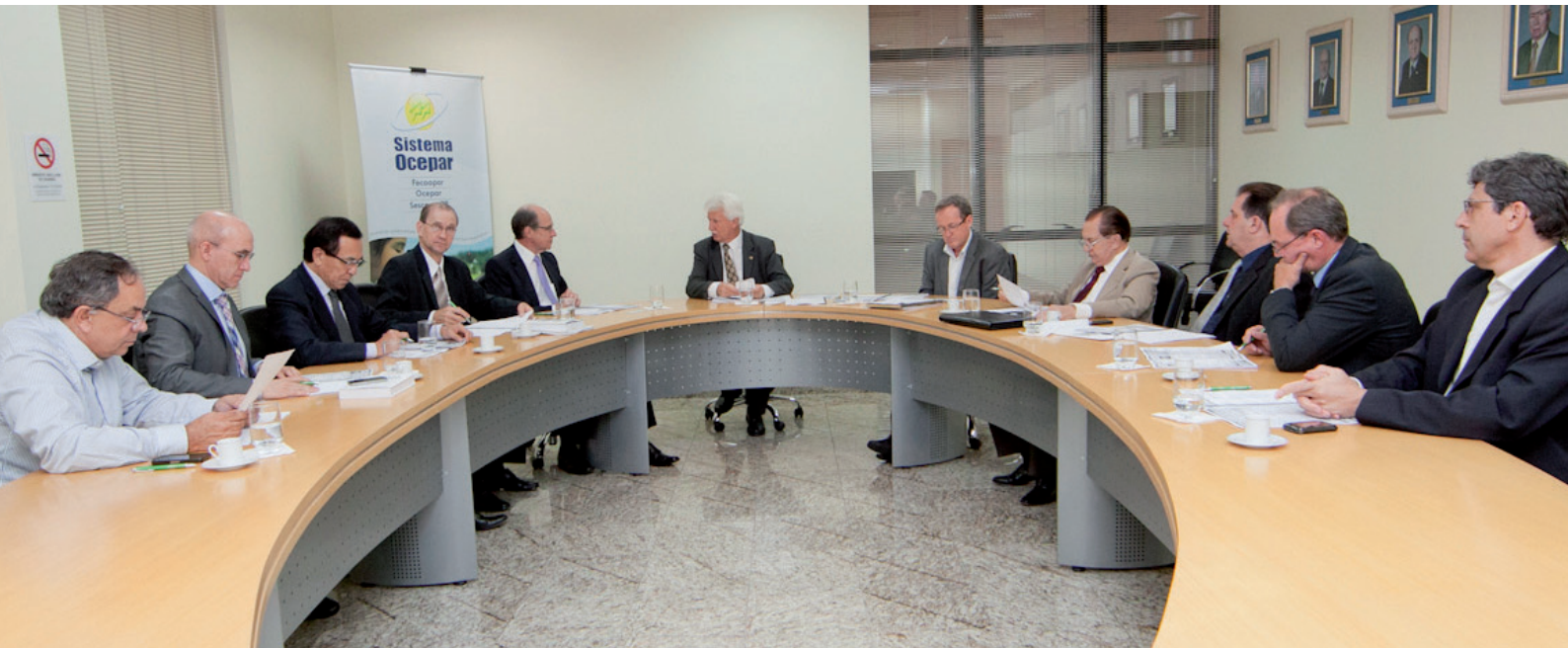
Novo Código Florestal foi tema de debates durante a Reunião de Diretoria da Ocepar