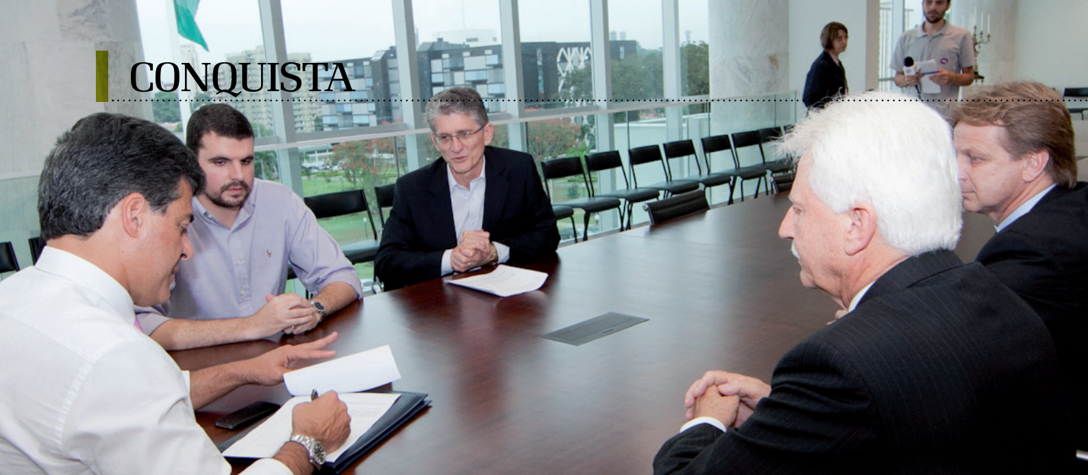
Governador Beto Richa assinou o documento no dia 25 de outubro, no Palácio Iguazu, em Curitiba