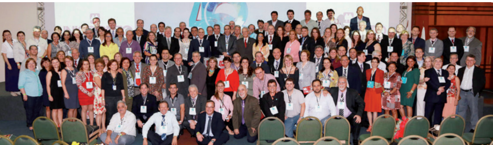
Cooperados, dirigentes e convidados participaram dos debates