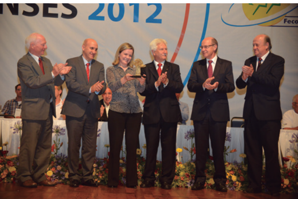
A homenagem foi um reconhecimento ao empenho da ministra em prol do desenvolvimento do cooperativismo paranaense