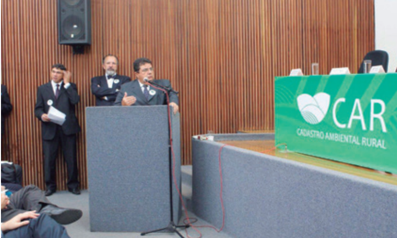
OCB atuará como orientador e apoiador durante o processo de cadastramento

Código Florestal - Na opinião da OCB, o novo Código Florestal traz mecanismos mais claros e justos que a versão anterior (Lei 4771/1965). Em termos globais, o texto sancionado pela presidência da República reconhece a importância do campo brasileiro na geração de renda, observa a segurança alimentar do país e estabelece diretrizes de atuação alinhadas ao desenvolvimento sustentável. É, portanto, positiva ao crescimento da economia brasileira e do setor agropecuário, minimizando os impactos dessas atividades no meio ambiente.