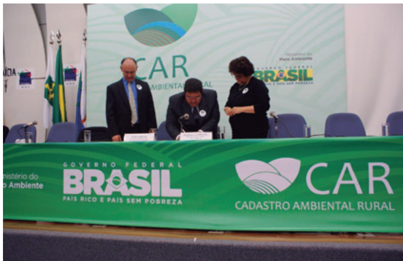
Acordo visa acelerar implantação do CAR e com isso garantir o cumprimento da meta de cadastrar 100% das propriedades rurais do país num prazo de cinco anos

Segundo a ministra, os órgãos ambientais querem conversar com os produtores rurais para equacionar o programa da regularização ambiental, previsto no novo Código