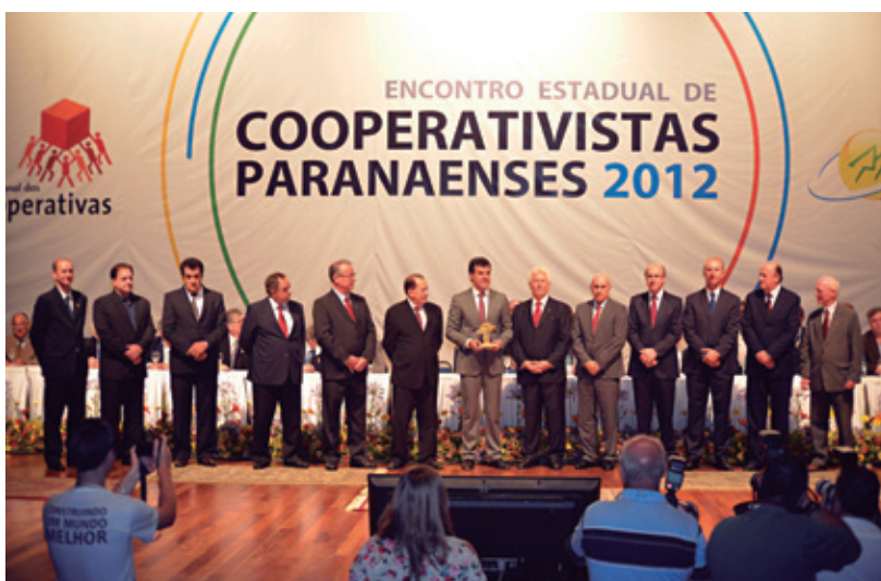
Dirigentes cooperativistas juntamente com o presidente do Sistema Ocepar João Paulo Koslovski e o governador Beto Richa, durante o Encontro Estadual de Cooperativistas Paranaenses

Cooperativas paranaenses dos mais diferentes ramos de atuação expandiram seus negócios em 2012 e se prepararam com otimismo para mais um ano de crescimento. A Central Sicoob Paraná, por exemplo, está estimando alcançar crescimento real aproximado de 40% em relação ao ano passado. Com sede em Maringá, Noroeste do Estado, e congregando 18 cooperativas singulares de crédito e 110 mil cooperados, o sistema abriu em 2012 mais de 30 postos de atendimento. "Hoje, o Sicoob Paraná está com 112 agências funcionando no Estado. A nossa meta para 2013 é abrir entre 35 e 40 novas agências. Nós fechamos 2011 com R$ 1 bilhão de ativos e devemos concluir 2012 chegando a cerca de R$ 1,5 bilhão de ativos", disse o presidente exe-