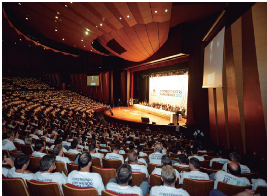
Evento aconteceu no Teatro Positivo, em Curitiba, e reuniu cerca de 2 mil pessoas