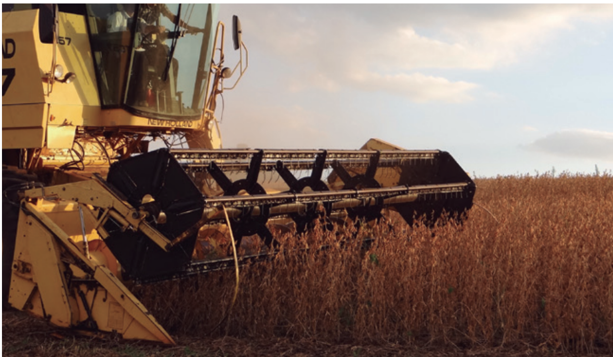
Safra positiva pode alavancar indicadores em 2013, avaliam lideranças

safra causada pelo clima, nós imaginamos obter um resultado semelhante ao desse ano em 2013”, acrescentou.