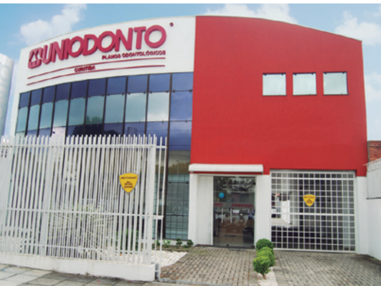
Sede da cooperativa, em Curitiba

Com expansão média de 22% ao ano, cooperativa atingiu a marca de 405 mil beneficiários