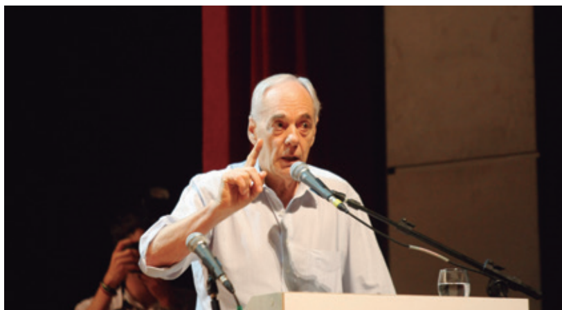
Deputado federal Reinhold Stephanes

Stephanes ressaltou que esse dado é extremamente importante para as cooperativas do Paraná, setor que responde por 56% do PIB agrícola estadual, com exportações de R$ 2,2 bilhões e geração de R$ 1,5 bilhão em impostos. "O cooperativismo teve e ainda terá uma grande participação no avanço da agricultura do Paraná e do Brasil, em função da capacitação promovida pelo setor no meio rural, pelo desenvolvimento econômico e social e pela aplicação da tecnologia que elas fazem. Nós já temos cooperativas no Paraná que pegam a tecnologia dos órgãos de pesquisas e adaptam a realidade climática e de solo das suas regiões, para depois distribuir aos seus associados. Veja só que coisa sensacional e que ganho de eficiência que esse tipo de iniciativa promove", exemplifica.