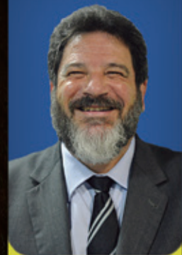
Entrevista: Mario Sergio Cortella Pág. 06