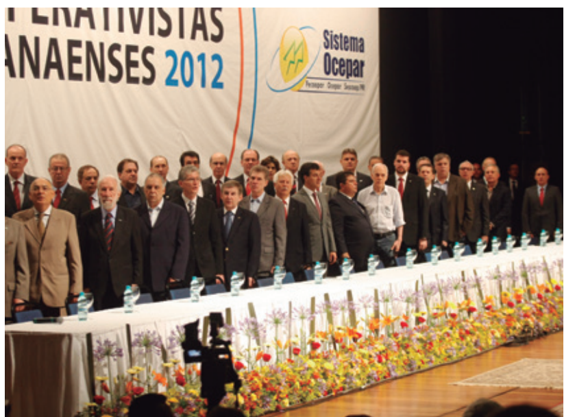
Mesa de Honra foi composta por diversas autoridades políticas, entidades parceiras e dirigentes

Programação - A programação do Encontro contemplou o pronunciamento de autoridades e homenagens, com a entrega do Troféu Cooperativas Orgulho do Paraná. O filósofo e doutor em Educação, Mario Sergio Cortella, ministrou a palestra com o tema “Qual é a tua obra? Inquietações propositivas sobre gestão, liderança e ética”. Houve ainda a apresentação dos resultados da Campanha “Você sabia?”, desenvolvida pela juventude paranaense cooperativista para celebrar o Ano Internacional das Cooperativas. Uma palestra show com a Família Lima animou a plateia. O evento foi encerrado com sorteio de brindes.