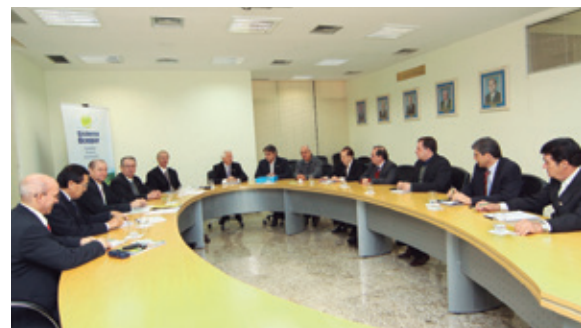
Planejar é fundamental, dizem líderes

Extraordinário - Segundo o dirigente, as projeções para o ano que se inicia também são positivas. “De acordo com o planejamento das nossas cooperativas, 2013 promete ser extraordinário também. A expectativa é que nós vamos continuar crescendo com mais 100 mil novos associados numa rede que, aqui no Paraná, está passando de 350 unidades de atendimento, a maior da área financeira no interior do Estado”, frisou.