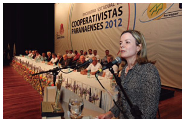
“É um orgulho muito grande receber essa homenagem”, disse Gleisi

Inspiração - Segundo Gleisi, o cooperativismo é um motivo de orgulho para os paranaenses. “O Paraná é o berço do cooperativismo e tem um dos melhores sistemas do Brasil, é uma referência. Muitas das ações que temos hoje no governo federal, Procap-Agro, Prodecoop, Procap-Crédito, Pronacope, foram inspiradas no movimento do Paraná. As medidas do governo na área de crédito, principalmente agrícola, são muitas vezes baseadas nas solicitações paranaenses”, concluiu.