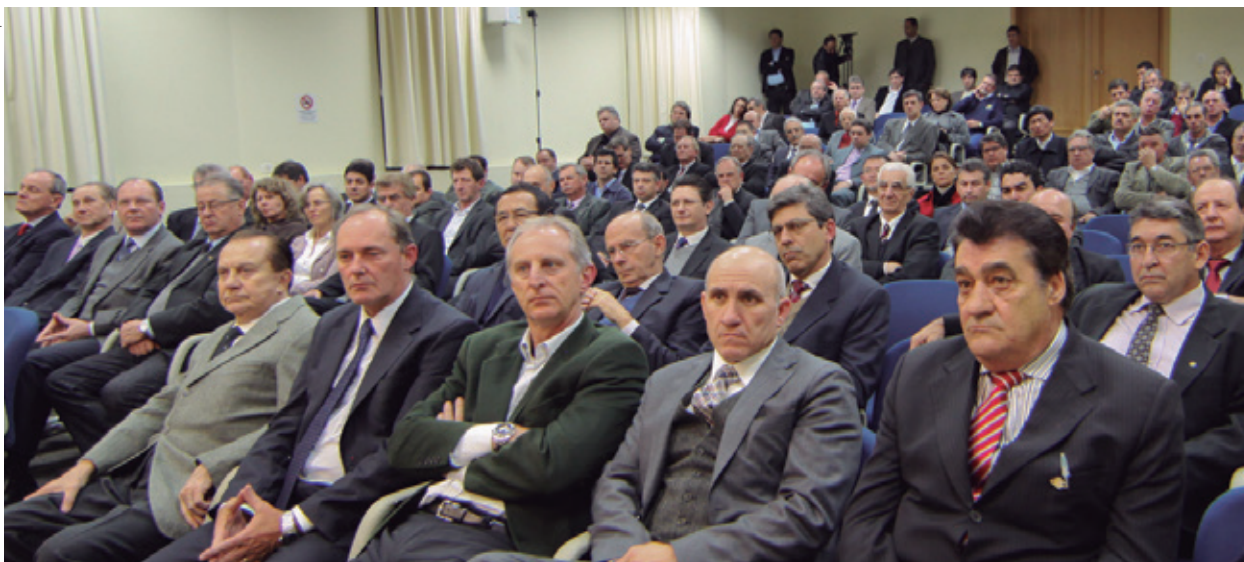
Participantes avaliaram que o evento contribuiu para gerar conhecimento e integrar o setor