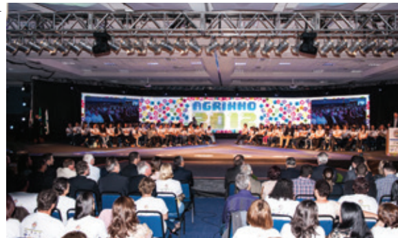
O Programa Agrinho é um modelo de educação e cidadania que atua em todos os municípios do Paraná atingindo 1,5 milhão de alunos e 80 mil professores

Mulher Atual - O Programa Mulher Atual é focado no desenvolvimento humano, social, econômico e político da mulher. Com conteúdo diferenciado, onde são abordados aspectos culturais, emocionais, sociais e profissionais, o curso promove um despertar diferenciado mostrando para a mulher do campo que ela pode fazer a diferença na administração da propriedade em relação à gestão, à parte operacional e à tecnologia.