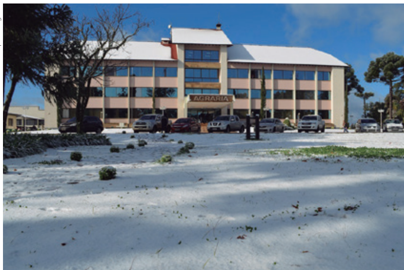
Sede da cooperativa Agrária em Entre Rios, Guarapuava no dia 23 de julho

de 75% está em fase de maturação, portanto deve escapar dos efeitos da geada. Porém, cerca de 25% da área em campo, que corresponde a 387 mil hectares estão com lavouras em fase de frutificação, período mais suscetível às quedas drásticas da temperatura. Essas lavouras se concentram na região Norte.