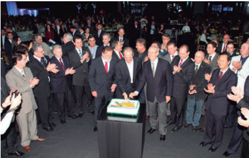
Festa do cinquentenário aconteceu no pavilhão Azul, do Parque Internacional de Exposições, com cerca de 1,4 mil convidados