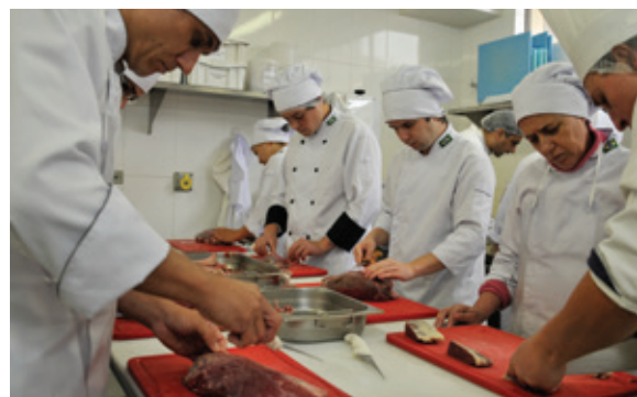
Curso de Cozinheiro, gratuito, realizado em Curitiba