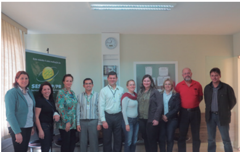
Dirigentes da Coopermundi, Cefi, Colégio Cooperativo da Lapa e Ceacemp, juntamente com representantes do SESCOOP/PR, discutem as demandas do ramo educacional