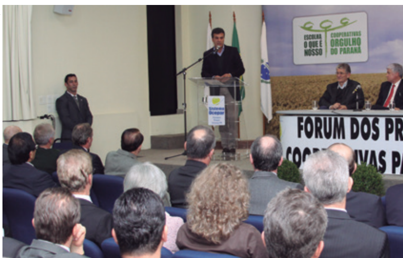
Governador Beto Richa participou do Fórum de Presidentes pelo terceiro ano consecutivo