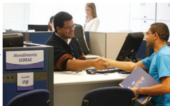
Micro e pequenas empresas encontram no Sebrae a solução que procuram em diversas linhas de ação

tações técnicas; e seis mil palestras, cursos, oficinas e seminários.