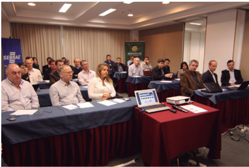
Participantes durante a abertura da quinta turma da Formação Internacional apoiada pelo Sescoop/PR e Sebrae/PR