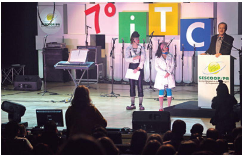
Evento comemorou o Dia Internacional do Cooperativismo

importância para a expansão do emprego e das oportunidades de negócios no estado. “As 238 cooperativas ligadas ao Sistema Ocepar integram mais de 900 mil cooperados, geram 70 mil empregos diretos e, em 2013, a expectativa é de que alcancem movimentação econômica de R$ 40 bilhões. No Paraná, mais de 1,5 milhão de pessoas dependem do cooperativismo. Em 2013, vamos investir mais de R$ 30 milhões em 6 mil eventos de capacitação e treinamento de colaboradores e cooperados. Por isso, nesse Dia Internacional do Cooperativismo, é um momento de reflexão e conagração da família cooperativista”, concluiu.