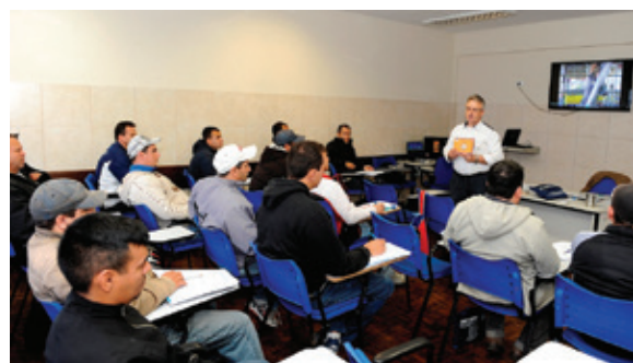
Senat oferta os cursos exigidos aos motoristas profissionais pelo Conselho Nacional de Trânsito

Outra ação de destaque é o Programa Motorista Profissional, desenvolvido em parceria com a Volvo do Brasil e da Librelato. O objetivo é preparar o motorista profissional para utilizar a tecnologia embarcada como aliada em resultados de condução econômica e direção defensiva. Com a orientação do instrutor e aulas teóricas e práticas individuais, o aluno passa a utilizar a tecnologia a favor da economia de diesel e da preservação dos componentes do veículo, além de aprender a preservar o meio ambiente.