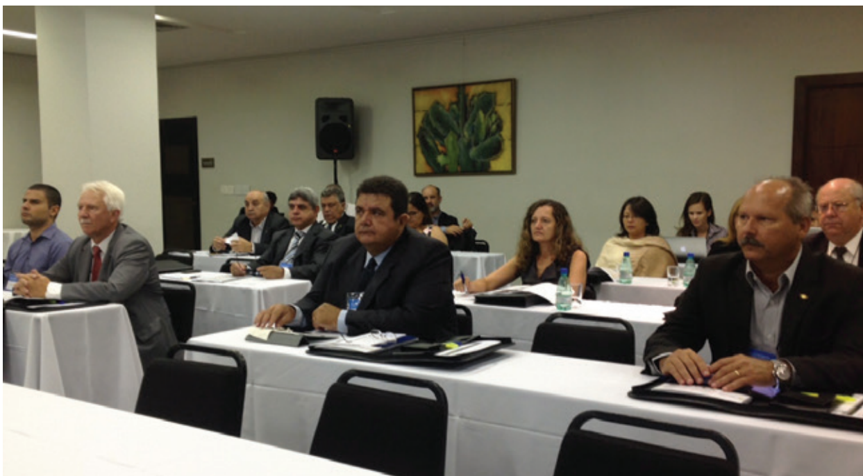
Oficina de Planejamento, realizada em janeiro, reuniu membros da Diretoria Executiva e dos Conselhos de Administração, superintendentes de OCEs e representantes das gerências gerais e áreas finalísticas da OCB

O Sistema OCB está se preparando para colocar em prática, a partir do ano que vem, o Plano Estratégico para o período 2015-2020, contemplando diretrizes e estratégias para as três entidades que integram o sistema: a Organização das Cooperativas Brasileiras (OCB), o Serviço Nacional de Aprendizagem do Cooperativismo (Sescoop) e a Confederação Nacional das Cooperativas (CNCoop).