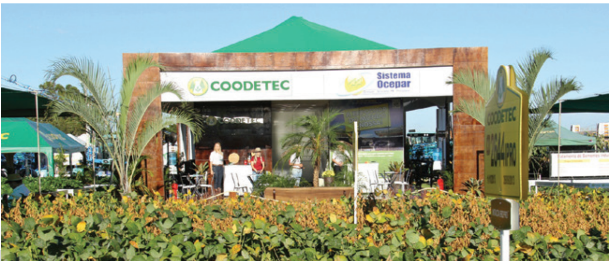
Sistema Ocepar e Coodetec, parceria pelo quinto ano consecutivo