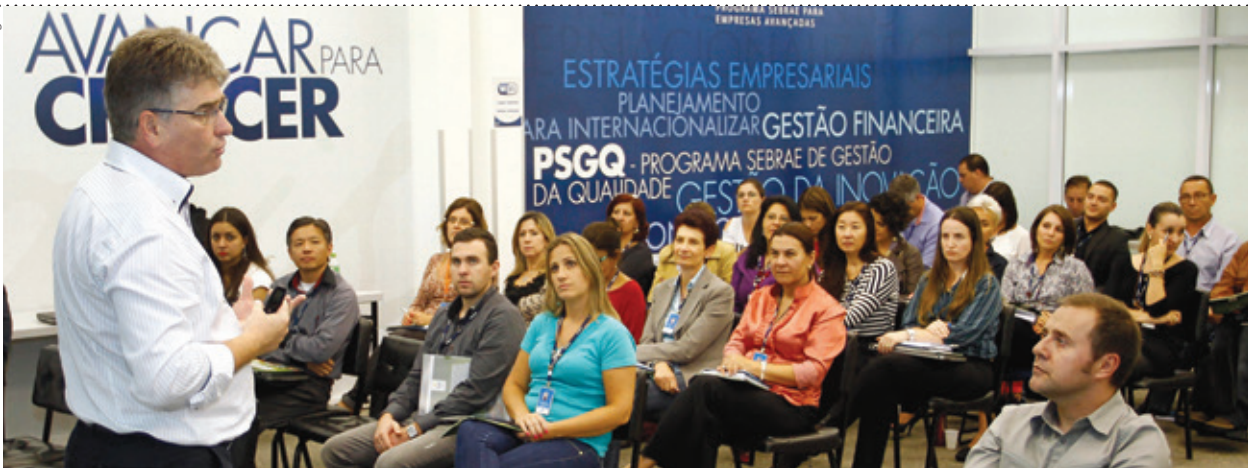
A última capacitação sobre cooperativismo foi realizada no dia 18 de fevereiro, em Curitiba. Os funcionários do Sebrae/PR das regiões de Londrina e Maringá também já passaram pelo treinamento