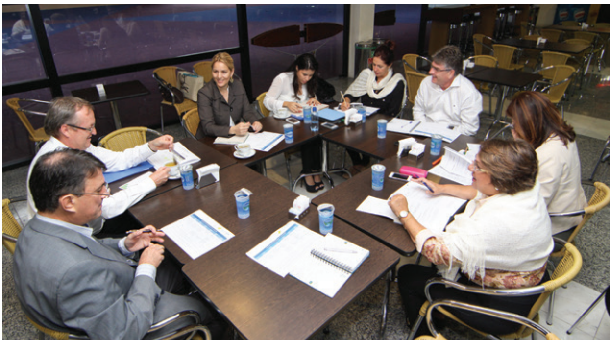
Reunião aconteceu em Curitiba, na Expo Unimed

Organização da Feira Mundial do Cooperativismo, que será realizada em Curitiba no mês de maio, reúne-se para ajustar os últimos detalhes do evento