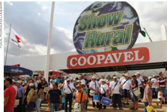
A movimentação financeira superou a marca de R$ 2 bilhões, ultrapassando o volume de 2013, que foi de R$ 1,6 bilhão

um espaço maior do que individualmente. Para isso, também contamos com o apoio da diretoria da Coopavel”, lembra ele. Ele também ressalta a parceria com a Cocamar, que tem fornecido sucos Purity e com a Unimed Cascavel, com a realização de palestras e exames.