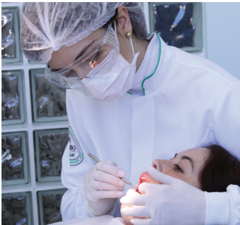
Investimento forte em formação tem feito a diferença. Uniodonto Curitiba é hoje líder no mercado de serviços odontológicos no Paraná

As 33 cooperativas do ramo saúde fecharam o ano de 2013 com mais de 2 milhões de beneficiários em todo o Paraná. Forma-