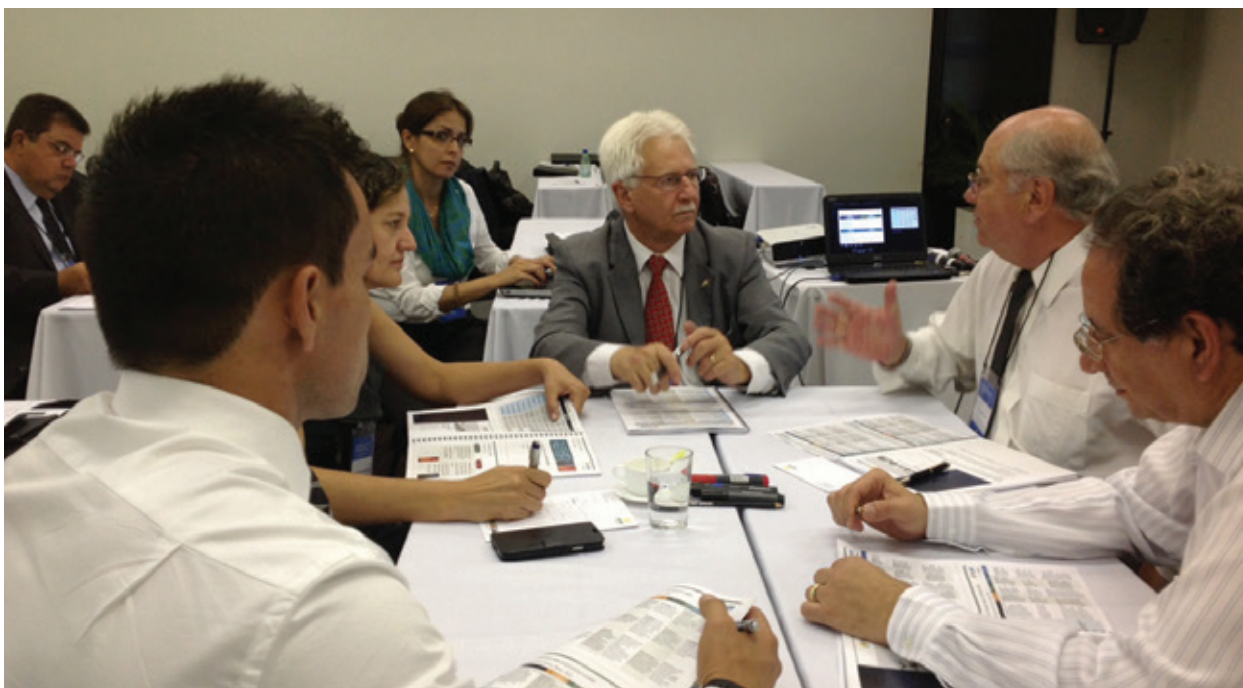
Participantes discutiram oportunidades e ameaças, além dos desafios estratégicos do cooperativismo para os próximos anos