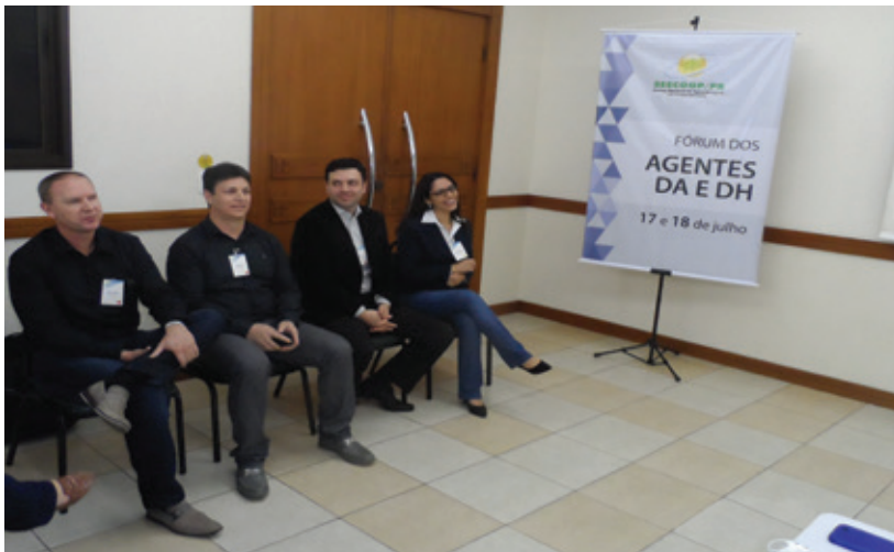
Representantes da Batavo, Copacol, Sicredi Vale do Piquiri ABCD PR/SP e Unimed Londrina. Apresentação de cases com foco na utilização dos indicadores