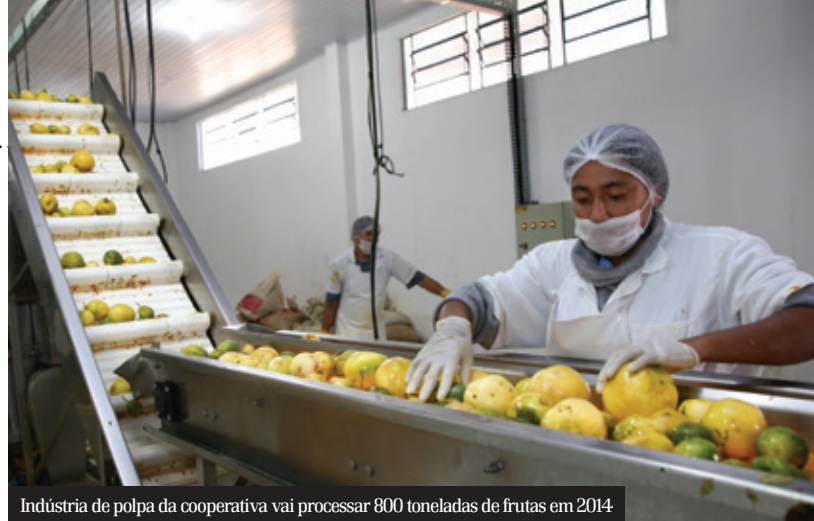
Indústria de polpa da cooperativa vai processar 800 toneladas de frutas em 2014

Corumbataí perdeu cerca de 20% de sua população de 4.900 habitantes.