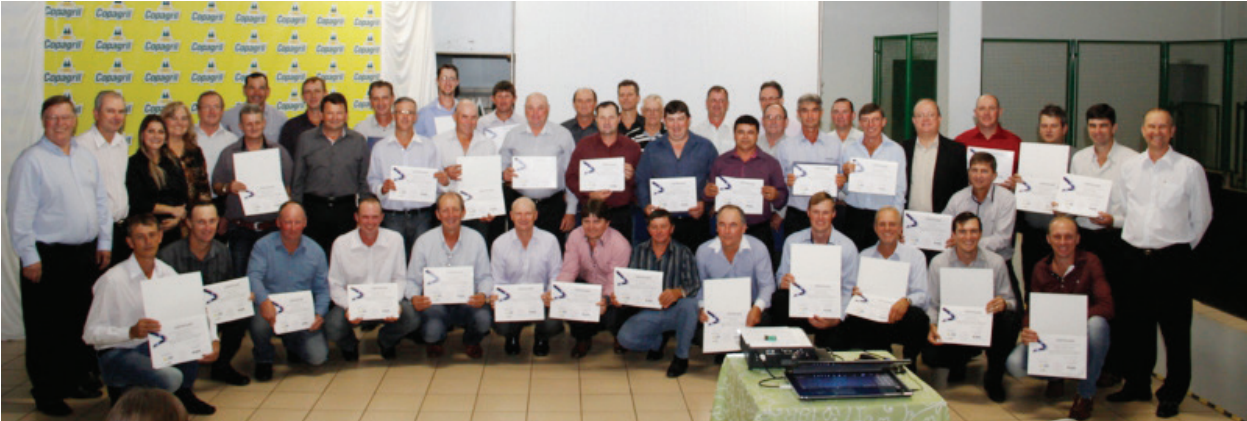
Ao todo, a Copagril formou 40 conselheiros. Iniciativa prepara os associados para a função