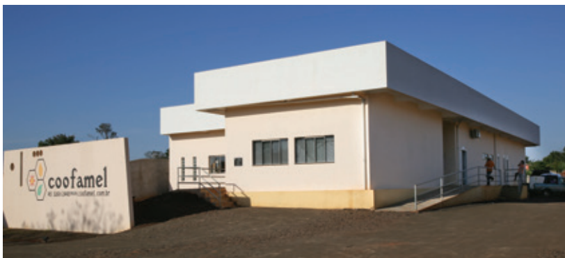
Sede da cooperativa em Santa Helena: investimento de R$ 1,3 milhão possibilitará lançamento de pelo menos oito produtos