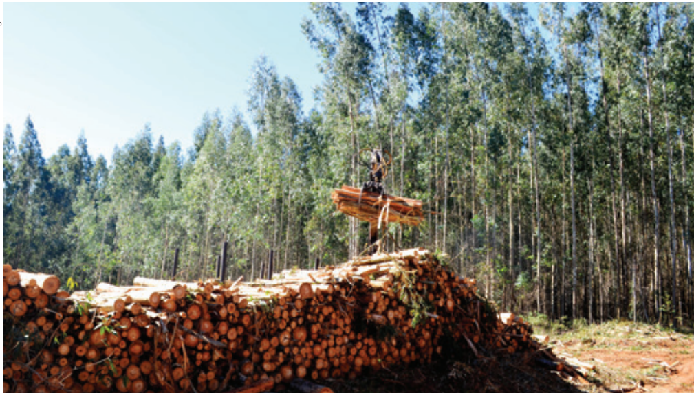
Madeira de reflorestamento da Agrária é usada na secagem de grãos. Prática levou a cooperativa a reduzir a praticamente zero o consumo de óleo BPF (combustível fóssil não renovável)

primeiro momento, um diagnóstico para identificar as oportunidades de melhoria desse segmento. “A cooperativa já vinha realizando ações, com o intuito de melhorar sua forma de trabalho e dando mais ênfase na área ambiental. Avaliou-se, então, que era o momento de fazer o trabalho de forma estruturada, iniciando de fato o Sistema de Gestão Ambiental da Cocamar, com base na NBR ISO 14.001”, conta Eliane.