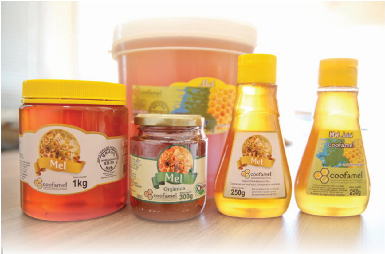
Cooperativa comercializa 13 itens de mel, além de melado e açúcar mascavo. Próximo passo será atuar também com intensidade na produção de hortifrutigranjeiros

sileiro, alegando falta de controle de resíduos biológicos. “Centenas de produtores ficaram com mel estocado, sem mercado. Os atravessadores apareceram oferecendo valores irrisórios pelo produto. Foi então que as associações e grupos organizados de apicultores decidiram se reunir para encontrar uma saída e comercializar os es-