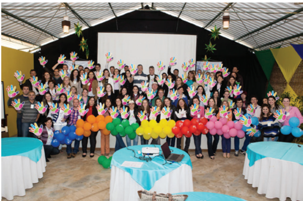
Lançamento do Dia C no Paraná aconteceu durante o Fórum de Agentes de Da e DH, em Cornélio Procópio