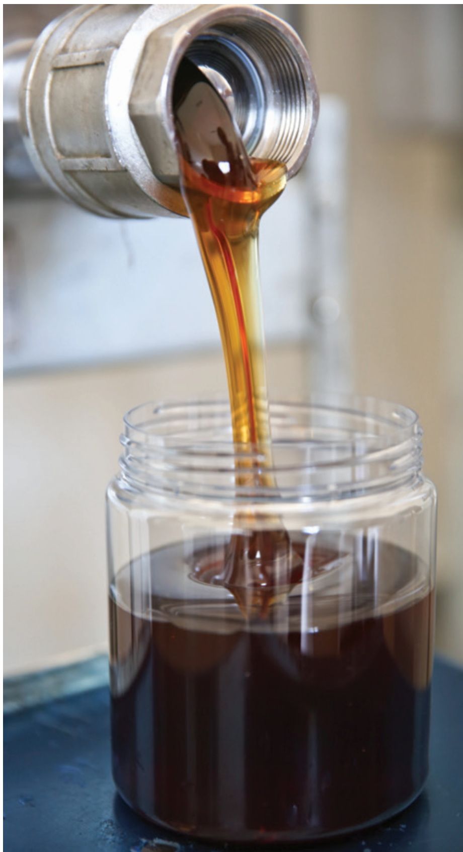
Observando questões de qualidade e sanidade, Coofamel pretende ampliar a produtividade de seus cooperados

Investimentos – A Coofamel está concretizando o mais alto investimento de sua história. Em abril de 2012, a nova sede da cooperativa foi inaugurada, com apoio da prefeitura de Santa Helena. Por sua vez, o suporte da Itaipu Binacional abriu caminhos para um financiamento de R$ 700 mil do BNDES (Banco Nacional de Desenvolvimento Econômico e Social). “No total, o projeto industrial terá aportes de R$ 1,3 milhão, incluindo construção da estrutura – já finalizada - e a compra de equipamentos. Até setembro as instalações deverão estar aptas, adequando também essa unidade para o SIF (Serviço de Inspeção Federal). Vamos ampliar nossa linha de produtos, com oito novos itens, incluindo mel em embalagem blister, destinado a hotéis e que tem alto valor agregado”, explica. Segundo o dirigente, estudos indicam que a região tem capacidade para produzir 1 milhão de quilos de mel, muito acima dos 300 mil quilos produzidos pela cooperativa atualmente. “Observando questões de qualidade e sanidade, e investindo em assistência técnica, pretendemos ampliar o número de cooperados, melhorando nossa produtividade”, enfatiza.