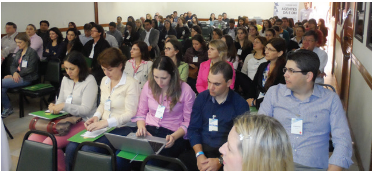
Agentes de Desenvolvimento Humano (DH) e de Desenvolvimento e Autogestão (DA): dois dias de discussões em torno dos indicadores de Recursos Humanos, Desenvolvimento Humano, Autogestão e Promoção Social