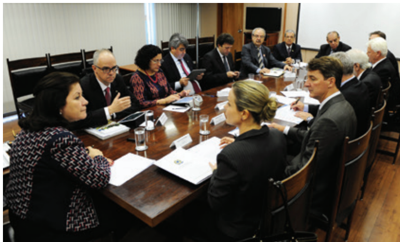
Paranaenses com a ministra Miriam Belchior