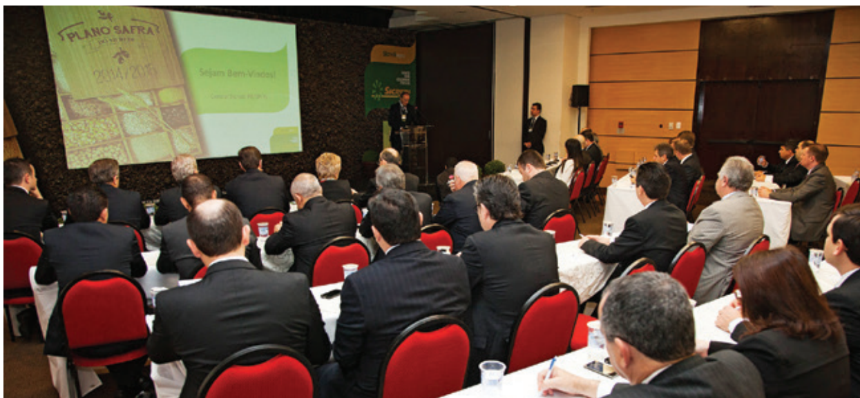
Lançamento do plano aconteceu no dia 15 de julho, em Curitiba