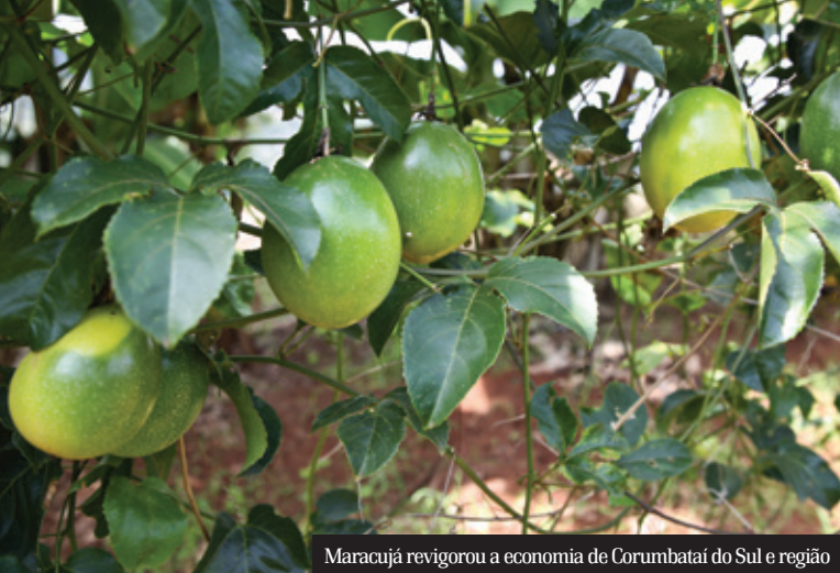
Maracujá revigorou a economia de Corumbataí do Sul e região