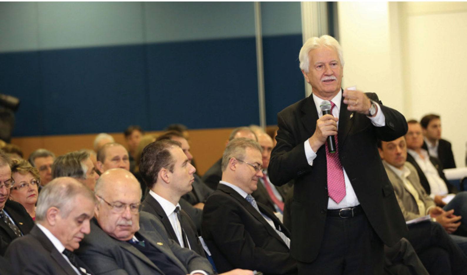
Representantes da sociedade organizada questionaram os candidatos sobre as propostas para o desenvolvimento do Paraná

al governador, dizendo que o Paraná deixou de receber empréstimos federais porque não cumpriu impositivos legais, como a Lei de Responsabilidade Fiscal e a aplicação obrigatória de recursos. “Se não tivermos empréstimos federais liberados para o estado, foi em função destes dois quesitos. Fizemos de tudo para ajudar, mas não temos como vir aqui para reduzir os gastos com pessoal ou fazer o estado aplicar 12% do seu orçamento em saúde, como obriga a lei”, disse.