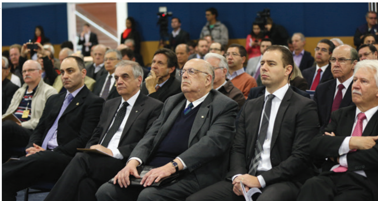
Convidados das 16 entidades que integram o Fórum acompanharam o encontro com candidatos. O cooperativismo esteve representado pelo Sistema Ocepar e por dirigentes de cooperativas

A disputa eleitoral para governador no Paraná teve um capítulo importante no mês de agosto. Pela primeira vez, Roberto Requião (PMDB), Gleisi Hoffmann (PT) e Beto Richa (PSDB), que lideram as intenções de votos no estado, compareceram num mesmo evento, a fim de apresentar suas propostas e serem sabatinados sobre o que farão nas áreas de educação, infraestrutura, gestão pública e inovação. A iniciativa de reunir os três candidatos foi do Fórum Permanente Futuro 10 que, na ocasião, entregou a cada um deles um documento relacionando os gargalos para o desenvolvimento do Paraná e sugerindo uma série de ações que podem trazer melhorias para o estado.