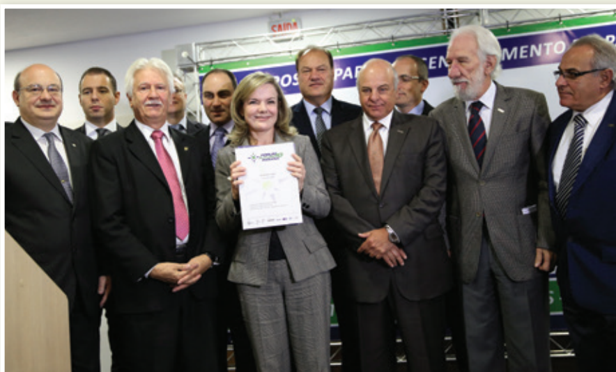
Gleisi Hoffmann: adoção de gestão moderna para o estado ter equilíbrio econômico