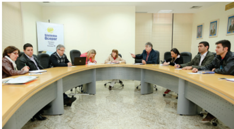
Reunião preparatória para o evento foi realizada dia 19 de agosto, na sede do Sistema Ocepar, em Curitiba

prol do voluntariado. Ações dos mais variados tipos, tamanhos e complexidade estão sendo incentivadas, com o intuito de espalhar o bem entre as pessoas. O projeto nasceu em 2009, a partir de uma iniciativa do Sistema Ocemg (Organização das Cooperativas do Estado de Minas Gerais). Os bons resultados motivaram a Organização das Cooperativas Brasileiras (OCB) a ampliar a campanha para todo o país. Em 2014, o Dia C deverá ser realizado em 24 estados e beneficiar mais de um milhão de pessoas no Brasil.