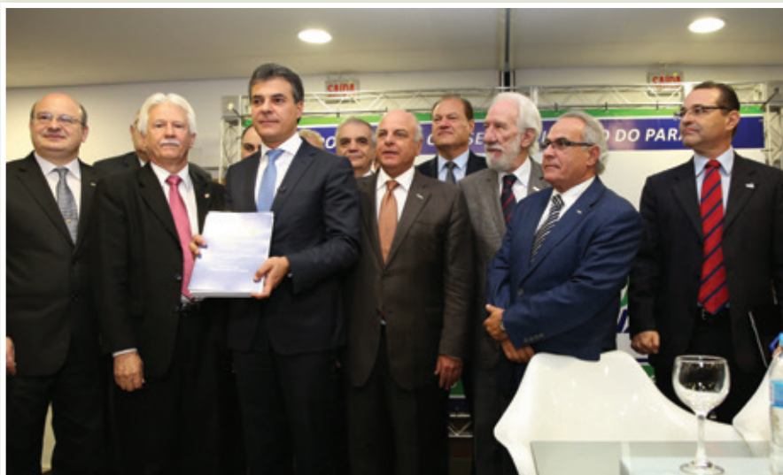
Beto Richa: diálogo e respeito às pessoas, trazendo a sociedade junto do governo