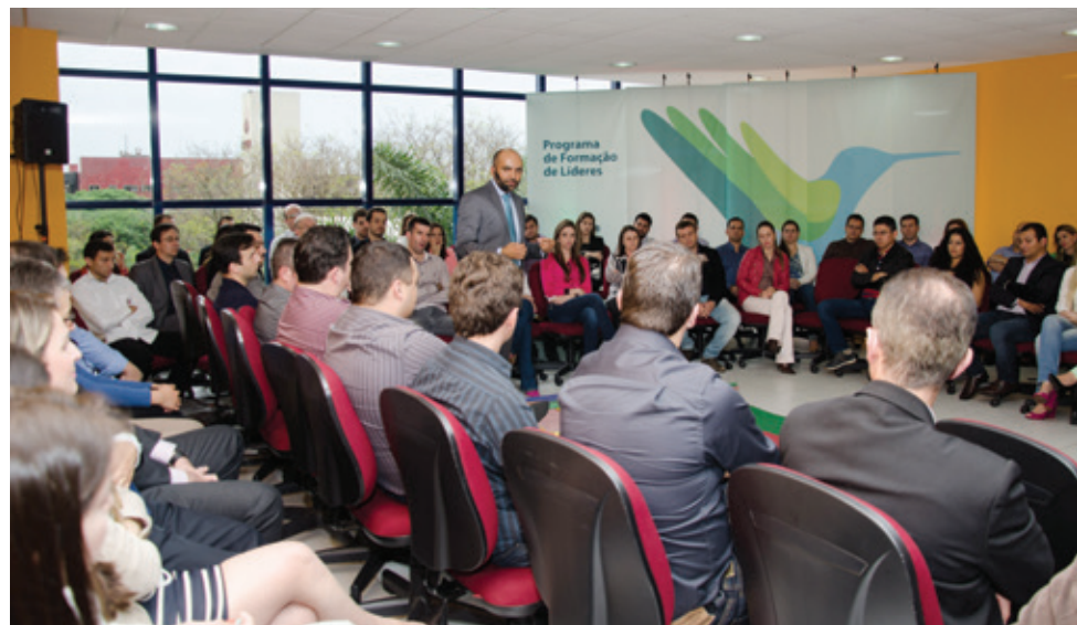
Cento e vinte colaboradores foram selecionados para participar da primeira turma

Para assegurar a qualidade das atividades, os professores da PUCPR fizeram uma imersão de três dias no Sistema Sicoob PR, conhecendo o cooperativismo em visitas à Central PR, algumas cooperativas e agências, e realizando entrevistas. 🍌