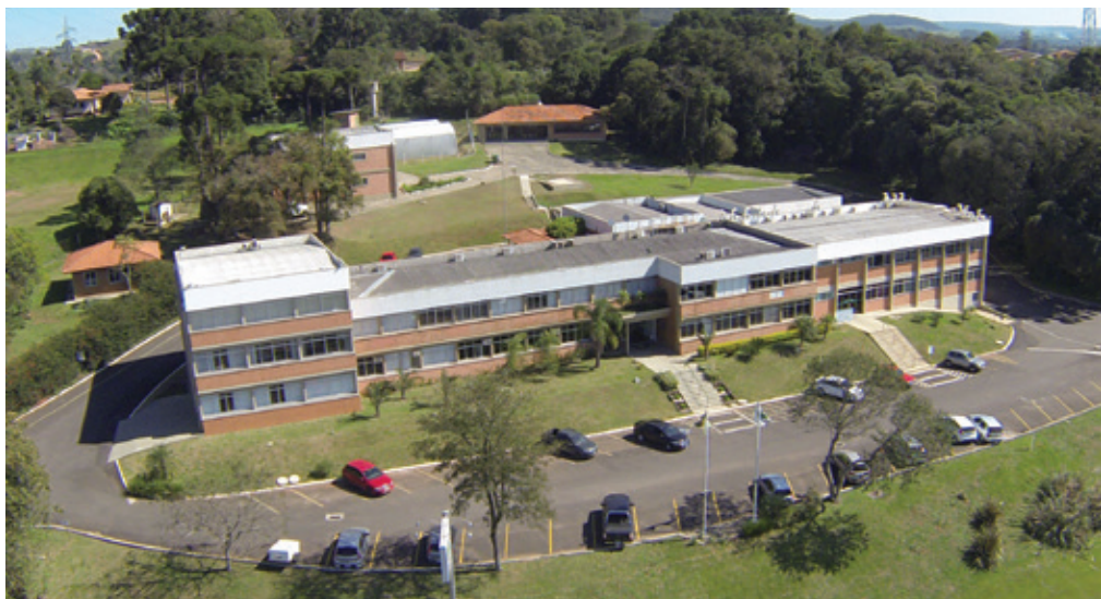
Sede da Fundação ABC, em Castro (PR): estudos, cursos, simpósios e dias de campo com o foco na melhoria da produtividade agrícola