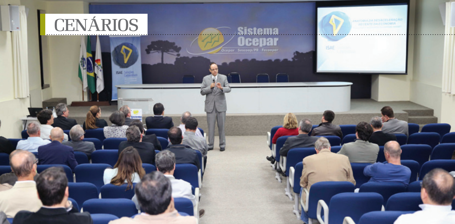
Diretores, gerentes e analistas das áreas financeira e comercial das cooperativas paranaenses no Fórum Financeiro e de Mercado. Informações ajudam a entender o contexto e direcionam a tomada de decisões