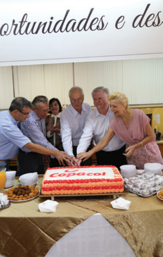
Comemoração dos 51 anos da Copacol, em Cafelândia, Oeste do Paraná. Momento para refletir sobre a atuação e metas da cooperativa

Pautada numa estratégia que alia a prática da doutrina cooperativista a uma visão moderna de governança, a Copacol chega aos 51 anos com um faturamento superior a R$ 2 bilhões - registrados em 2013 -, e mais de 5 mil associados e 8 mil colaboradores. A diversificação e industrialização são pontos fortes da cooperativa que, além de estar presente no mercado interno, com a inserção de seus produtos nas gôndolas dos supermercados brasileiros, exporta seus para mais de 40 países. Mas não são apenas os números que colocam a Copacol na lista das cooperativas com maior destaque no país.