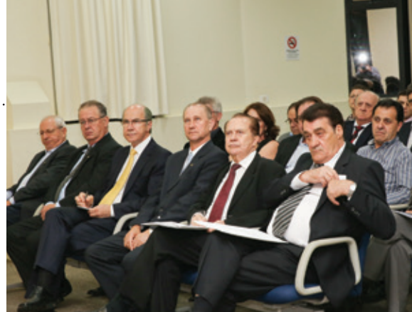
Dirigentes cooperativistas acompanharam palestras sobre os cenários políticos e econômicos do país

Mudanças - De acordo com ele, entre as mudanças perceptíveis e já concretizadas estão a falência da utopia comunista; a impossibilidade do modelo populista; o fim da era dos grandes líderes; o fato de que o capitalismo jamais será o mesmo; a fragmentação dos partidos políticos; a existência de