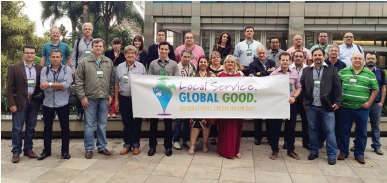
Visita de jornalistas ao Centro Administrativo do Sicredi, em Porto Alegre, fez parte das comemorações

Celebrado na terceira quinta-feira de outubro, o Dia Internacional do Cooperativismo de Crédito (DICC / ICUDay, em inglês) é promovido pelo Conselho Mundial de Cooperativas de Crédito (World Council of Credit Unions - Woccu) para divulgar o trabalho desenvolvido pelas cooperativas de crédito, aumentando a conscientização sobre sua importância econômica e social e, consequentemente, o apoio ao movimento cooperativo. Em 2014, a comemoração aconteceu no dia 16 com o tema "Serviço local, bem global".