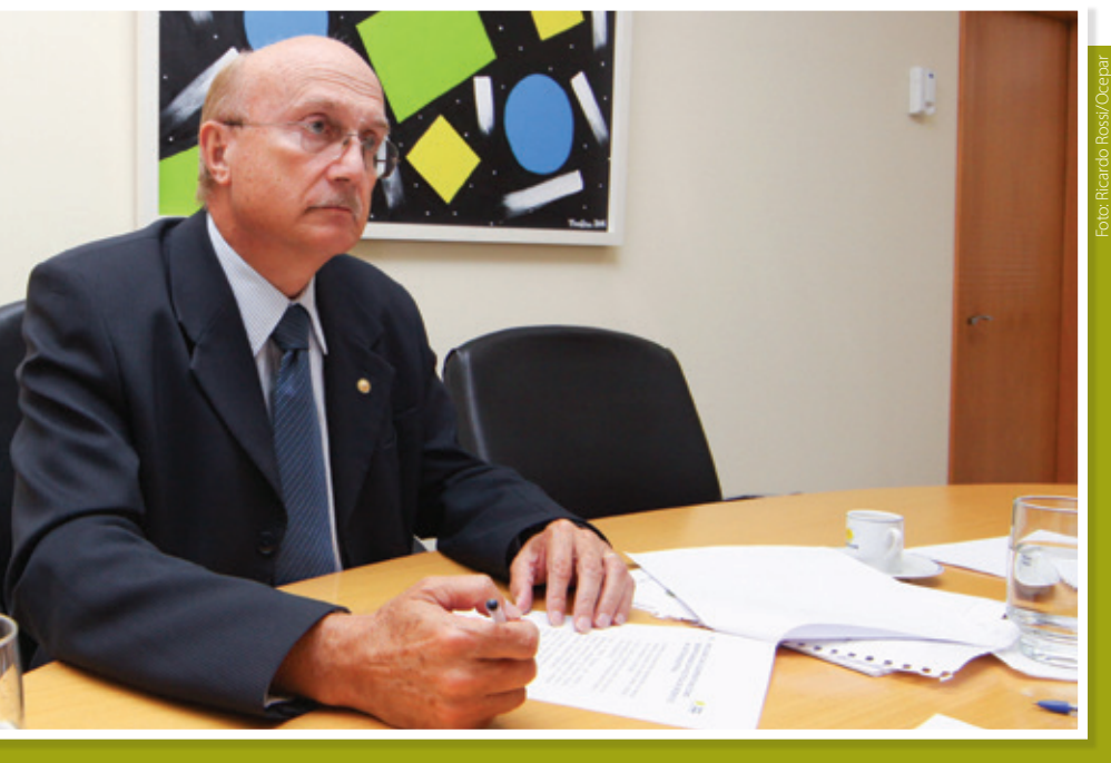
Deputado Osmar Serraglio: Frente Parlamentar deve planejar com critérios atuação da bancada na nova legislatura

Corrupção – Para o parlamentar, a corrupção é o grande desafio a ser vencido no Brasil. “No passado, convivíamos com uma inflação altíssima e considerávamos normal. Com o Plano Real vencemos a hiperinflação e o povo percebeu o que era uma nação com estabilidade na moeda. Um dia, o mesmo acontecerá em relação à corrupção e aos bilhões que são desviados e fazem falta na saúde, na educação, infraestrutura e geração de empregos. Quando vencermos a corrupção será uma verdadeira revolução para o Brasil”, conclui Serraglio.