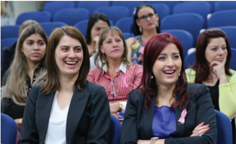
Secretárias acompanharam palestra sobre a neurociência direcionada para a atividade profissional, desenvolvendo a atitude de liderança