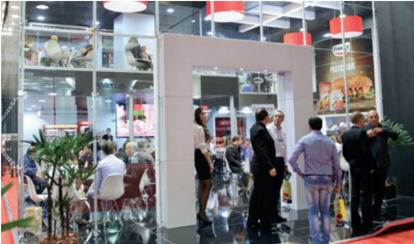
Frimesa expôs seus lançamentos e mudanças na identidade visual de algumas embalagens