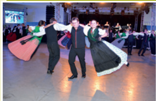
A Agrária investe em educação e na preservação da cultura, no Colégio Imperatriz Dona Leopoldina e na Fundação Cultural Suábio-Brasileira

A Agrária está localizada no distrito de Entre Rios, em Guarapuava (PR). Estabelecida na década de 1950, alia tradição e história à tecnologia e gestão de excelência. A partir da agricultura, a Agrária instituiu cadeias produtivas completas, que compreendem desde pesquisa agrícola, realizada pela Fapa (Fundação Agrária de Pesquisa Agropecuária) até a industrialização. A Agrária investe ainda em educação, na preservação da cultura e na saúde de toda a comunidade, investindo no Colégio Imperatriz Dona Leopoldina, Fundação Cultural Suábio-Brasileira e Hospital e Farmácia Semmelweis.