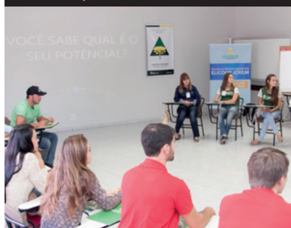
Dinâmicas e discussões sobre o papel e o potencial de cada um