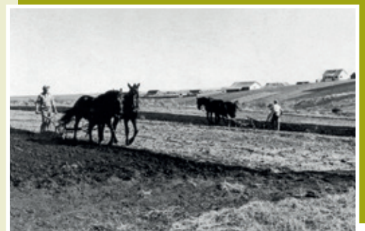
Cooperados na lida no campo na década de 1950