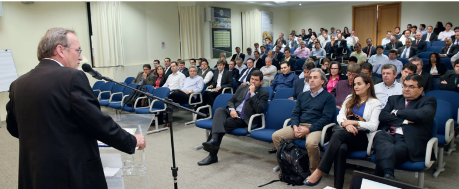
Fórum de Finanças, no auditório do Sistema Ocepar. Presença de mais de 100 representantes de cooperativas e de instituições financeiras