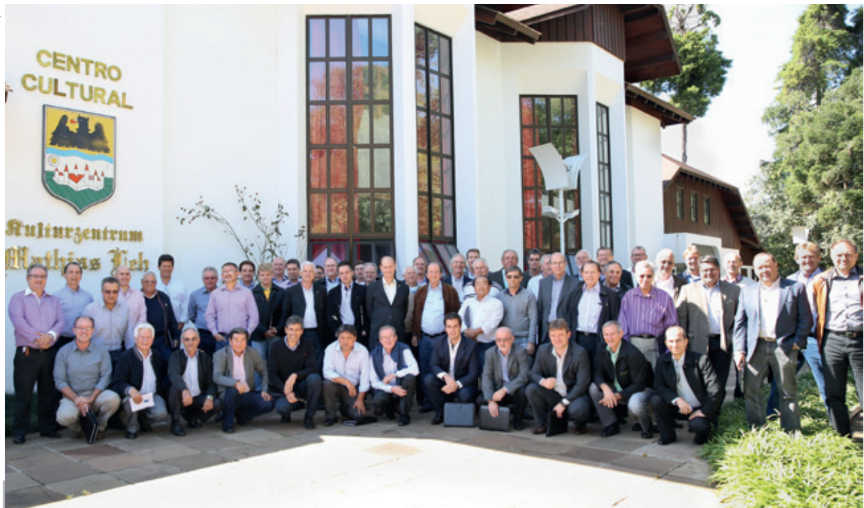
Presidentes e diretores de 33 cooperativas participaram do evento