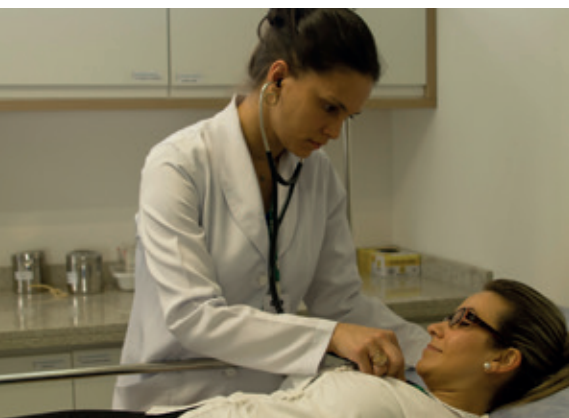
Mais de 7 mil atendimentos já foram realizados, entre consultas e outros procedimentos