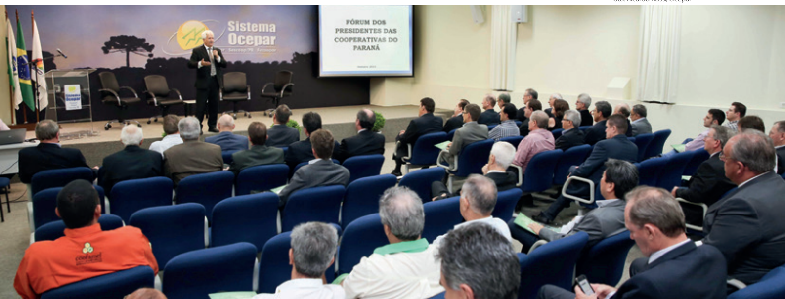
Fórum dos Presidentes deixa Curitiba e acontecerá sempre na sede de uma cooperativa anfitriã, que detalhará aos participantes seu modelo de gestão