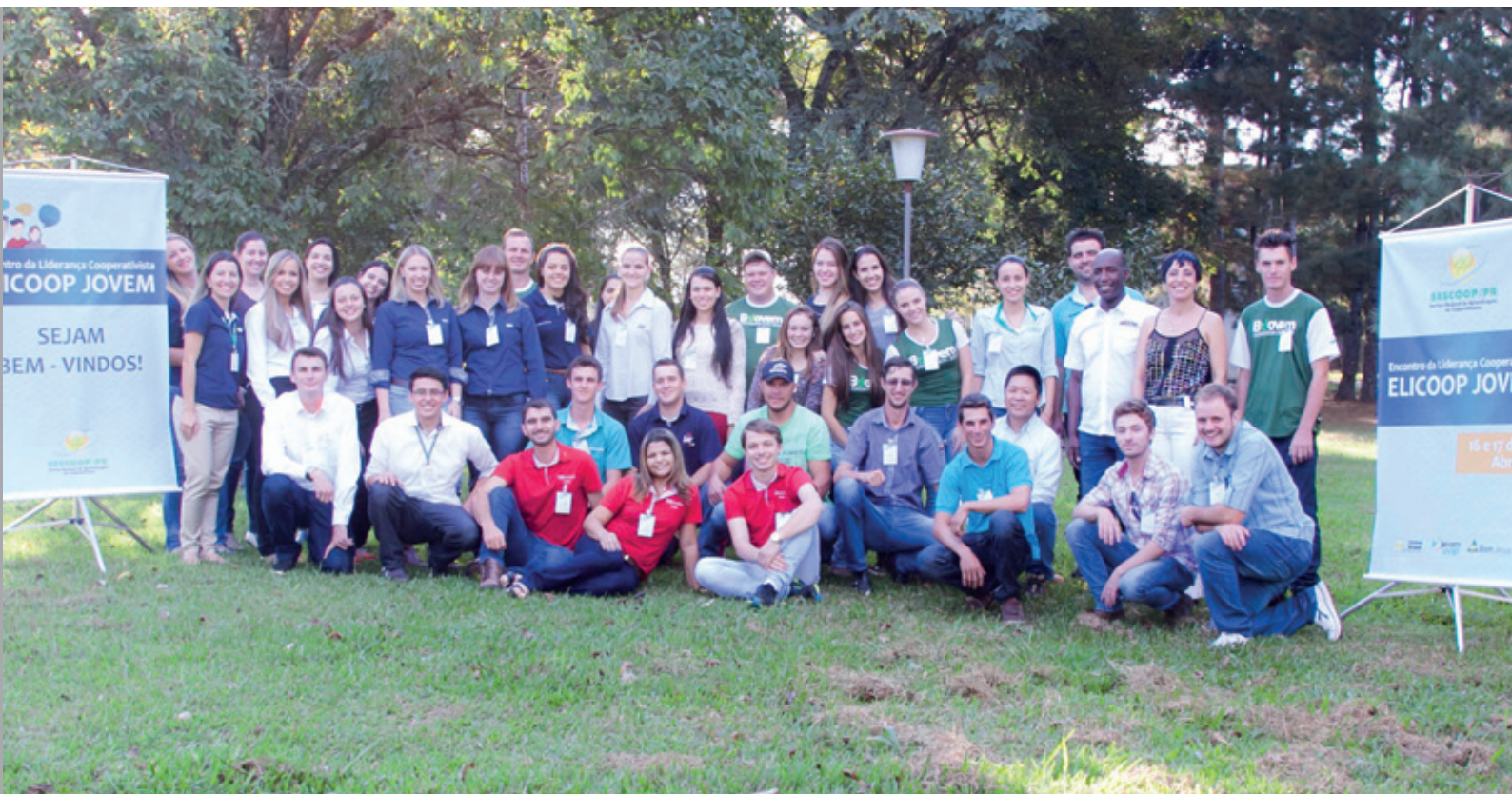
Participantes do Elicoop: momento para refletir e estruturar o principal evento da juventude cooperativista do estado