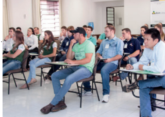
34 jovens, de diferentes regiões do estado, reunidos no Elicoop 2015