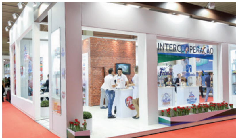
Intercoperação: Castrolanda, Batavo e Capal dividiram o mesmo estande

No encerramento do evento, a Frimesa recebeu cinco premiações, resultado do trabalho feito junto ao setor durante o ano, sendo três de Melhor Fornecedor nas categorias Mercearia Doce, Percíveis Lácteos e Carnes; um de Fidelidade Mercosuper – por sempre estar entre as mais lembradas e apoiar o evento; além do título de Fornecedor Nota 10, premiação máxima da feira. As premiações, promovidas pela Apras são o resultado de uma pesquisa realizada junto ao setor supermercadista de todo o Paraná, embasada em metodologias e critérios criados pelo Instituto Nielsen. 🍌