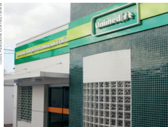
Centro Médico de Atenção Personalizada à Saúde foi inaugurado há um ano em Curitiba

pessoas apresentando-se como um verdadeiro plano de saúde e não como um simples plano de atendimento à doença.