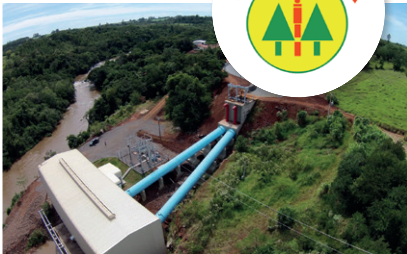
PCH Moinho, no distrito de Novo Três Passos, terá capacidade para produzir 3,7 MW