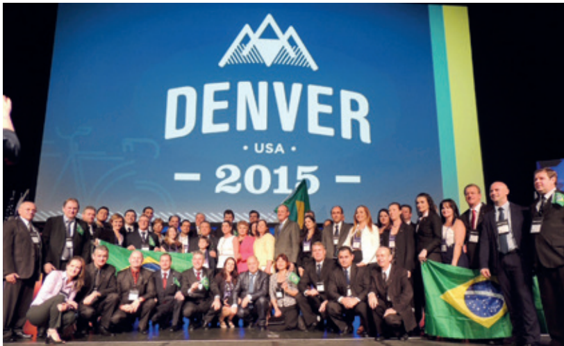
Sicredi participou da Conferência da Woccu com delegação de 96 pessoas