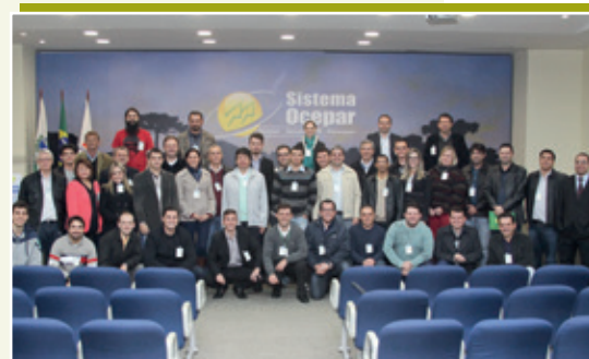
Participantes do VI Fórum: Sistema Ocepar realizou pesquisa on-line para conhecer o nível de preparo dos profissionais e as ferramentas que usam dentro das cooperativas

equilibrada, cursos por áreas de atuação.” Por isso, durante o fórum foram lançadas duas turmas de pós-graduação em Gestão de T.I para Londrina e Curitiba, que devem se iniciar em setembro.