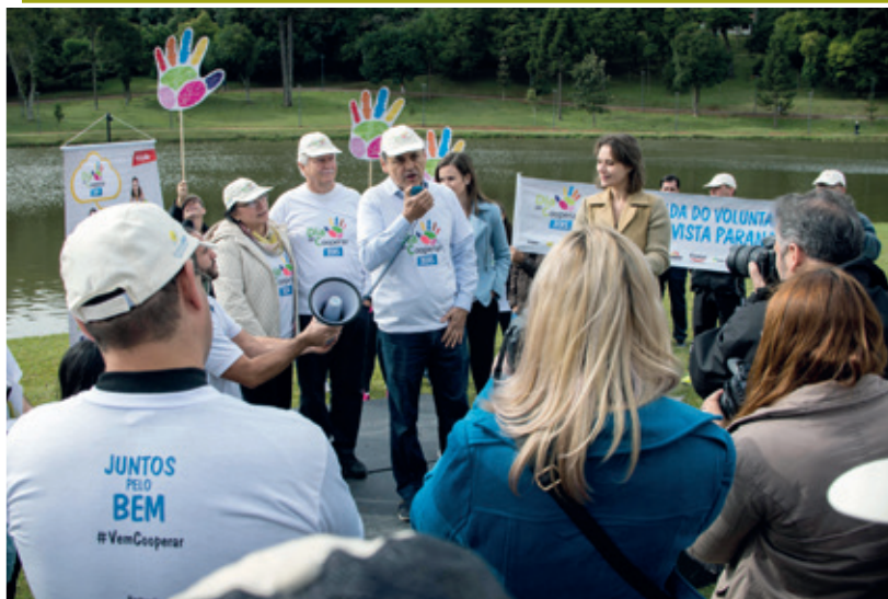
O prefeito de Curitiba, Gustavo Fruet, participou da 1ª Caminhada do Voluntariado Cooperativista Paranaense

Programação - Além de caminhar pelo parque, os participantes puderam desfrutar de outras atividades realizadas com apoio das cooperativas, como avaliação odontológica, aferição da pressão arterial, orientação sobre nutrição infantil e câncer de mama, conscientização ambiental, entre outras. Foi ainda organizada uma recreação infantil, com a Trip Circo, que animou as crianças com arte circense e pintura no rosto. Já os artistas Susi Monte Serrat e