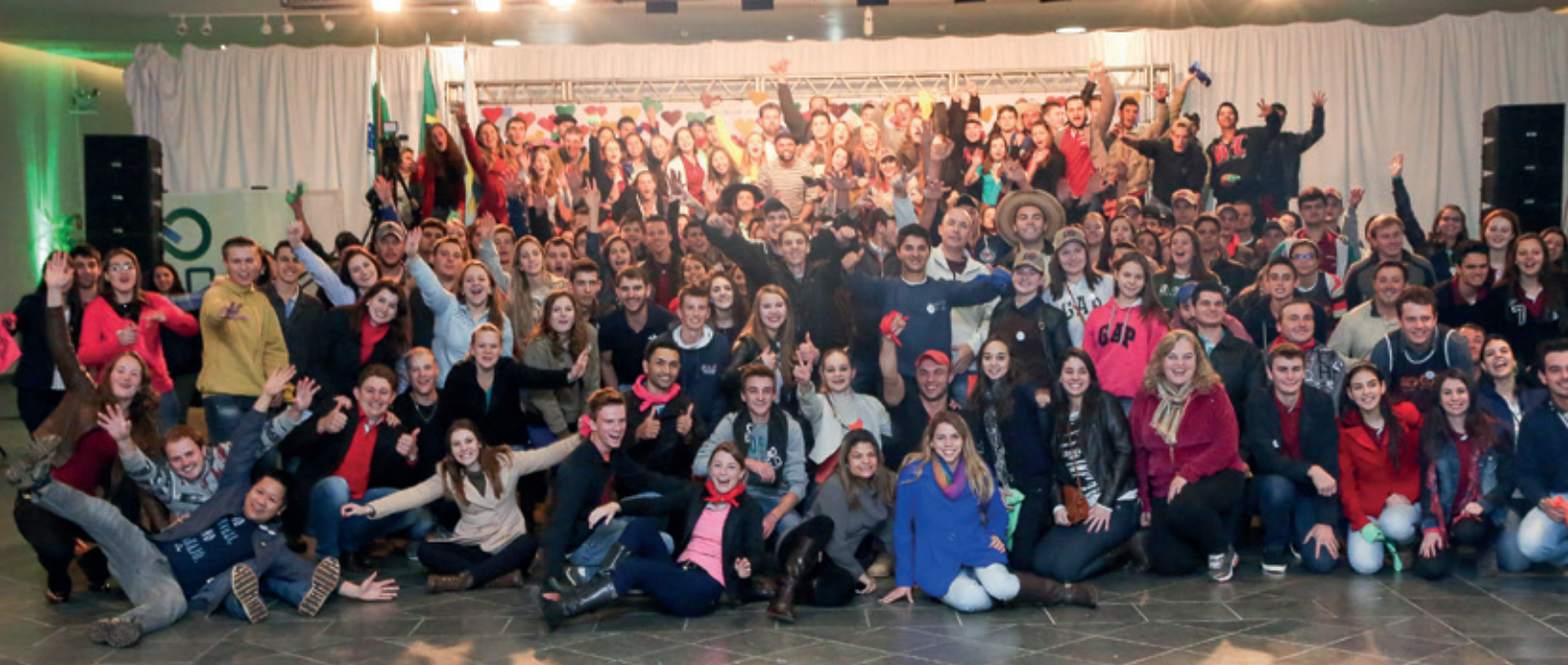
Evento reuniu jovens líderes de 11 cooperativas