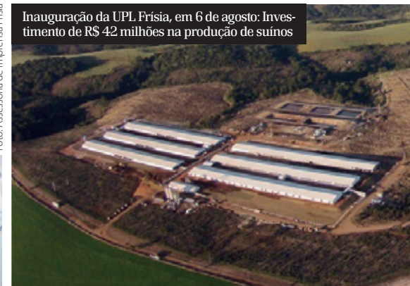
Inauguração da UPL Frísia, em 6 de agosto: Investimento de R$ 42 milhões na produção de suínos