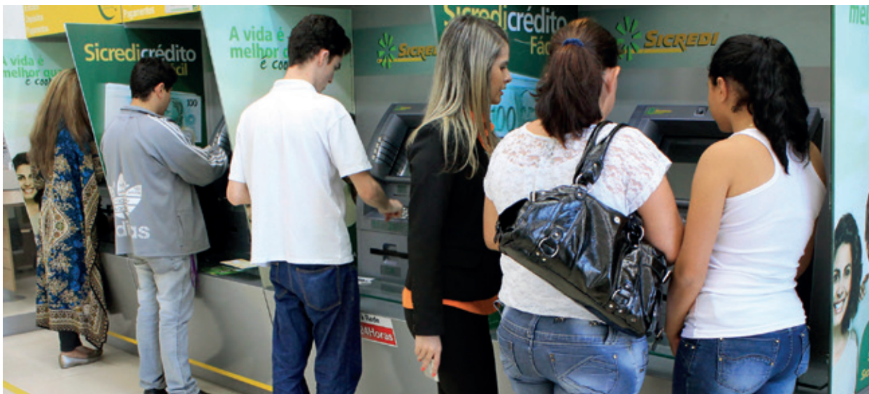
As cooperativas de crédito contabilizam aumentos na receita em decorrência de diferenciais que ofertam aos associados

no Paraná e nove no estado de São Paulo, as cooperativas de crédito vivem bom momento devido ao relacionamento próximo que têm com os associados. “E isso reflete positivamente na comunidade, o que aumenta o número de sócios e, conseqüentemente, os depósitos também. O crédito tem crescido, mas não na proporção dos depósitos, porque as pessoas estão mais cautelosas devido às incertezas do momento”, esclarece.