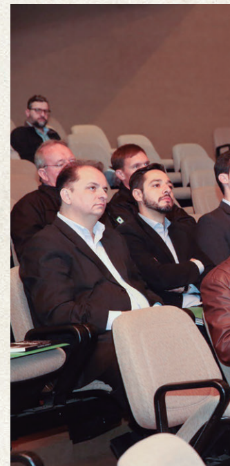
Cem cooperativistas das regiões norte e noroeste estiveram presentes no Encontro de Núcleos, no dia 27 de outubro, em Maringá. Havia representantes de sete cooperativas agropecuárias, cinco de crédito, quatro de saúde, uma do trabalho e uma de transporte