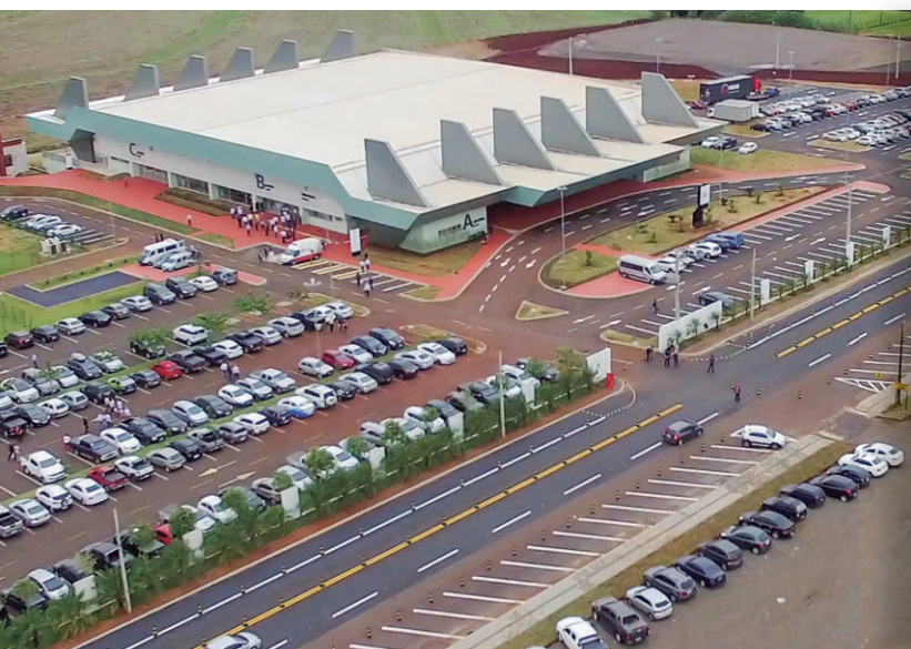
Cerca de R$ 35 milhões foram investidos na obra, que possui área total é de 9.200 metros quadrados