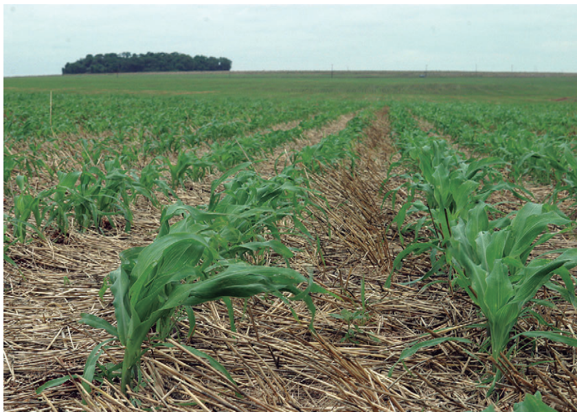
A previsão é que a área de milho no estado aumente 18% e atinja 487 mil hectares

A expansão dos embarques em mais de 50%, no confronto dos dois intervalos, foi puxada pelo câmbio favorável no início do plantio da safrinha, o que levou os produtores a venderem antecipadamente boa parte da produção. Por exemplo, em 15 de fevereiro deste ano, a moeda norte-americana estava valendo R$ 4, aumentando a competitividade do cereal, no mercado internacional. Isso acabou gerando desequilíbrio no mercado interno, pela oferta apertada, o que pressionou os preços do milho e refletiu na alta dos custos de produção da cadeia de carnes. Em maio, por exemplo, o produtor vendeu a saca de 60 quilos por R$ 40.