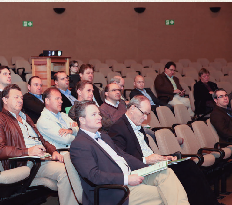
A segunda rodada dos Encontros de Núcleos de 2016 foi encerrada na manhã 28 de outubro, em Entre Rios, distrito de Guarapuava, no centro-sul do Estado, com 54 representantes de nove cooperativas agropecuárias, duas de crédito, uma de saúde e uma de transporte