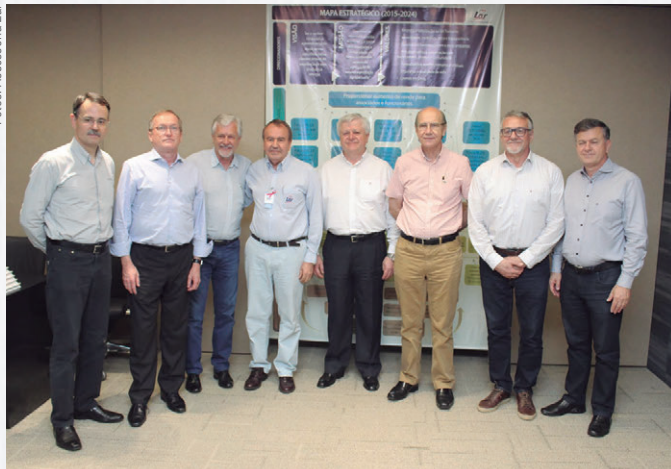
Convênio foi assinado por representantes das entidades parceiras e cooperativas no dia 19 de outubro, na sede da Cooperativa Lar, em Medianeira