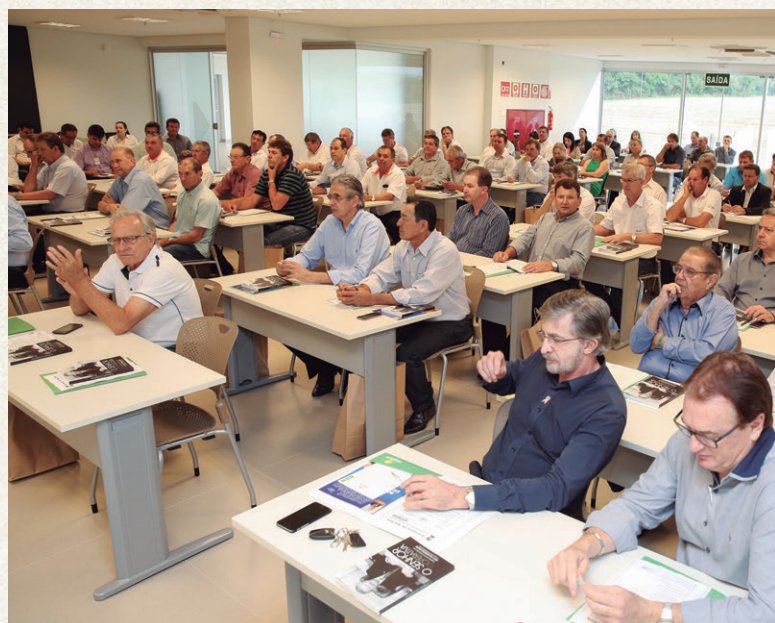
Cento e trinta pessoas, representando 20 cooperativas de sete ramos, participaram, em 20 de outubro, em Medianeira, no oeste do Paraná, do Encontro de Núcleos Cooperativos do Sistema Ocepar