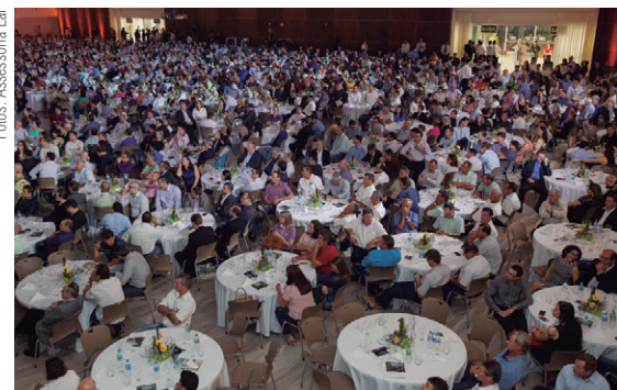
Salão de 2.201 metros quadrados comporta 1.800 pessoas sentadas em mesa de festa