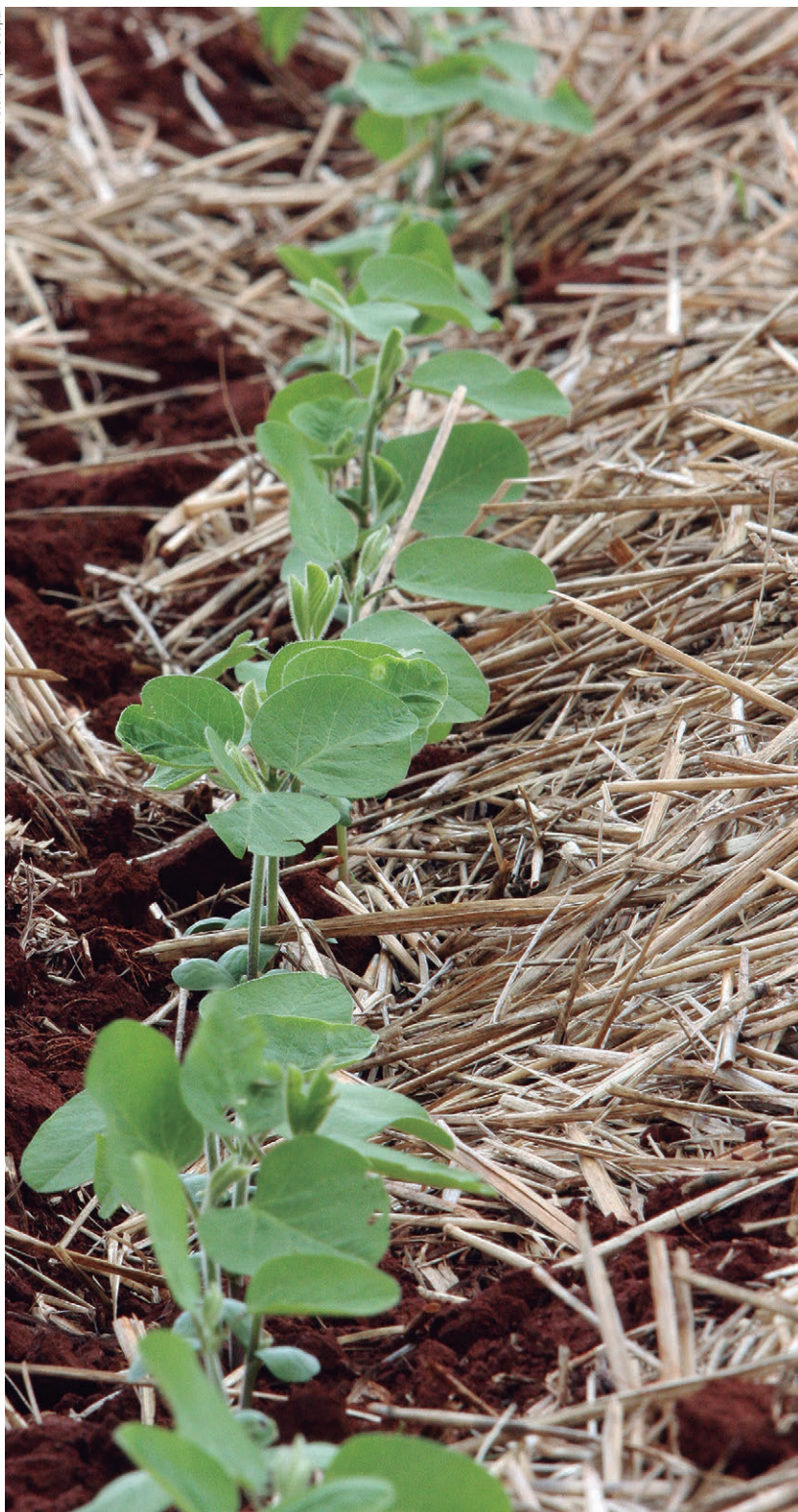
A soja deverá render 18,3 milhões de toneladas em 5,24 milhões de hectares