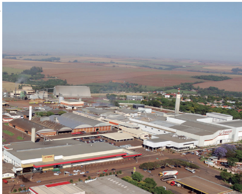
Investimentos em projetos e profissionalização dos cooperados garantem expansão da Copacol

com a Cooperativa Coagru, também estamos investindo R$ 300 milhões na Unitá, Cooperativa Central criada em Ubitatã para ampliar o abate de aves de 180 mil para 380 mil unidades por dia”, enumera o presidente, ao acrescentar que “a contratação de colaboradores vai continuar sendo feita acompanhando o ritmo de expansão da Copacol”.