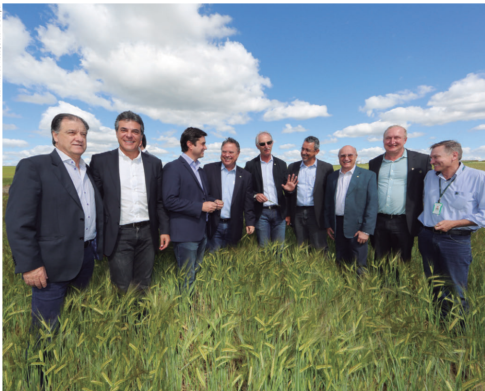
Autoridades e políticos conheceram os campos experimentais de cereais – trigo e cevada – da Cooperativa