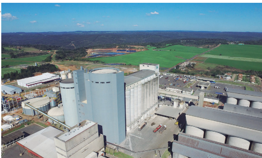
Maltaria da Agrária, a maior do Brasil. A Cooperativa detém 25% do mercado brasileiro de malte

Indústria de Milho produzirá anualmente 180.000 toneladas de grits, flakes, creme, fubá, entre outros produtos