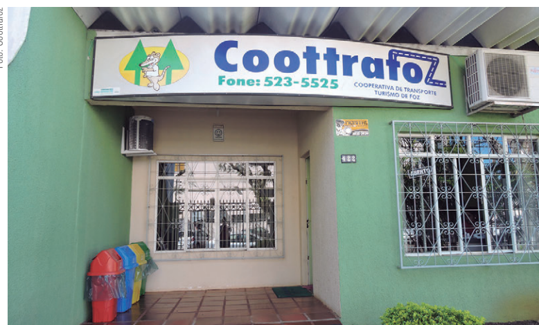
A partir de sua sede em Foz do Iguaçu, a Cooperativa atende a região da Tríplice Fronteira