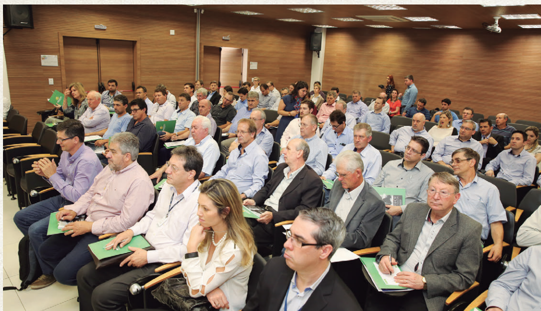
No dia 21 de outubro, o Encontro ocorreu em Pato Branco, no sudoeste do Paraná, e reuniu 87 cooperativistas da região, que decidiram se unir para implantar o planejamento estratégico na região