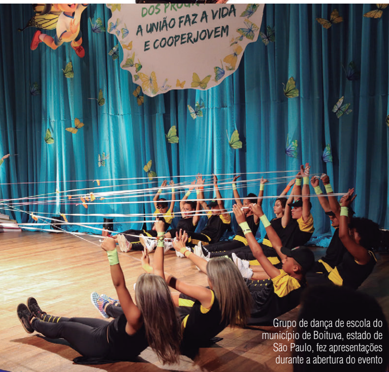
Grupo de dança de escola do município de Boituva, estado de São Paulo, fez apresentações durante a abertura do evento

O programa do Sicredi A União Faz a Vida tem como objetivo promover valores de cooperação e cidadania entre crianças e adolescentes, por meio de práticas de educação cooperativa. Ao todo, 17 mil educadores e mais de 215 mil alunos, de 1.368 escolas, participam do Programa atualmente em âmbito nacional. No Paraná, São Paulo e Rio Janeiro, está presente em 108 municípios, contemplando 417 escolas, 5.265 educadores, 62.441 crianças e adolescentes e 24 cooperativas. Mais informações: http://auniaofazavida.com.br/ .