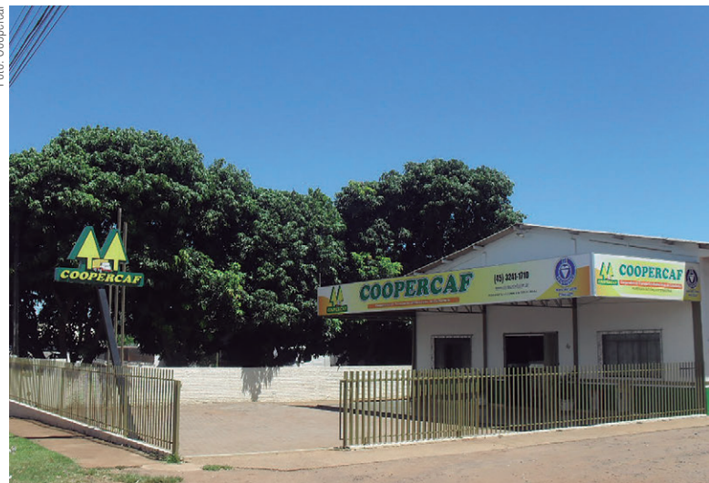
Sede da Coopercaf, em Cafelândia. Estrutura reflete a expansão da cooperativa em 19 anos de atividade