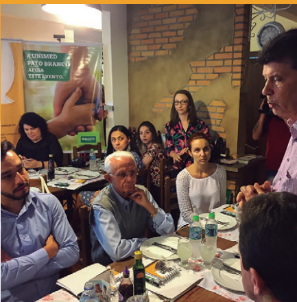
Em Pato Branco , participação de 30 profissionais da imprensa regional