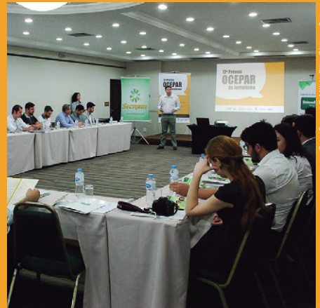
Em Maringá , presença de 40 profissionais que atuam no noroeste paranaense