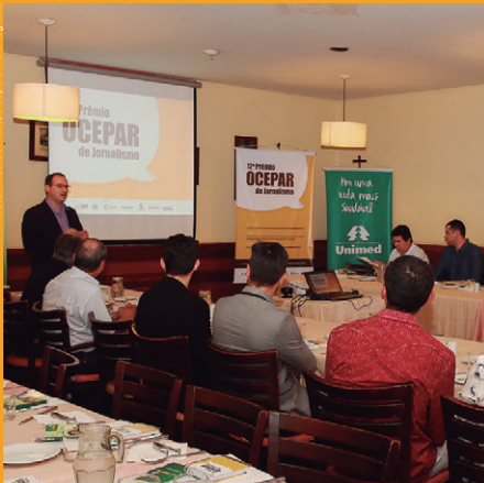
Em Londrina , evento de lançamento reuniu 40 profissionais