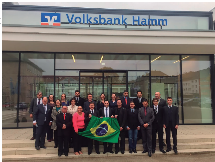
Mestrandos na sede da cooperativa de crédito VolksBank – Mitgliederoase, em Hamm