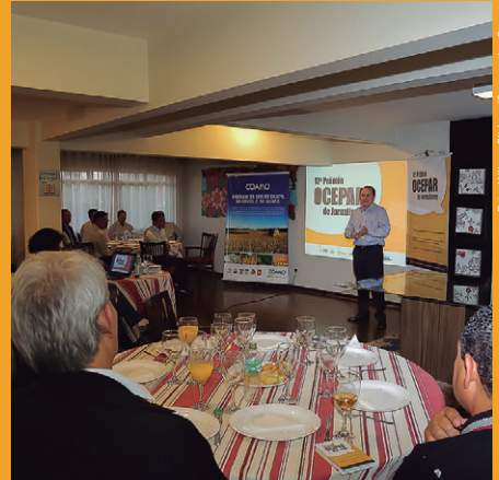
Em Campo Mourão , presença de 32 profissionais da imprensa