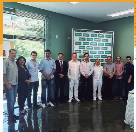
Lançamentos regionais encerraram em Francisco Beltrão , com a presença de 20 profissionais