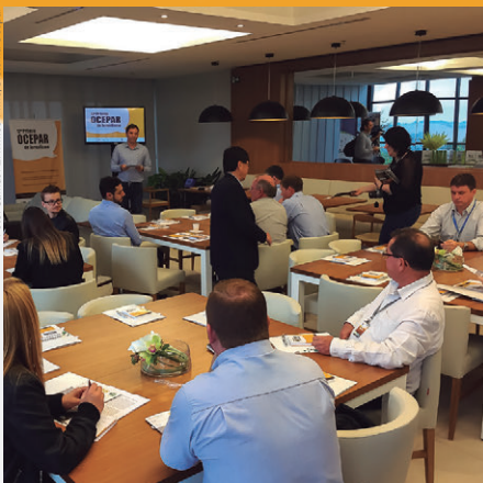
Em Carambei , lançamento contou com a participação de 30 profissionais