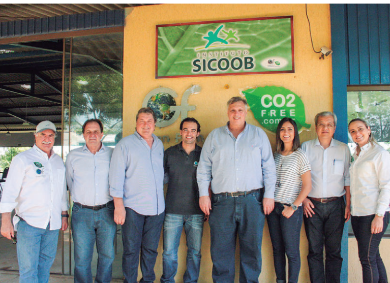
Dirigentes do Sicoob e representantes da Green Farm em visita à área de proteção ambiental: preservação da fauna e da flora

Visando promover a conscientização dos colaboradores por meio de trabalho interno, para que os mesmos estejam aptos a difundir ações sustentáveis aos cooperados e instituições parceiras, o Sicoob Unicoob busca vir ao encontro com a sua missão de promover o cooperativismo financeiro, contribuindo para o desenvolvimento sustentável das comunidades a fim de firmar-se como uma cooperativa de crédito responsável quanto a questões ambientais a partir de plantio de árvores, energia renovável, entre outros. ■