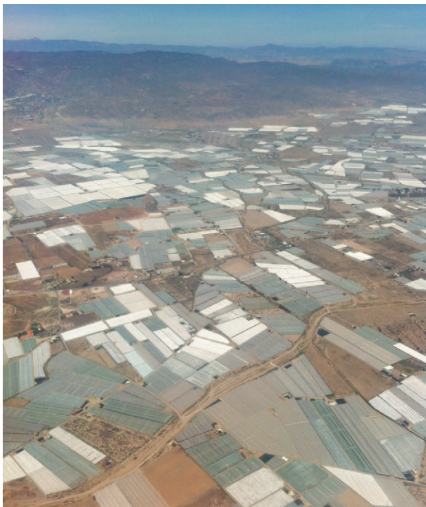
Estufas de tomates na árida região de Almeria, que faz parte da comunidade autônoma de Andaluzia, que tem forte presença de cooperativas