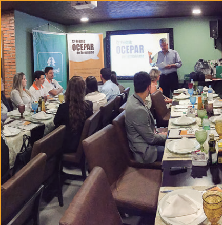
Lançamento em Cascavel . Presença de 24 profissionais da imprensa