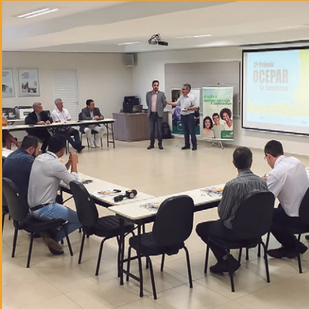
Rodada de lançamentos regionais iniciou por Toledo . Participação de 40 profissionais da imprensa