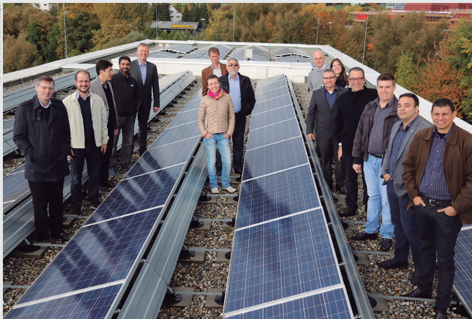
Placas fotovoltaicas instaladas na cobertura do Stadtwerke Aalen GmbH, empresa pública municipal, localizada em Aalen, no sul da Alemanha, que presta serviços de fornecimento de água potável, energia elétrica, gás natural (GNV), entre outros