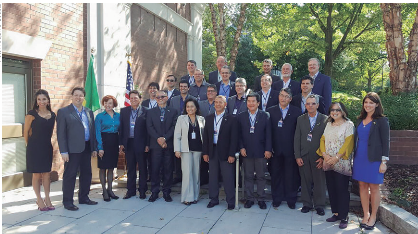
As lideranças cooperativistas participaram de um curso na American University, fundada em 1893 e que atualmente possui mais de 12 mil alunos

temas como “O descompasso entre o que a ciência conhece e o que as organizações fazem: os líderes que precisamos”, “Liberando o poder da liderança resiliente”, “Liderança baseada em valores” e “Mude