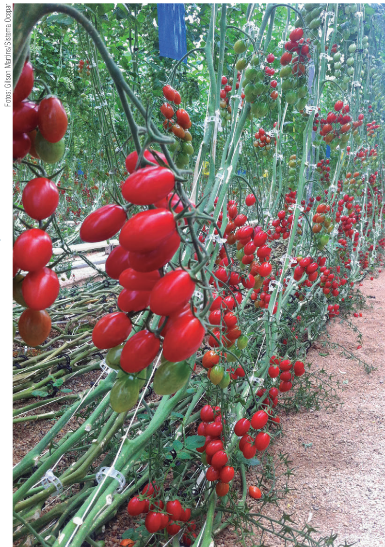
Cultivos de tomates em Almería, no leste do país. A hortifruticultura responde por 25,4% do faturamento do ramo agropecuário espanhol

As cooperativas atuam, principalmente, nas atividades de hortifruticultura, fornecimento de insumos, alimentação animal (rações), grãos e cereais, vinhos, lácteos e suinocultura. “Muitas cooperativas na Espanha atuam em setores diferentes do cooperativismo brasileiro. Um exemplo é a significativa presença