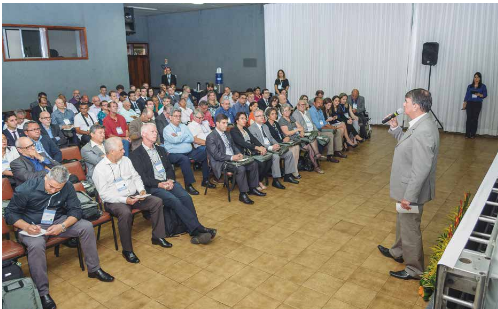
Durante dois dias, cerca de 100 cooperativistas analisaram o trabalho de defesa política e institucional do setor e as melhorias que podem ser implementadas