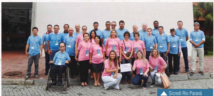
▲ Sicredi Rio Paraná