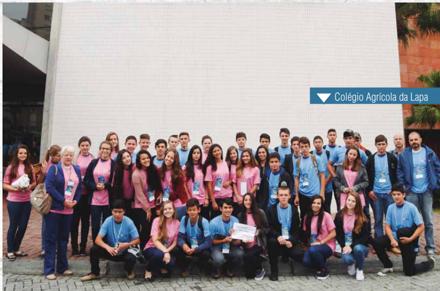
▼ Colégio Agrícola da Lapa