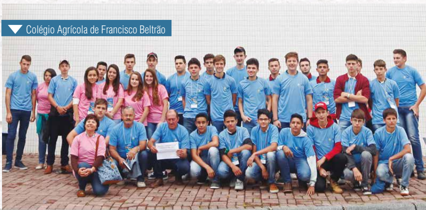
▼ Colégio Agrícola de Francisco Beltrão