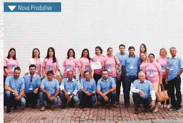
▼ Nova Produtiva