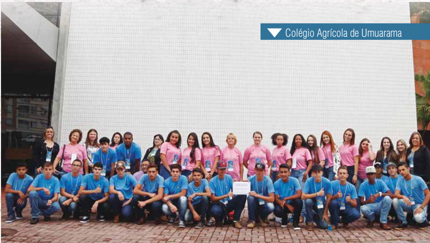
▼ Colégio Agrícola de Umuarama