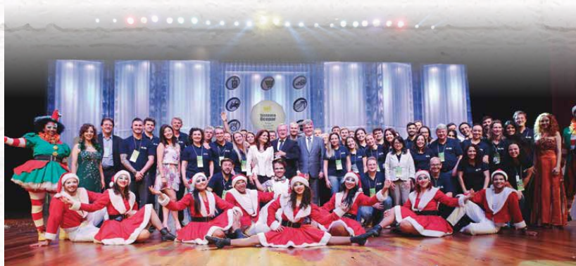
Equipe de funcionários do Sistema Ocepar reuniu-se à trupe do Espaço Sou Arte para a foto celebrando a realização de mais um evento de confraternização das cooperativas paranaenses

Diante do cenário econômico do país, os dirigentes consideram o Encontro Estadual de Cooperativistas como um momento de celebração, uma oportunidade de pensar sobre o futuro do setor e que reflete a importância do cooperativismo do Paraná.