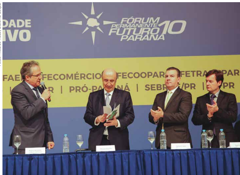
O ministro da Fazenda recebeu o documento Plano Estadual de Logística e Transportes do Paraná (Pelt) 2035, com 120 propostas de projetos e intervenções na infraestrutura do estado

para os estados que tiverem planos de recuperação viáveis e consistentes, independente se essas condições estão ou não previstas na lei”, disse. Segundo Meirelles, não se justifica a preocupação de “muitos analistas econômicos” de que existiriam riscos de descontrole e falta de critérios nas renegociações entre estados e a União. “Precisamos ter responsabilidade e serenidade. Para renegociar, os estados terão que apresentar condições para isso, sendo aprovados pelo Ministério da Fazenda e Presidência da República”, reiterou.