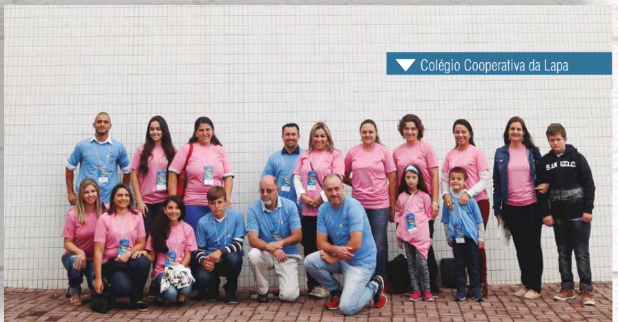
▼ Colégio Cooperativa da Lapa