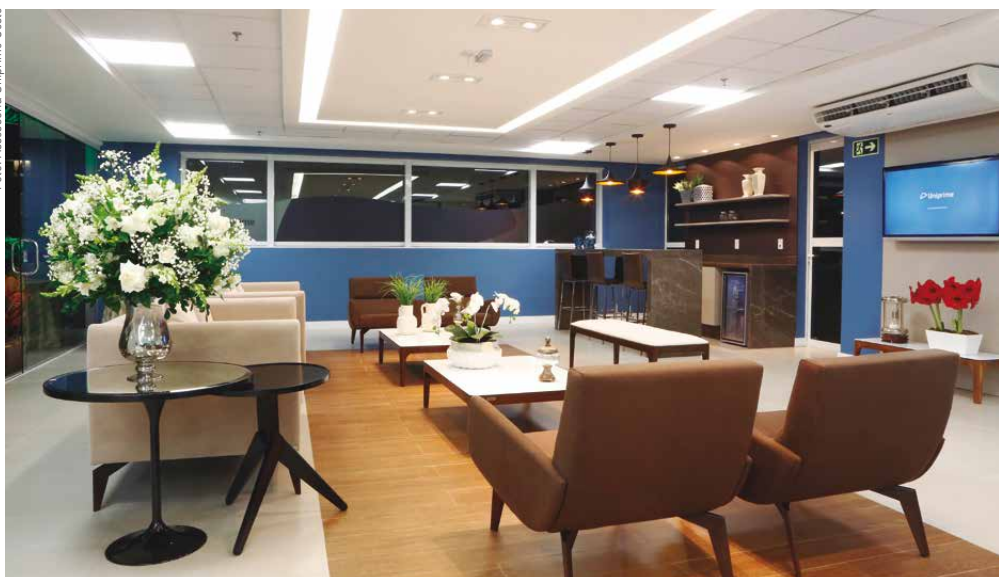
Além de investir em inovações tecnológicas, a cooperativa também criou um ambiente especial de convivência para o quadro social, o Espaço do Associado

do Paraná mantém o foco central na interação com o quadro cooperado.