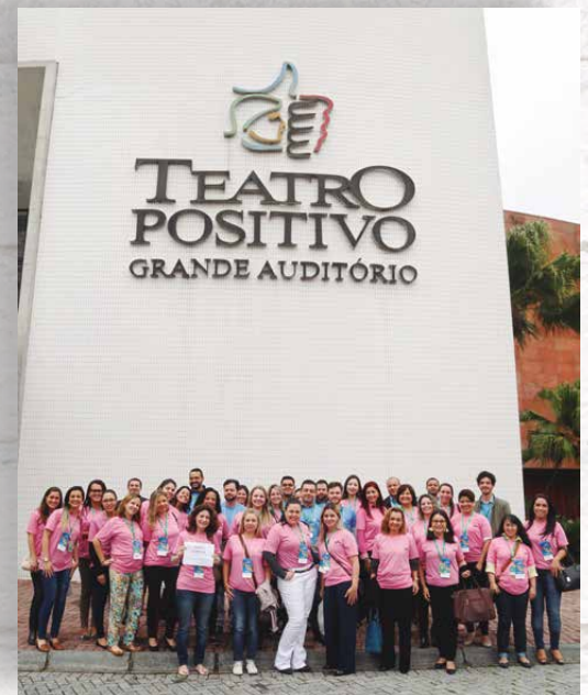
▲ Unimed Curitiba