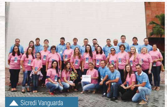
▲ Sicredi Vanguarda