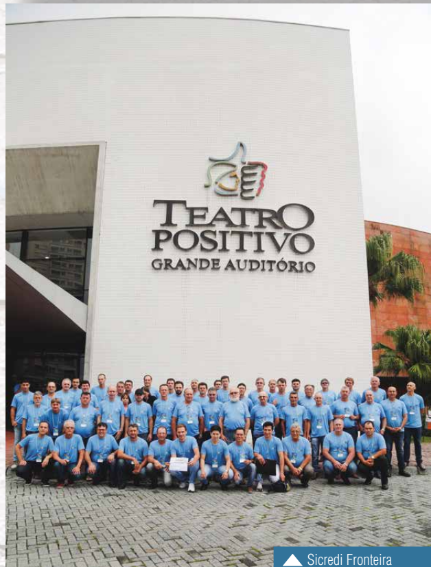
▲ Sicredi Fronteira