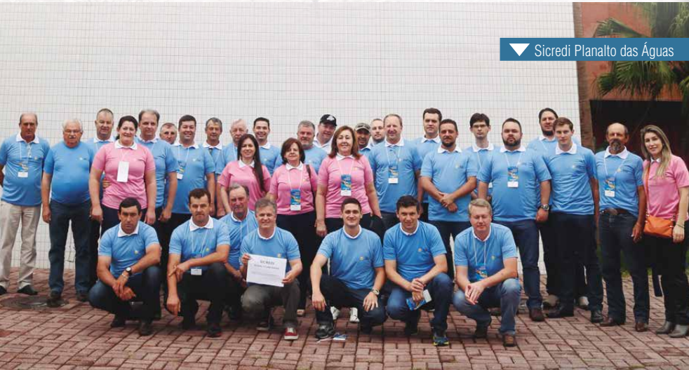
▼ Sicredi Planalto das Águas