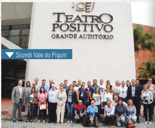
▼ Sicredi Vale do Piquiri