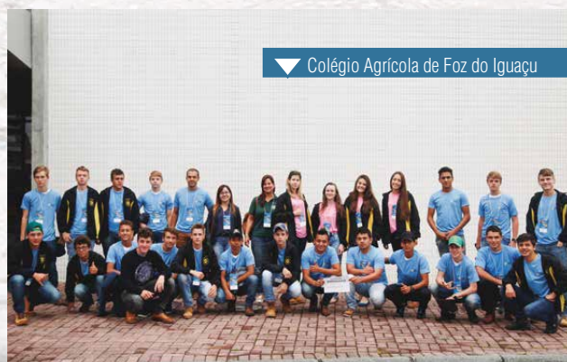
▼ Colégio Agrícola de Foz do Iguaçu