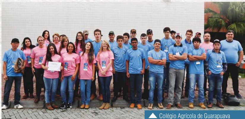
▲ Colégio Agrícola de Guarapuava