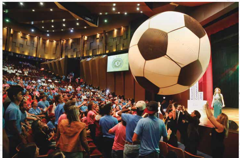
Plateia de cooperativistas se divertiu e interagiu com os artistas do Espaço Sou Arte

Ele lembrou ainda que, na área de formação e profissionalização, monitoramento e promoção social, mais de 7 mil eventos foram realizados neste ano, por meio do Sescoop/PR, para mais de 180 mil pessoas que integram as cooperativas. Ao todo, são 100 mil horas de treinamento em 2016. "Investir nas pessoas está no DNA e nos princípios do cooperativismo. A formação de novas lideranças e os investimentos em jovens e mulheres têm mere-