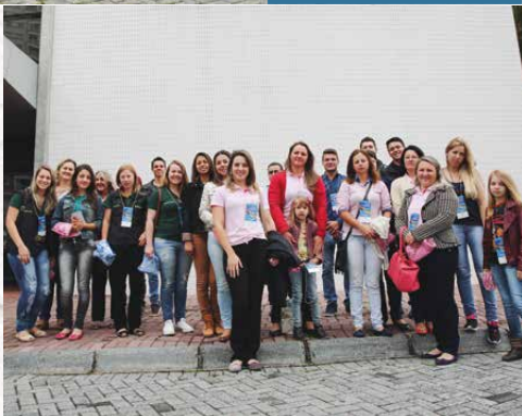
▲ Bom Jesus