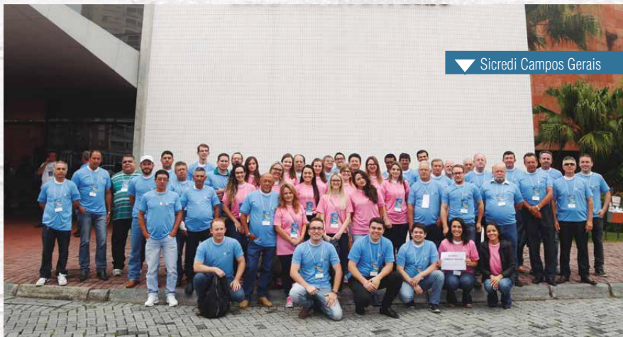
▼ Sicredi Campos Gerais