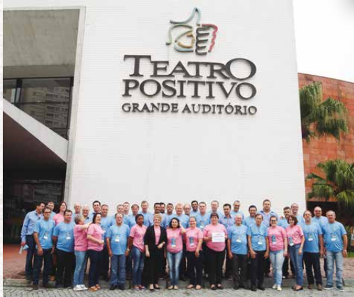
▲ Sicredi Nossa Terra