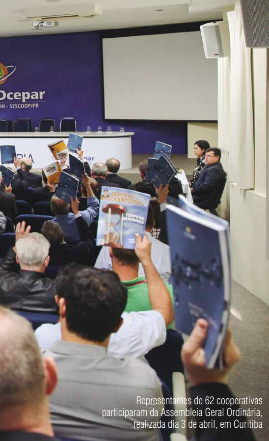
Representantes de 62 cooperativas participaram da Assembleia Geral Ordinária, realizada dia 3 de abril, em Curitiba