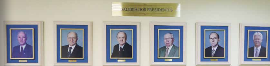
Fotos dos ex-presidentes estão expostas na recepção do Sistema Ocepar