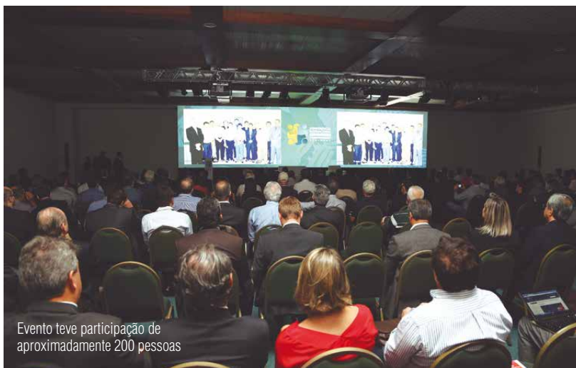
Evento teve participação de aproximadamente 200 pessoas

A Conferência Internacional Cooperativismo e Desenvolvimento Regional contou com a participação de líderes dos principais sistemas de cooperativas financeiras, como Sicoob, Sicredi, Uniprime, Unicred, Cresol e Ceced, e teve ainda representantes do Banco Central do Brasil e das sociedades de garantidoras de crédito, além de especialistas da Alemanha, Portugal, Paraguai, Peru e Argentina. ■