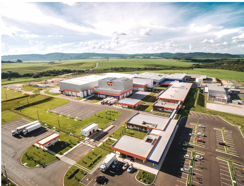
A Unidade Industrial de Carnes (UIC) da Alegra, em Castro, é resultado de um projeto de intercooperação com investimento de R$ 250 milhões