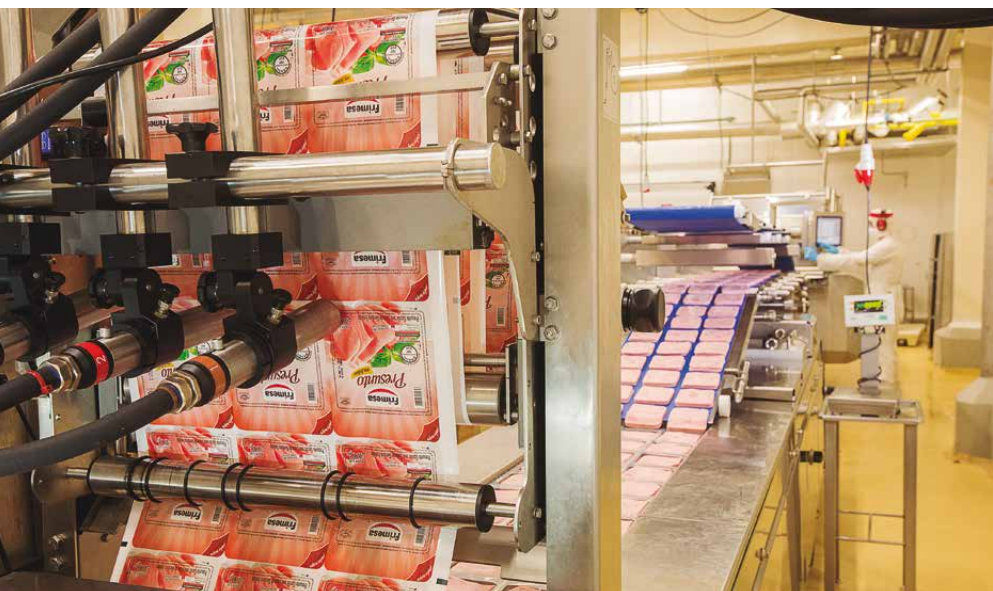
A produção da Frimesa é tecnicizada e suinocultores seguem programas rígidos, desde a alimentação do plantel e instalações que priorizem o bem-estar animal, genética e sustentabilidade