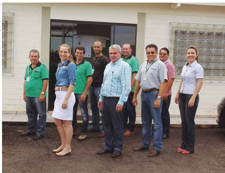
Equipe da Rodocoop: apoio aos associados e planejamento para fortalecer a Cooperativa

A expansão geográfica também está nos planos da Rodocoop. “Vamos intensificar a busca por novas oportunidades de transportes na nossa área de ação, especialmente em Goiás”, disse o presidente, destacando que a parceria com a Cocari está possibilitando vislumbrar esse avanço. “A produção de grãos em Goiás está muito boa, e percebemos a necessidade da Rodocoop fazer parte desse processo, atuando com o transporte de cereais”, esclareceu.