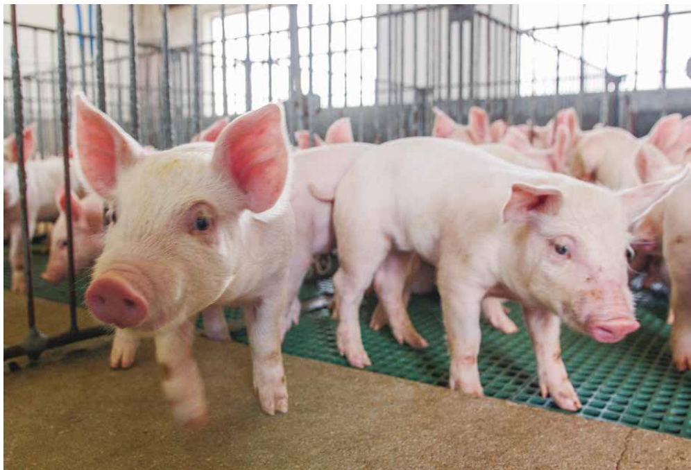
Cuidados com melhoramento genético, sanidade, nutrição e bem-estar animal são controles prioritários nas unidades de produção de leitões das cooperativas

do, a produção brasileira teve um crescimento de 8,2% (3,7 milhões de toneladas em 2016), ampliando as exportações em 32,8%. Para o superintendente da Ocepar, Robson Mafioletti, a produção do Brasil – quarto maior produtor mundial - ainda tem muitas possibilidades de desenvolvimento para ocupar um espaço mais consistente no mercado global. “O potencial da suinocultura do país é inquestionável e tende a crescer quando forem reduzidas as restrições à entrada da carne brasileira de suínos. Apenas em torno de 40% do mercado mundial está aberto aos nossos produtos”, relata. “As características de qualidade, controle de sanidade e rastreabilidade, colocam a produção das cooperativas num patamar muito favorável no mercado internacional, quando diminuírem as barreiras e entraves ao suíno produzido no Brasil”, projeta.