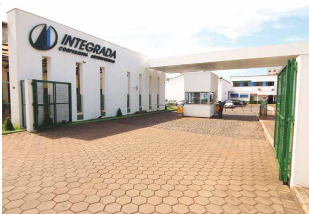
Em 21 anos de atuação, Cooperativa tornou-se uma das maiores do ramo agropecuário do Paraná