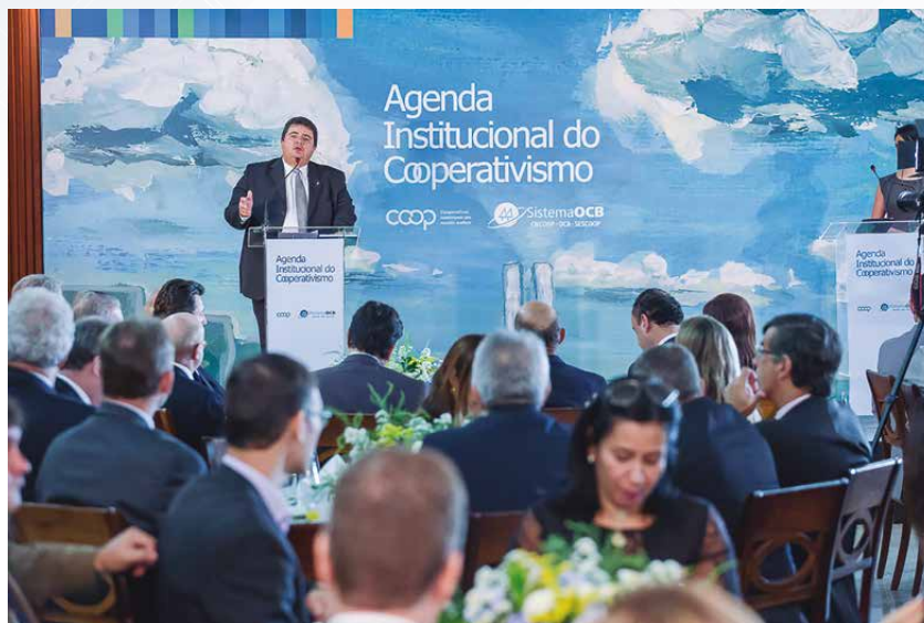
Presidente da OCB, Márcio Lopes de Freitas, diz que cooperativismo não pode ser surpreendido com normativos legais que afetem suas atividades

Na ocasião, o presidente do Sistema OCB, Márcio Lopes de Freitas, relacionou a importância da agenda com o atual momento político e econômico do país e cobrou uma interlocução maior com os Três Poderes. “O setor cooperativista quer ser ouvido durante o processo de elaboração de normativos legais que afetem suas atividades”, reforçou o dirigente, lembrando que as cooperativas têm o compromisso de atuar como ferramentas indutoras de desenvolvimento regional e que, portanto, não podem ser surpreendidas com medidas contrárias ao setor.