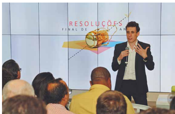
O economista Samy Dana falou sobre psicoeconomia para associados de São Paulo

De acordo com o presidente da Central Sicredi PR/SP/RJ e da Sicredi Participações S.A., Manfred Dasenbrock, as atividades executadas durante a Semana Nacional de Educação Financeira são a materialização do que é realizado diariamente pela instituição. “Educação financeira é um dos pilares do cooperativismo de crédito e no Sicredi esse conceito é levado muito a sério. O crescimento da cooperativa passa, necessariamente, pelo desenvolvimento do associado e isso só é possível quando a saúde financeira dele está em dia”, comenta.