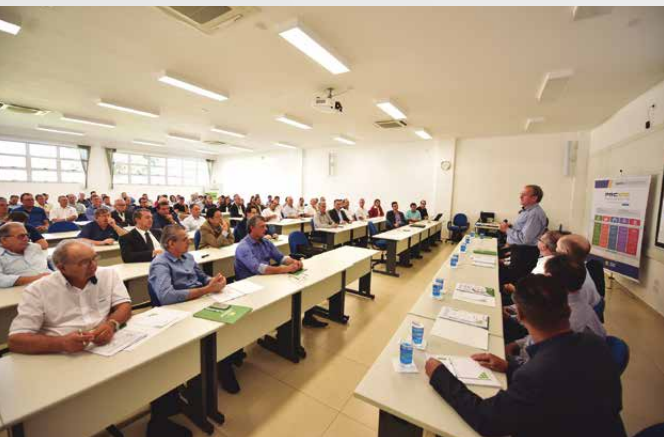
Em Palotina, evento teve 121 participantes do oeste do estado

Durante o Encontro, as cooperativas Coagro e Sicredi Fronteiras PR/SC/SP assinaram um contrato de financiamento de R$ 2,6 milhões para novos investimentos em estrutura de armazenagem e recebimento de grãos. “Vamos acessar uma linha de crédito do Pronaf, com recursos do BNDES. Com o apoio do Sicredi, conseguimos viabilizar essa negociação entre uma cooperativa do ramo crédito e outra do setor agropecuário. Por sermos cooperativistas, há mais proximidade