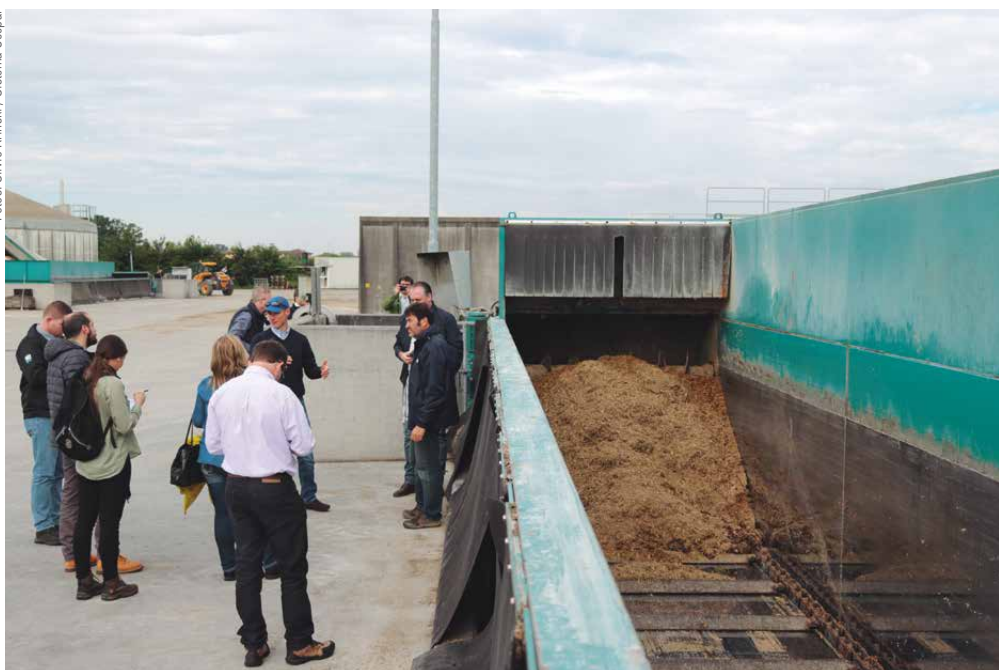
Visita à Pieve Ecoenergia, localizada em Cingia de Botti. A planta, com capacidade de 2 Mw de potência, produz biogás a partir de dejetos animais, descarte de vegetais e silagem de milho