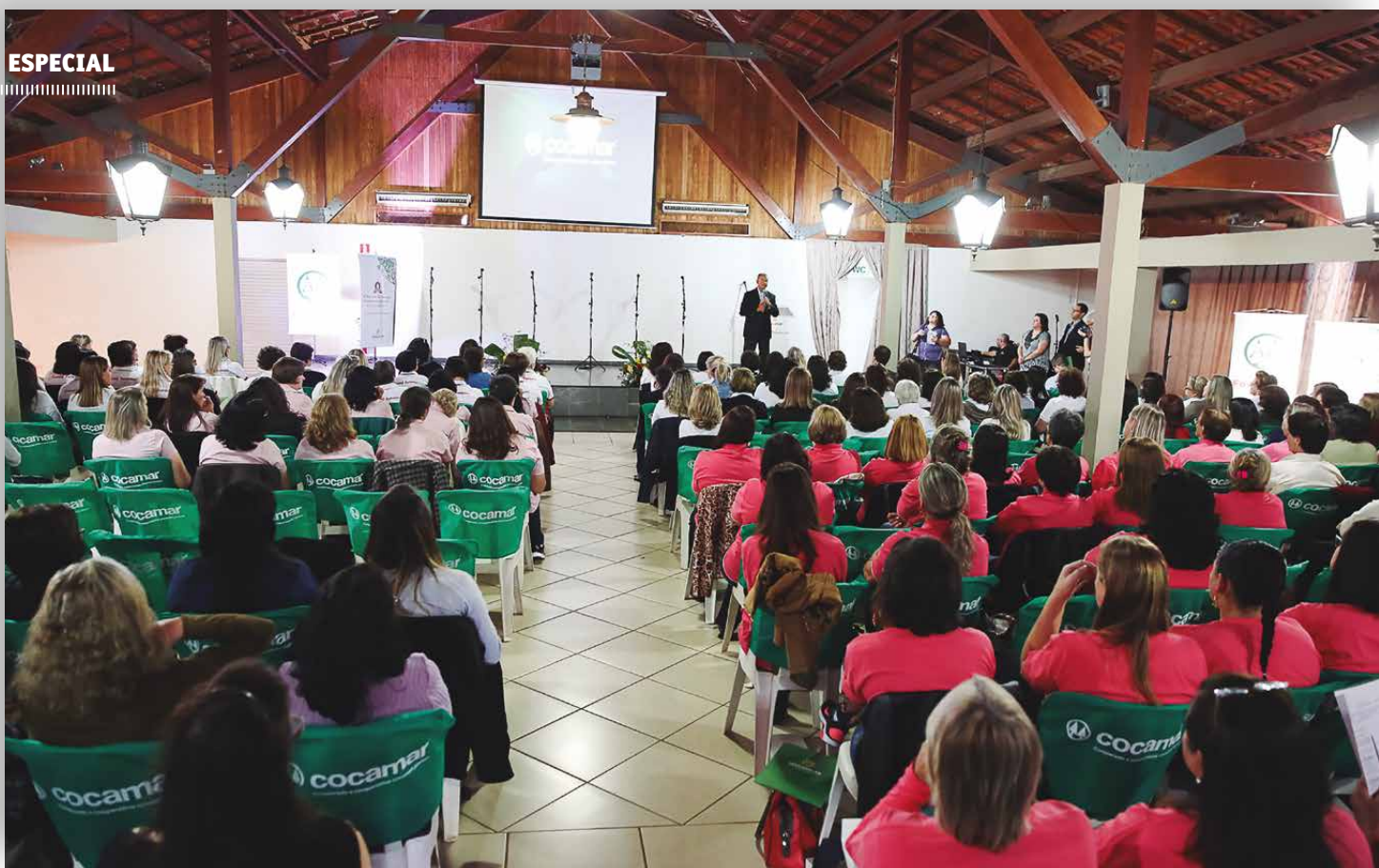
Elicoop reuniu mais de 200 líderes femininas na Associação da Cocamar, em Maringá