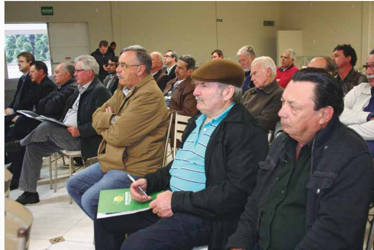
O último evento da primeira rodada de 2017 ocorreu em Guarapuava

dade, o que faz com que as tratativas fiquem facilitadas”, explicou.