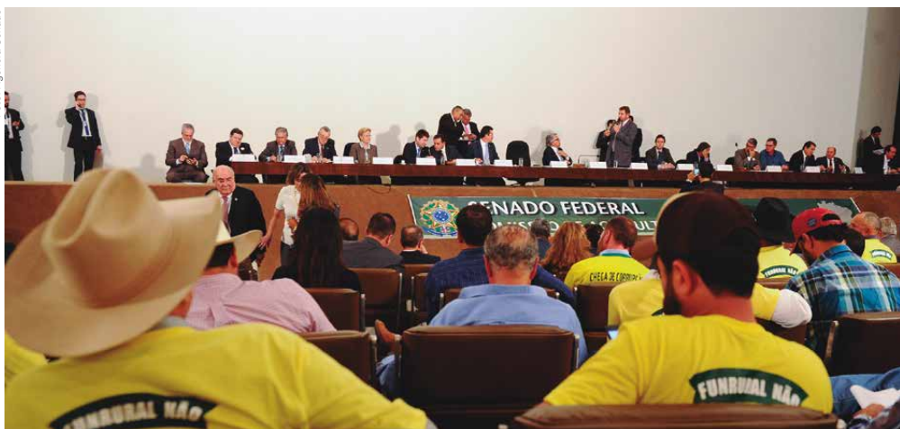
Representantes da Ocepar participaram de audiências públicas e debates, reafirmando a posição dos cooperativistas do Paraná e do Brasil: “Os produtores rurais não são sonegadores e agiram dentro do exercício legal do direito”