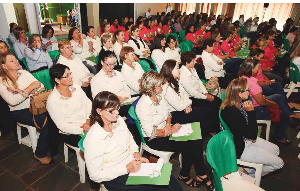
Os temas debatidos durante os encontros vão de cooperativismo a mercado nacional, que serão multiplicados pelas líderes nos comitês e na comunidade

Fabianne ainda lembra que o Serviço Nacional de Aprendizagem do Cooperativismo (Sescoop/PR), que promove o Elicoop Feminino, incentiva as cooperativas a desenvolverem trabalhos com os núcleos femininos em busca da profissionalização da mulher. ■