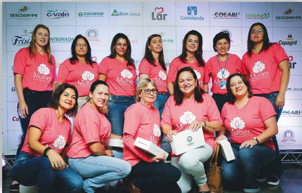
Após participarem do Elicoop, espera-se que repassem o que aprenderam para mulheres cooperativistas de suas respectivas regiões