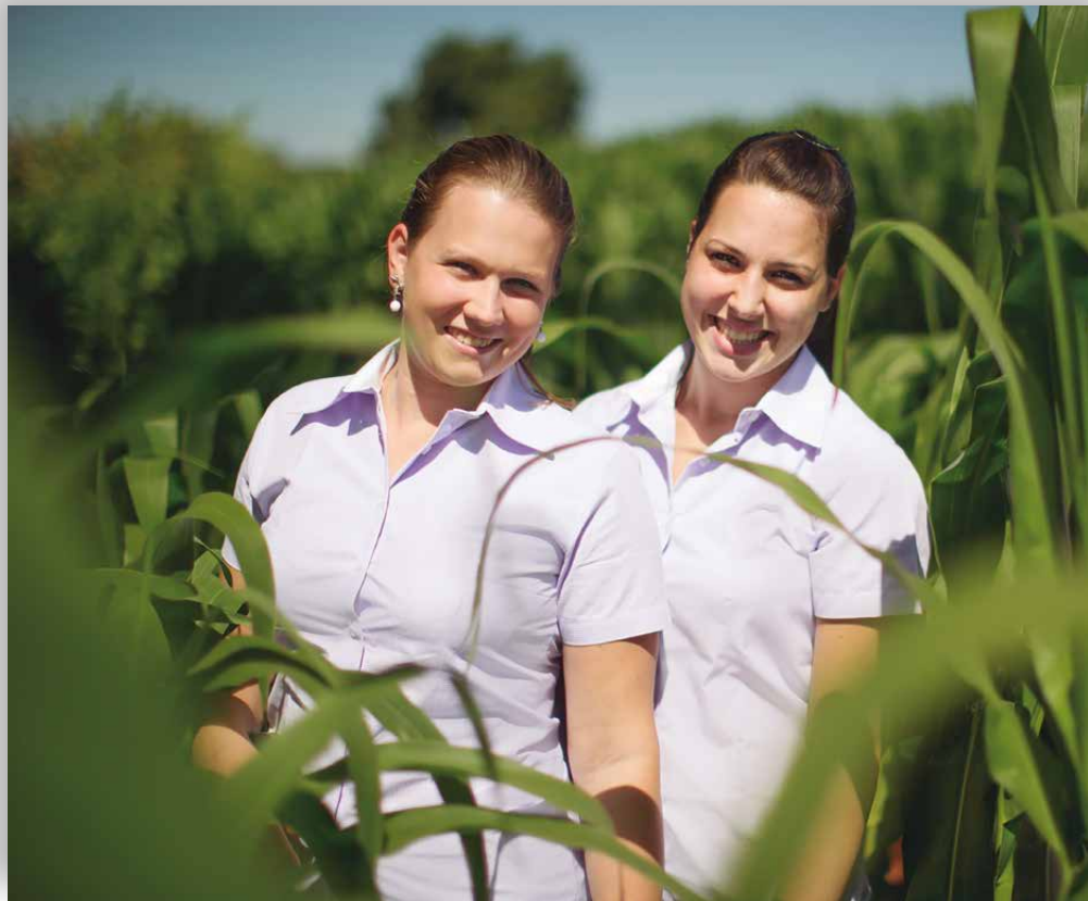
Na C.Vale, qualificação pessoal e profissional incentiva envolvimento de esposas e filhas de cooperados, Objetivo é que as famílias permaneçam na atividade produtiva e na cooperativa