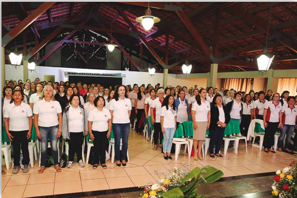
No cooperativismo do Paraná, 15% dos associados e 36% dos funcionários são mulheres

Na Cocamar, de Maringá, no noroeste do estado, as mulheres representam 15% do quadro social. Para este público, há 15 anos são realizadas ações, por meio dos