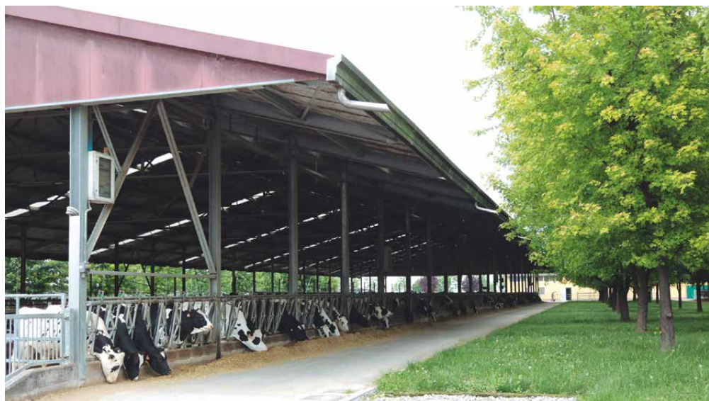
Na fazenda situada em San Martino Buon Albero, os dejetos do rebanho de gado de leite e a silagem de milho alimentam uma planta com potencial energético de 100 Kw

Na avaliação de Riccardo Gefter Wondrich, do Consórcio Italiano Biogás, que acompanhou os cooperativistas brasileiros na missão, o intercâmbio entre os dois países foi muito positivo. “Como o grupo já ti-