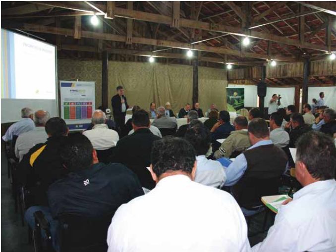
Questões ligadas à crise política brasileira estiveram em pauta na reunião de Ubiratã