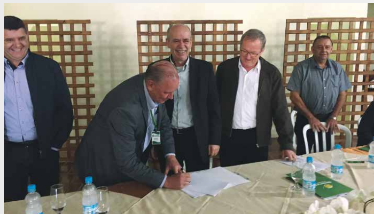
Convênio entre a Coagro e Sicredi Fronteiras PR/SC/SP foi assinado no Encontro de Capanema