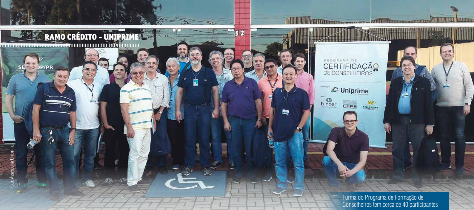
Turma do Programa de Formação de Conselheiros tem cerca de 40 participantes