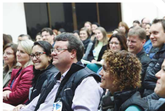
Integração e alinhamento de práticas estiveram entre os objetivos do Encontro de Agentes