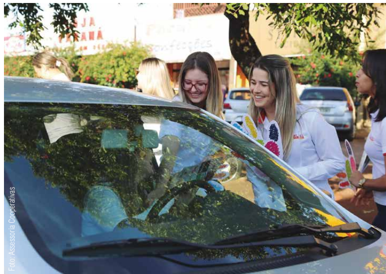
Sicredi Vale do Piquiri, Coagru e Unita: ação conjunta em Ubiratã e Campina da Lagoa

No Paraná, o Dia C vem se consolidando a cada edição. Neste ano, 206 cooperativas abraçaram essa grande corrente do bem. Somando as ações promovidas ao longo do ano e as do dia 1º de julho, são 174 iniciativas inscritas no programa Dia C, em 75 municípios, beneficiando 71.961 pessoas e envolvendo 5.973 voluntários em todo o estado, segundo levantamento realizado pelo Sescop/PR.