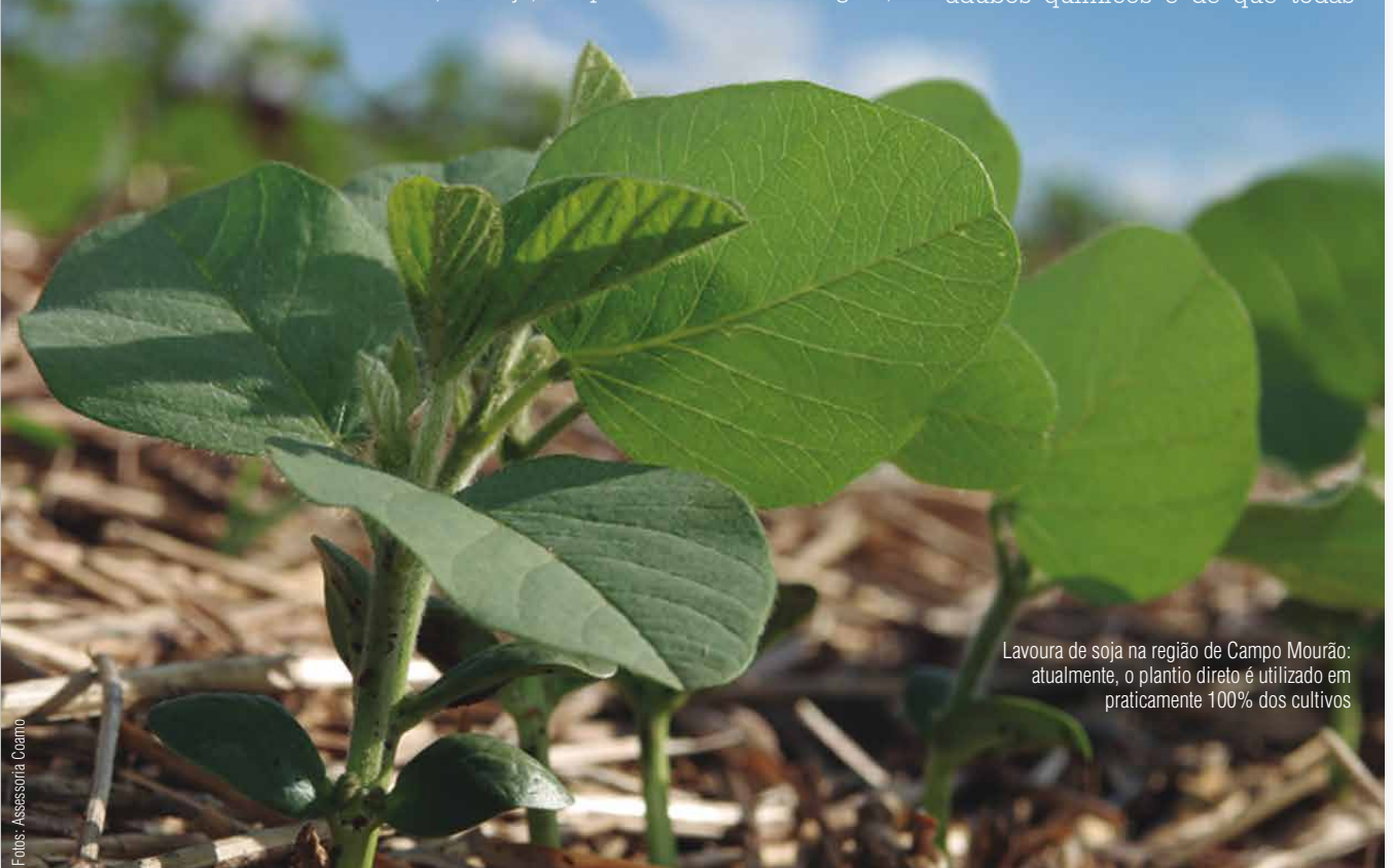
Lavoura de soja na região de Campo Mourão: atualmente, o plantio direto é utilizado em praticamente 100% dos cultivos

Com o plantio direto, o agricultor fecha o cerco contra os principais problemas que degradam o solo e ainda incrementa o sistema de produção resultando na melhoria das produtividades e racionalização dos custos. Entre as vantagens estão a garantia de redução da lixiviação de nutrientes (processo de extração de uma substância de sólido por meio da dissolução num líquido) e da erosão superficial do solo, a manutenção da vida microbiológica do solo e a garantia de uma melhor atividade dos adubos químicos e de que todas