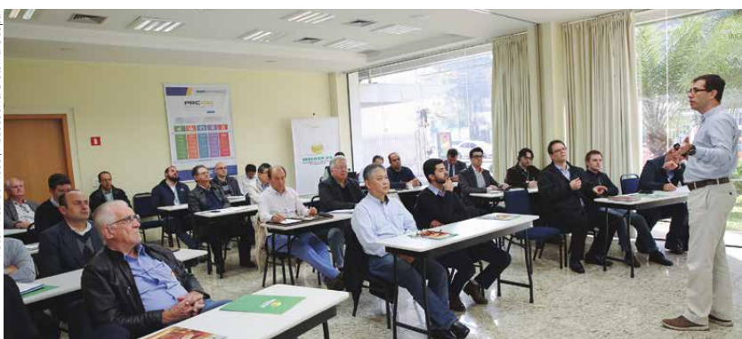
Evento teve a participação de representantes de cooperativas dos ramos agropecuário e infraestrutura e especialistas de mercado