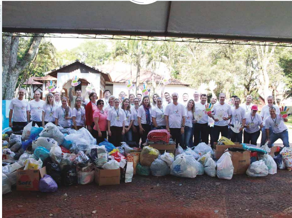
Cercar, Cooperlindeiros, Copagrill, Sicoob, Sicredi, Unimed e Uniprime se uniram para arrecadar donativos