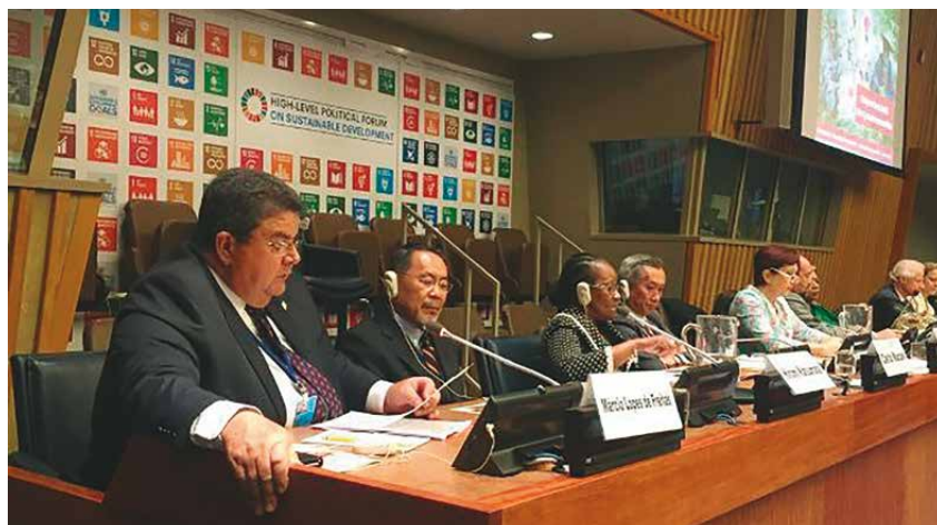
O dirigente lembrou que as cooperativas precisam manter o olhar voltado para o cuidado com as pessoas, o meio ambiente e a sustentabilidade

O dirigente encerrou seu discurso lembrando que os cooperativistas trabalham para multiplicar a mensagem de que “precisamos sempre manter um olhar voltado para o cuidado com as pessoas, o meio ambiente e a sustentabilidade dos negócios”. “Não podemos mudar tudo, mas temos a convicção de que nosso compromisso é capaz de fazer com que essas correntes do bem cresçam e se desenvolvam em todo o mundo. Afinal, quem vive o cooperativismo tem a certeza de que juntos somos mais fortes e podemos ir mais longe... e sem deixar ninguém para trás!” ■