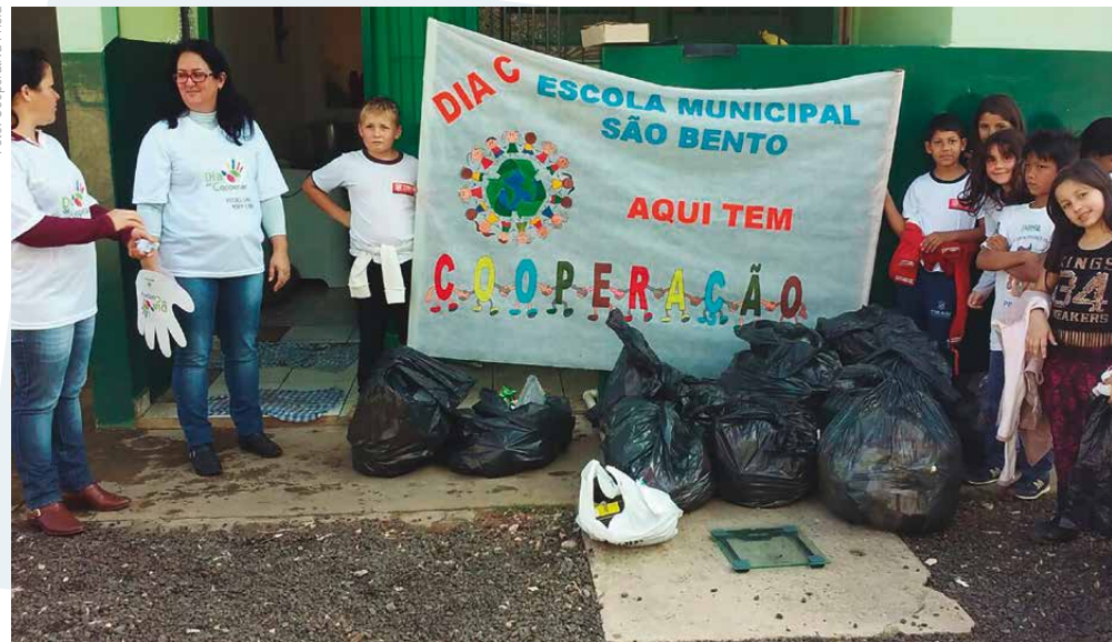
Conscientização promovida pelo projeto da Escola Municipal São Bento, apoiado pela Frísia, contribuiu para a implantação de coleta seletiva em distrito de Tibagi

Além de trabalhar na arrecadação de alimentos, a Copagrill promoveu uma ação de prevenção ao diabetes e hipertensão arterial, incentivou o desenvolvimento sustentável e estimulou a conservação