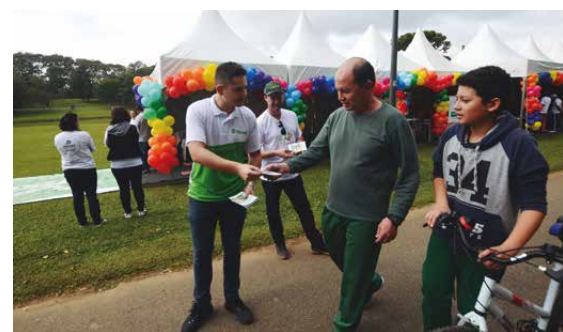
Dicas de educação financeira foram repassadas às pessoas que passaram pelo local

estados e mais de 20 mil colaboradores, o Sicredi prestou vários serviços à comunidade em geral, sempre com o objetivo de promover a responsabilidade social.