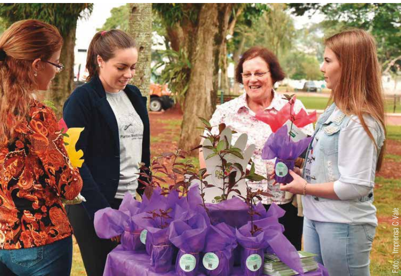
Uma ação para estimular e orientar as pessoas sobre o uso correto das plantas medicinais foi a iniciativa escolhida pela C.Vale, Cerpa, Cotriguaçu, Uniprime, Sicredi e Unimed