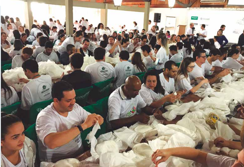
Voluntários das cooperativas Cocamar, Sicredi, Sicoob, Unimed, Uniudonto, Unicampo e Pluricoop produziram 20 mil fraldas geriátricas