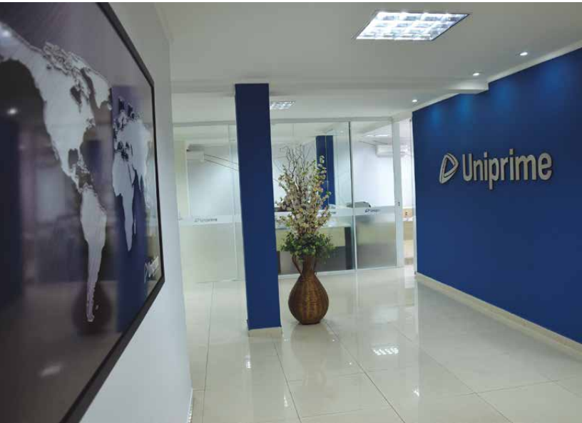
Sistema Uniprime está presente em 1.120 municípios do Paraná, Mato Grosso do Sul e São Paulo