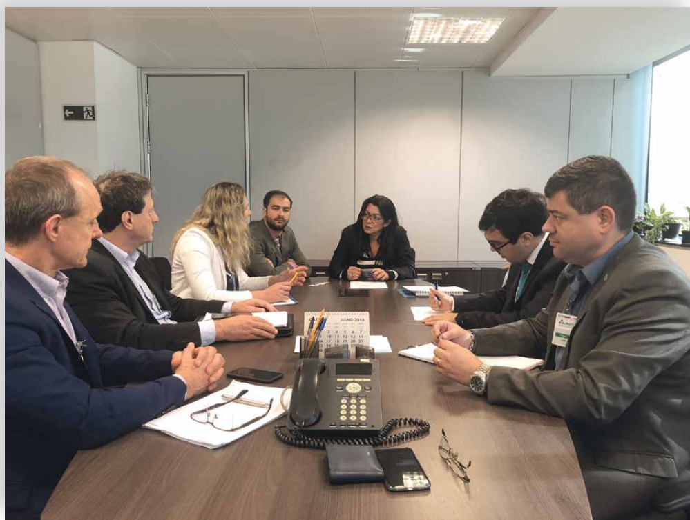
No dia 19 de julho, representantes do cooperativismo entregaram as demandas do sistema aos dirigentes da ANTT