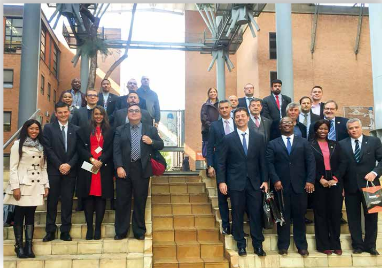
Na África do Sul, grupo visitou o Ministério da Indústria e comércio em Pretória

De acordo com o superintendente, atualmente, o comércio do Brasil é mais expressivo com a África do Sul, com exportações que somaram, em 2017, US$ 1,5 bilhão, ante um volume total de importação de