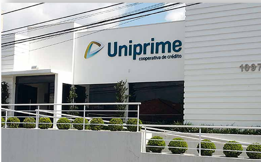
Sede da Uniprime Campos Gerais, em Ponta Grossa

Em julho, quando foi celebrado o Dia Internacional do movimento cooperativista, a Uniprime Campos Gerais realizou várias atividades para integrar os cooperados e fomentar negócios