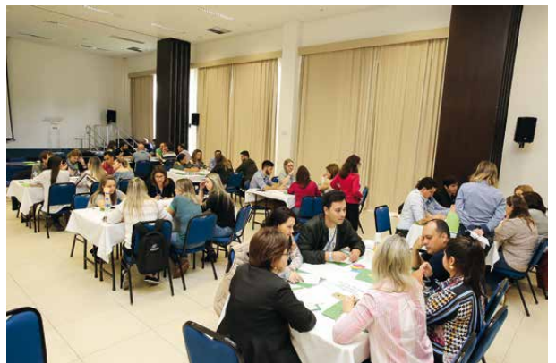
Divididos em grupos, agentes analisaram o trabalho do Sescoop/PR com o propósito de conhecer e propor melhorias