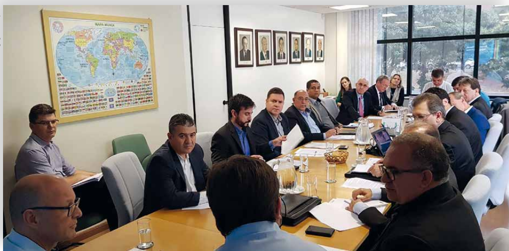
Encontro na OCB, em 18 de julho, reunindo representantes de cooperativas dos ramos transporte e agropecuário, unificou as demandas e definiu o posicionamento do setor