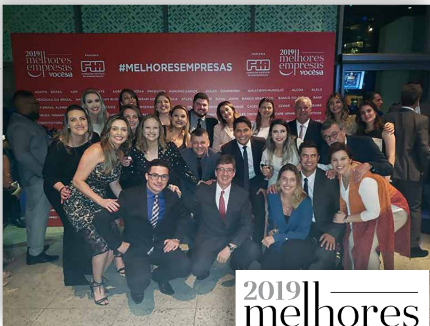
Colaboradores e dirigentes da Uniprime Norte do Paraná participaram do evento de premiação, em São Paulo