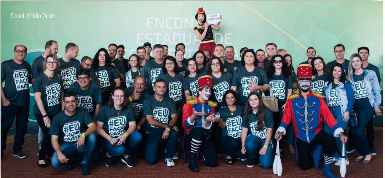
Sicoob Médio Oeste