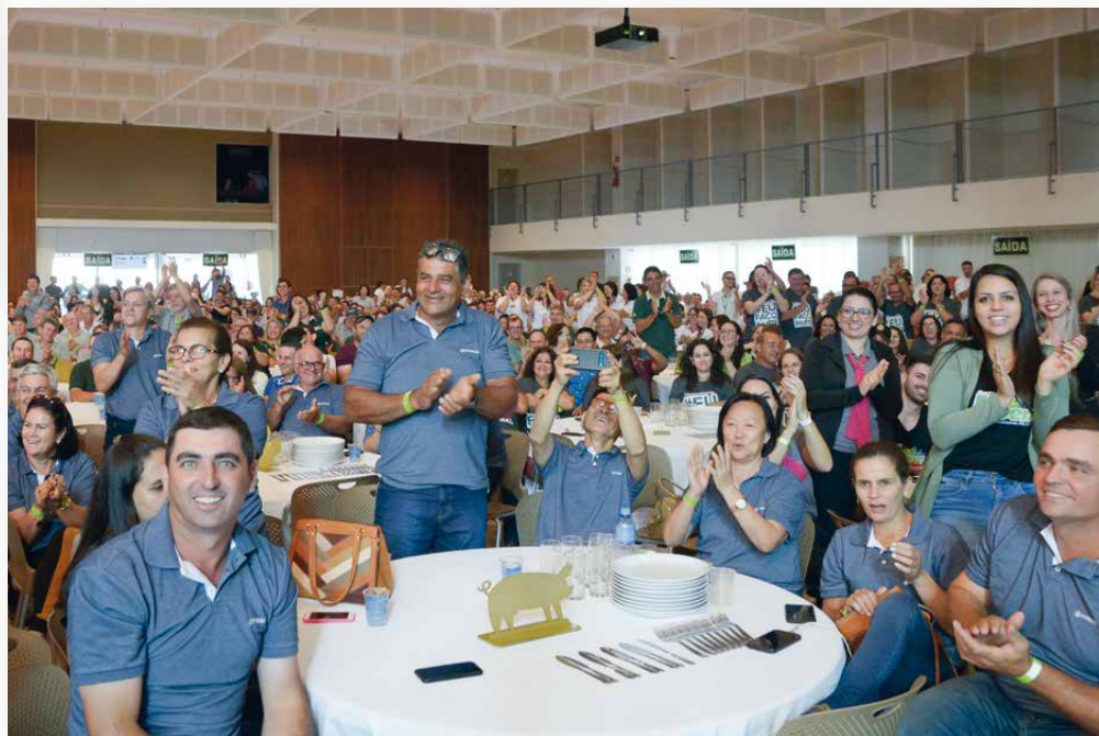
Diversão, gratidão e celebração: cooperativistas de todas as regiões do Paraná e de outros estados participaram do Encontro Estadual 2019

A histórica edição interiorana do Encontro Estadual teve muita música, com show do cantor Michel Teló, que nasceu em Medianeira, e palestra proferi-