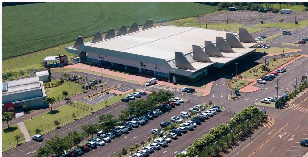
O Centro de Eventos da Lar, que sediou o Encontro Estadual, conta com um salão de 2.201 m², com capacidade para receber até 6 mil pessoas em pé e 2.147 sentadas. Estrutura é climatizada, com palco, tratamento acústico, cozinha e buffet completo, estacionamento para mais de 2 mil veículos, 4 salas de camarim, 2 salas de treinamentos, churrasqueiras automáticas, segurança, monitoramento com câmeras e acessibilidade

O presidente do Sistema Ocepar também destacou que, dando continuidade ao Plano Paraná Cooperativo (PRC100), o planejamento do setor, as cooperativas do Paraná mantêm o propósito de atingir R$ 100 bilhões de faturamento ao ano. Ressaltou ainda que a opção do segmento sempre foi pelo desenvolvimento das pessoas, cooperados, cooperativas e comunidades. “Esse é o nosso compromisso. Sempre com organização econômica e respon-