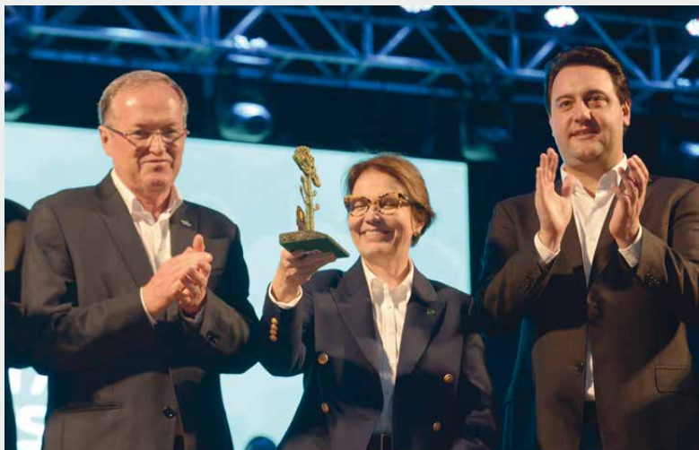
Setor reconheceu o empenho e o trabalho da ministra em prol da agropecuária e do cooperativismo

O Troféu Ocepar foi instituído pela diretoria da Ocepar há 42 anos, em julho de 1977, durante uma solenidade em comemoração ao Dia Internacional do Cooperativismo. Ele é entregue às pessoas que se destacam dentro e fora do cooperativismo. Trinta e nove personalidades já receberam a honraria, entre governadores, ministros, lideranças políticas, empresariais e do cooperativismo.