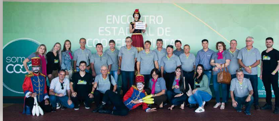
Sicredi Fronteiras Capanema