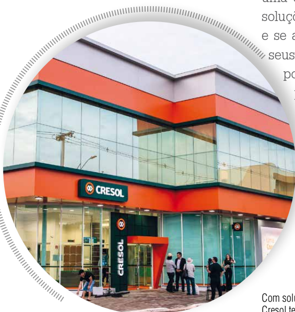
Com soluções financeiros para todos os públicos, Cresol tem foco no relacionamento e no atendimento personalizado a seus cooperados

Neste ano, a Cresol dá continuidade ao seu projeto de expansão, levando uma estrutura moderna e confortável para atendimento ao cooperado, seja em municípios de pequeno ou grande porte. Para 2020, ano em que celebra o aniversário de 25 anos, a cooperativa vai abrir 40 novas agências de relacionamento e mais de 100 unidades vão passar por reestruturação, com um novo layout e conceito. “Nesse mundo onde as coisas estão em constantes mudanças, o grande aprendizado das cooperativas foi andar junto com as inovações, mas sem perder a essência de estar próxima de quem precisa, por isso hoje o relacionamento é o nosso grande diferencial”, conclui Michelin. ■