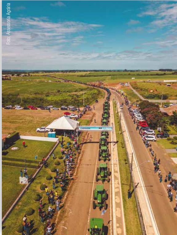
Mega Encontro de Tratores reuniu 1.529 máquinas, mostrando ao mundo a força do agronegócio nacional

A programação teve início com a reabertura do Museu Histórico de Entre Rios, que estava fechado há cerca de um ano para adequações. Houve ainda a inauguração