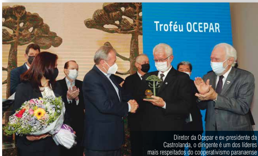
Diretor da Ocepar e ex-presidente da Castrolanda, o dirigente é um dos líderes mais respeitados do cooperativismo paranaense