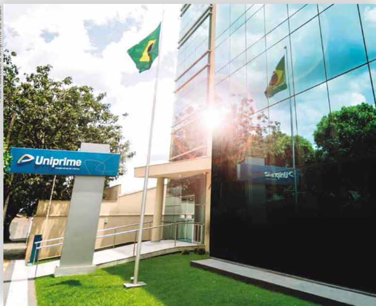
Sede administrativa da cooperativa, em Londrina (PR)

o crédito rural, que destina-se ao financiamento do ciclo produtivo do agronegócio, com foco no custeio dos insumos.