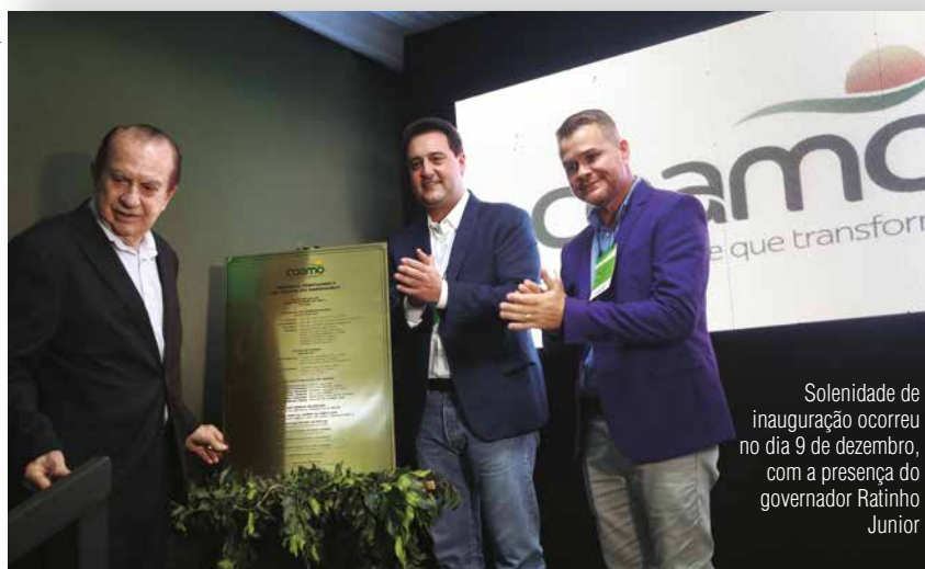
Solenidade de inauguração ocorreu no dia 9 de dezembro, com a presença do governador Ratinho Junior