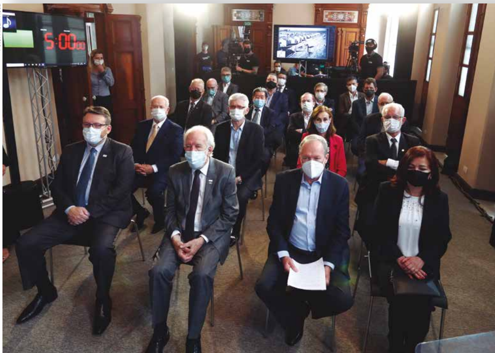
Durante a programação, o público conheceu um pouco da trajetória da Ocepar e do BRDE