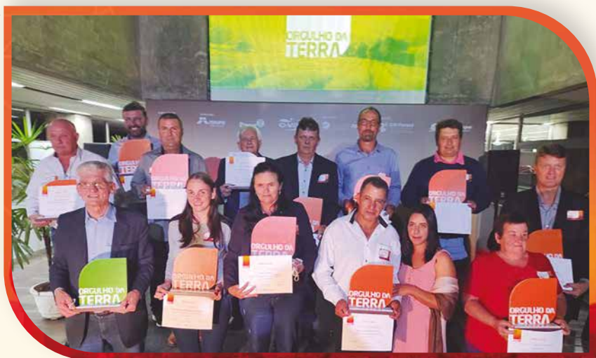
Vencedores foram eleitos por um comitê de notáveis