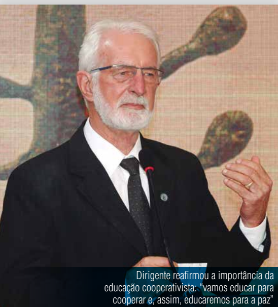
Dirigente reafirmou a importância da educação cooperativista: “vamos educar para cooperar e, assim, educaremos para a paz”