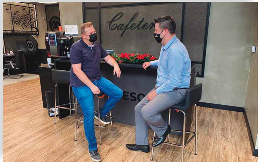
Valor de R$ 28 milhões foi repassado aos cooperados

“A Cresol possui soluções financeiras competitivas e personalizadas, seja para o público agro, empresarial ou pessoa física. Já somos mais de 260 mil cooperados fazendo parte do Sistema Cresol Baser e que poderão usar essa remuneração, somada ao seu capital social, como uma reserva finan-