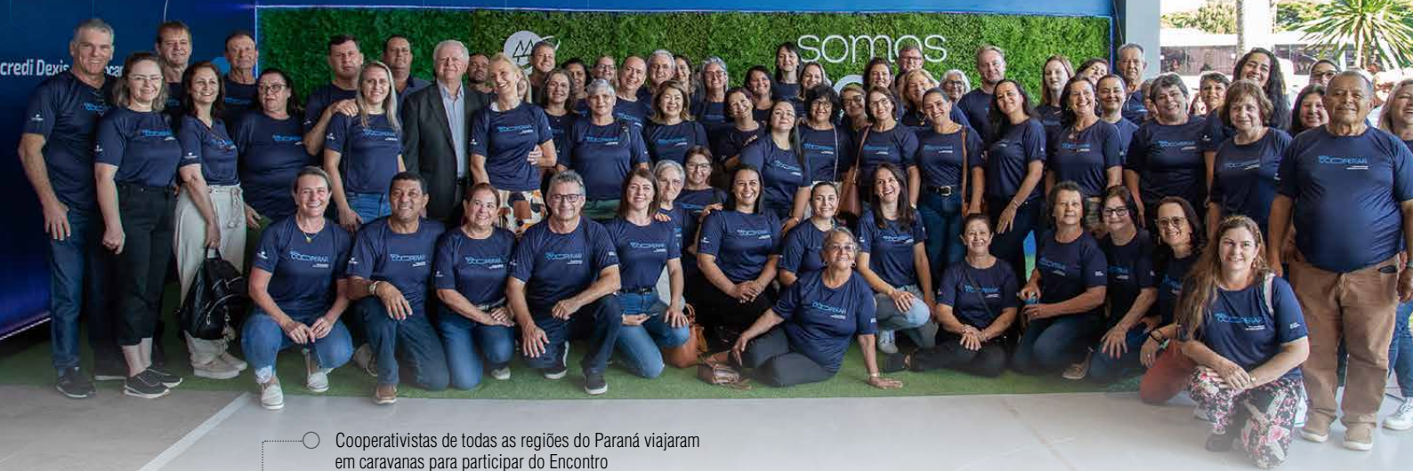
Cooperativistas de todas as regiões do Paraná viajaram em caravanas para participar do Encontro