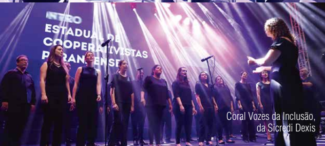
Coral Vozes da Inclusão, da Sicredi Dexis