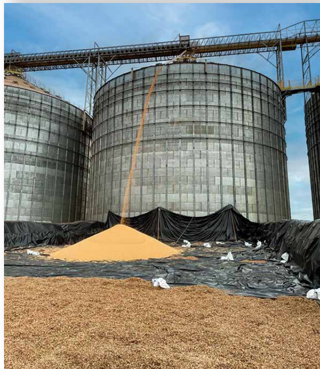
Exemplo de silo-piscina construído em Arapuã (PR)

“Hoje, o custo de construção de um armazém gira em torno de R$ 1.200 a R$ 1.500 por tonelada estática. Com R$ 50 milhões, dá para construir um armazém para 35 mil a 40 mil toneladas. Porém, isso ainda está aquém das 9 milhões de toneladas em déficit das cooperativas ou dos 15 milhões do Paraná, mesmo que várias cooperativas invistam em armazenamento”, analisa Turra. ■