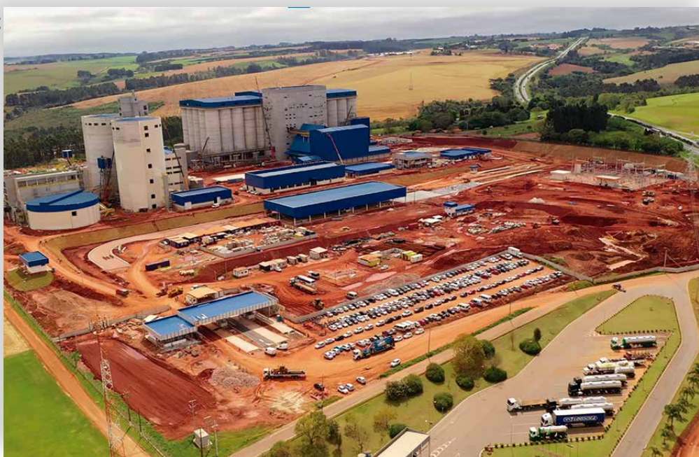
Intercooperação entre seis cooperativas viabiliza a construção da Maltaria Campos Gerais, em Ponta Grossa