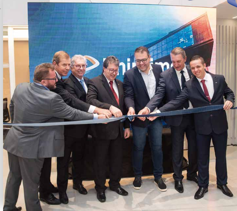
Cooperativa quer oferecer uma excelente experiência de atendimento à população da cidade