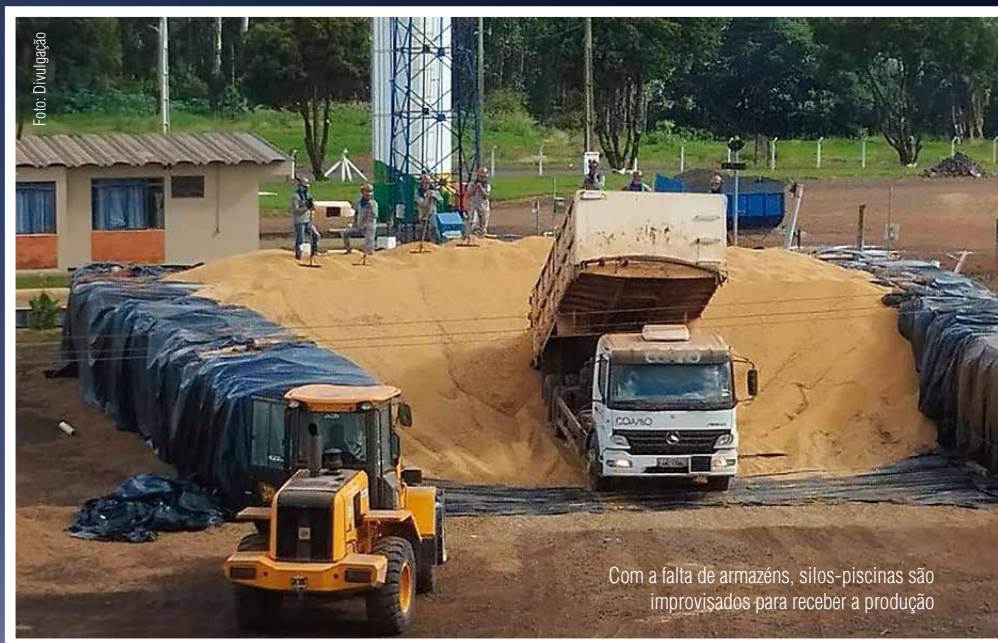
Com a falta de armazéns, silos-piscinas são improvisados para receber a produção

Outra forma de armazenagem provisória é o uso de silos bolsa, embora essa opção envolva custos de aluguel ou compra. Cada bolsa de lona, que tem aproximadamen- >>